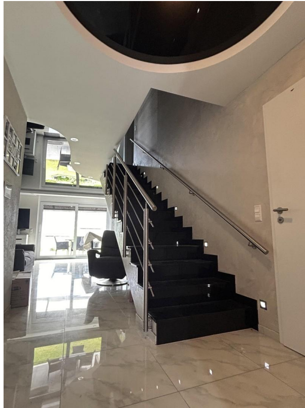
Treppe zum DG