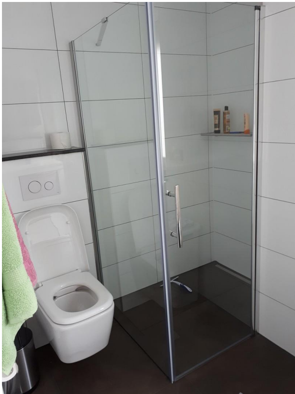
EG Gäste WC/ Dusche