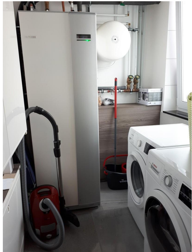
EG HWR/ Waschraum