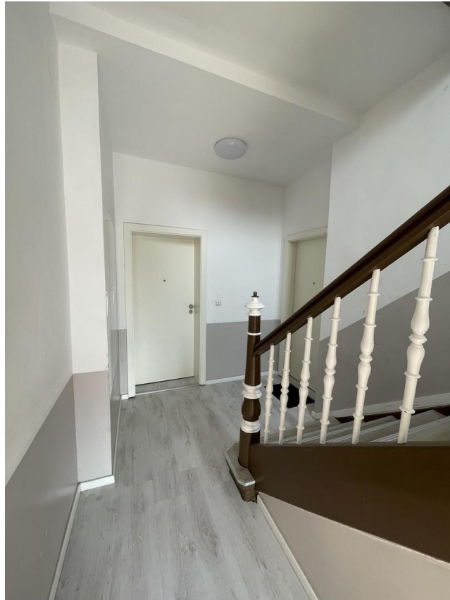
Leuchtbergstr. 6 _ Treppenhaus