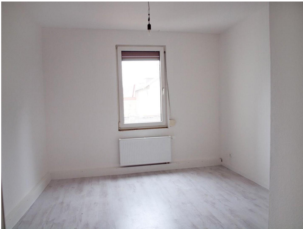
Wohnraum _ Leuchtbergstr. 6