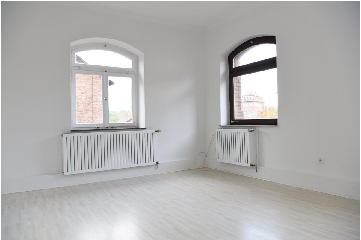
Wohnraum EG_Landstr. 57