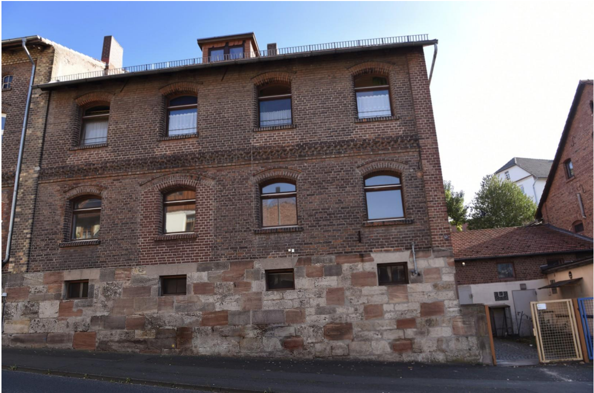
Vorderseite _ Landstr. 57