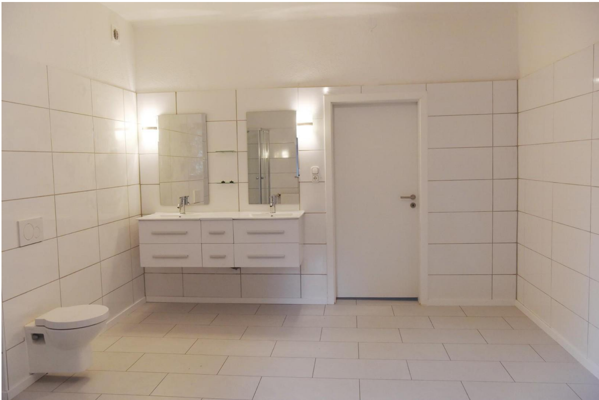
Bad 1 _ Landstr. 57