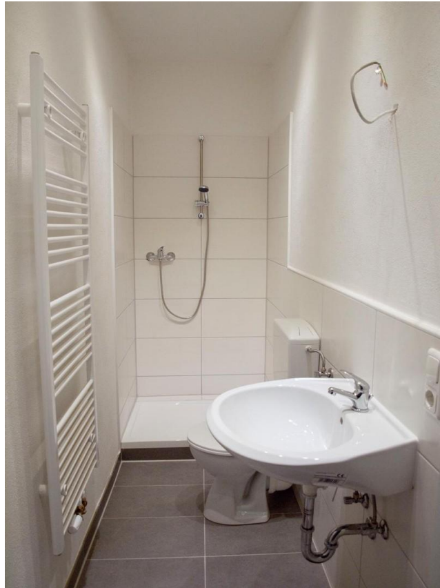
Bad 4 _ Leuchtbergstr. 6