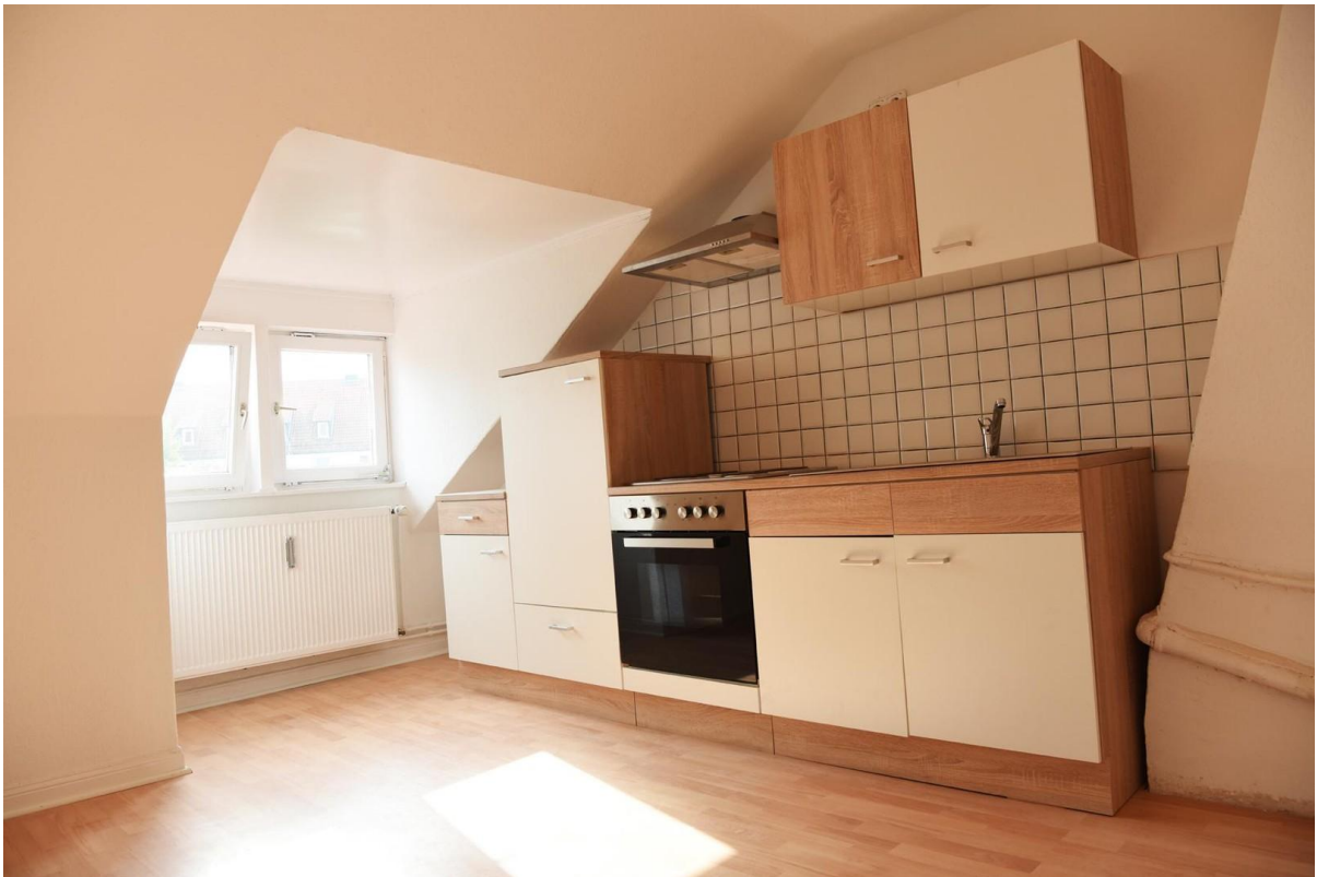
Küche DG _ Landstr. 57