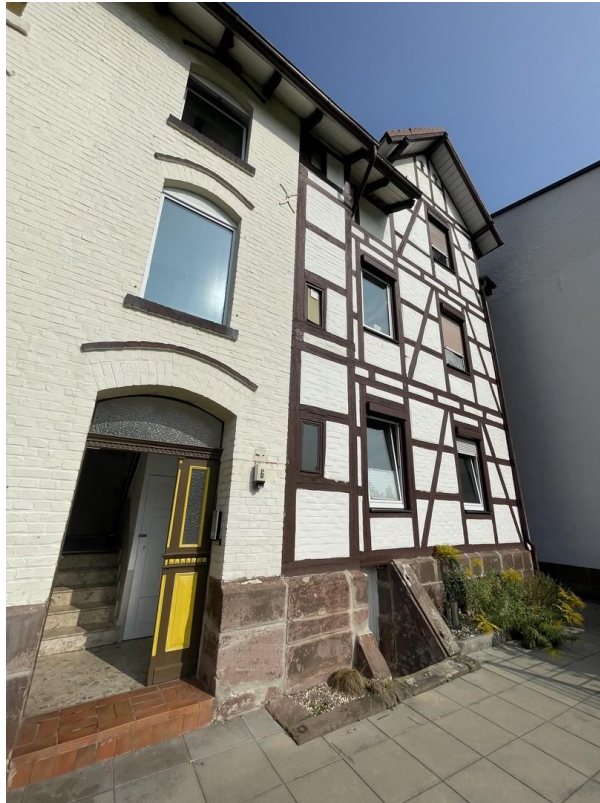
Leuchtbergstr. 6 _ Rückseite