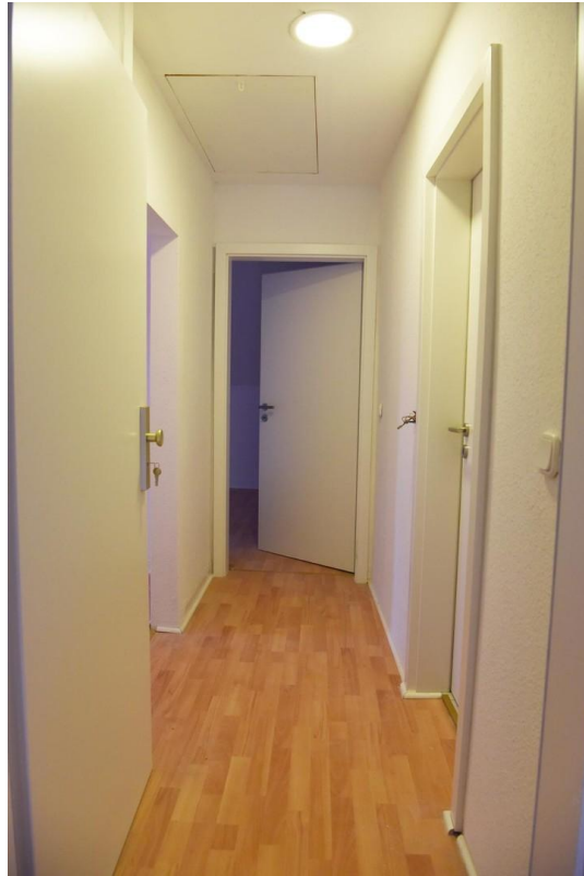
Flur DG _Landstr. 57