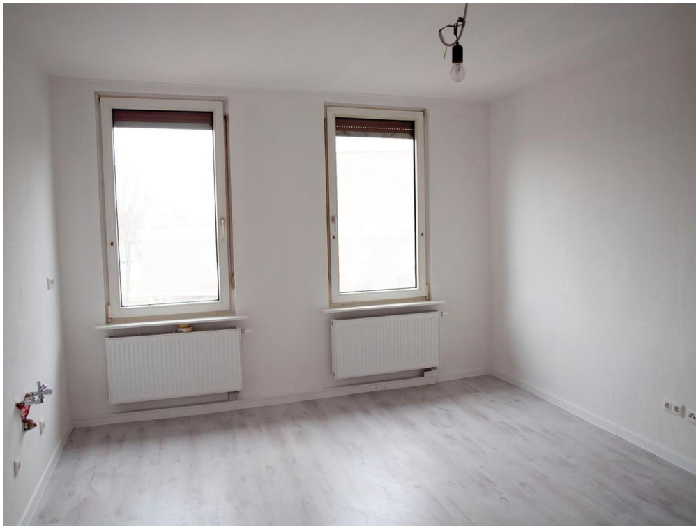
Wohnraum _ Leuchtbergstr. 6