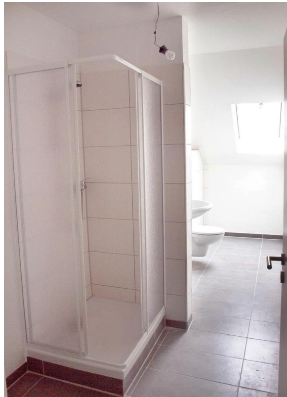
Bad 1 _ Leuchtbergstr. 6