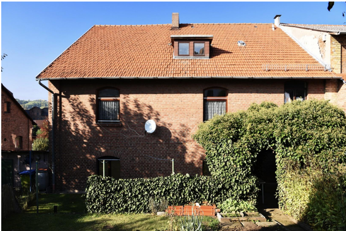
Rückseite _ Landstr. 57