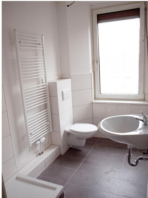
Bad 3 _ Leuchtbergstr. 6