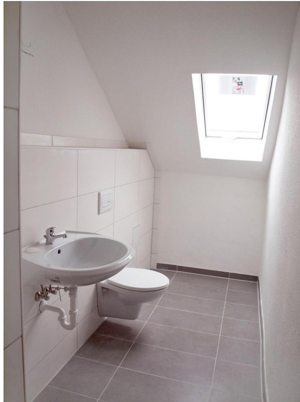
Bad 2 _ Leuchtbergstr. 6