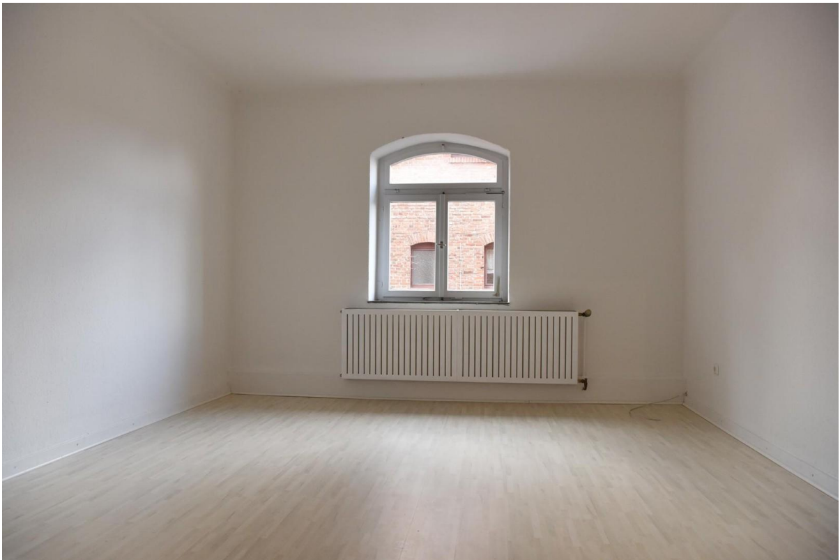
Wohnraum EG_Landstr. 57