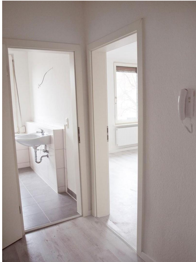
Flur, Bad, Wohnraum _ Leuchtbe