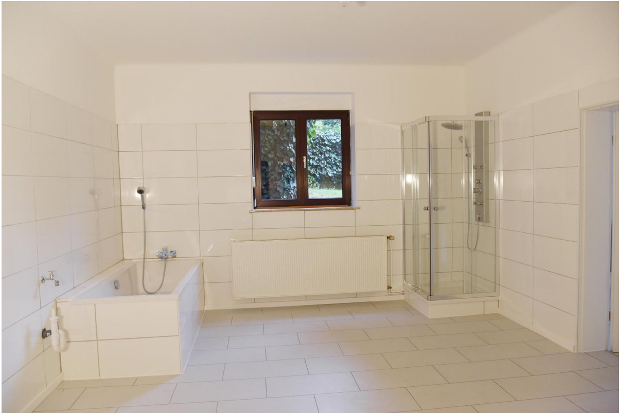
Bad 1 _ Landstr. 57