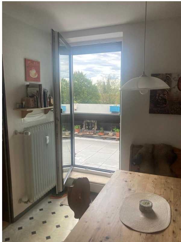
Küche mit Dachterrasse