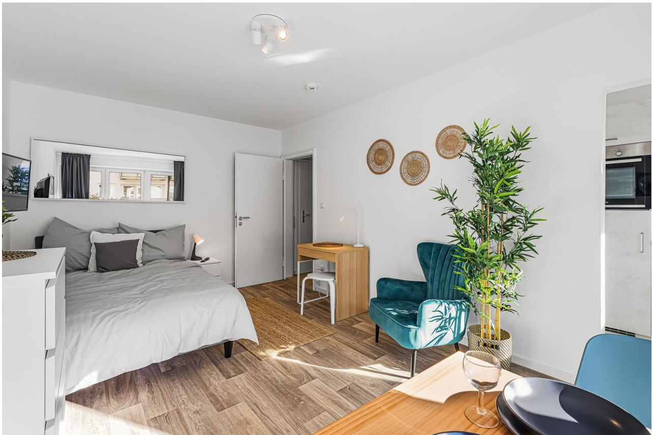
Wohnraum von Balkon aus