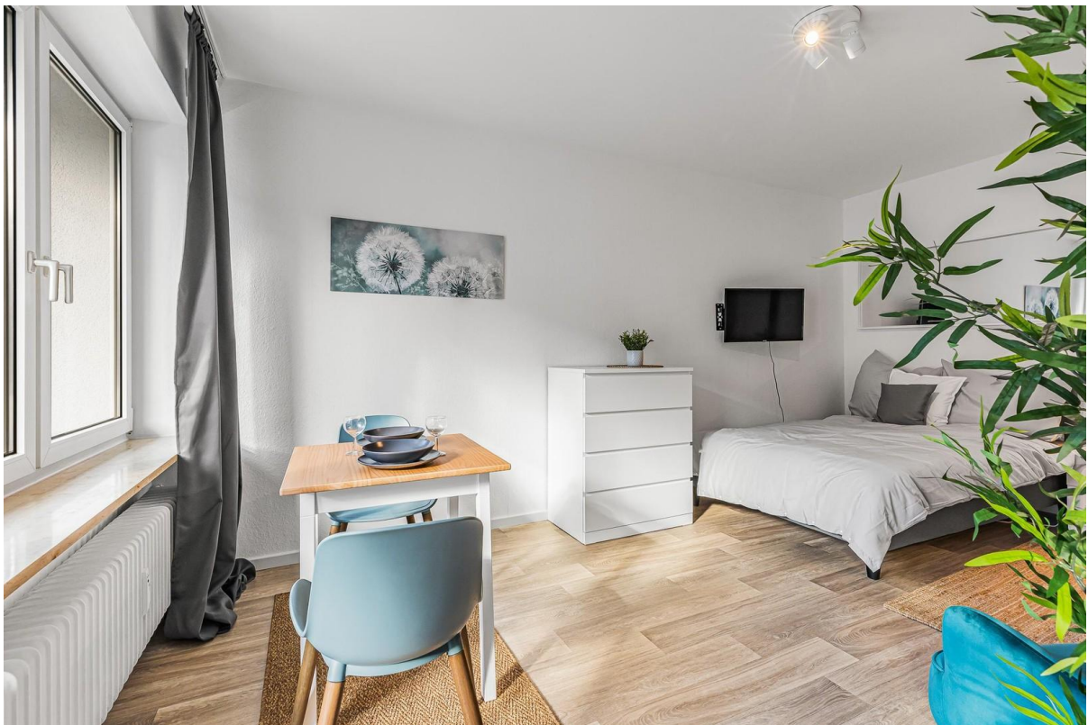
Wohnraum von Küche aus