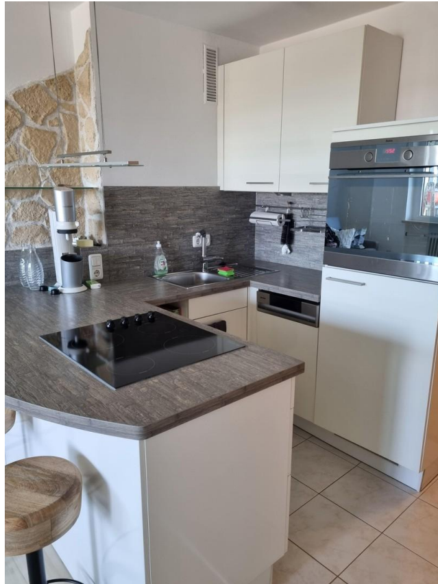
Theke mit Kochfeld