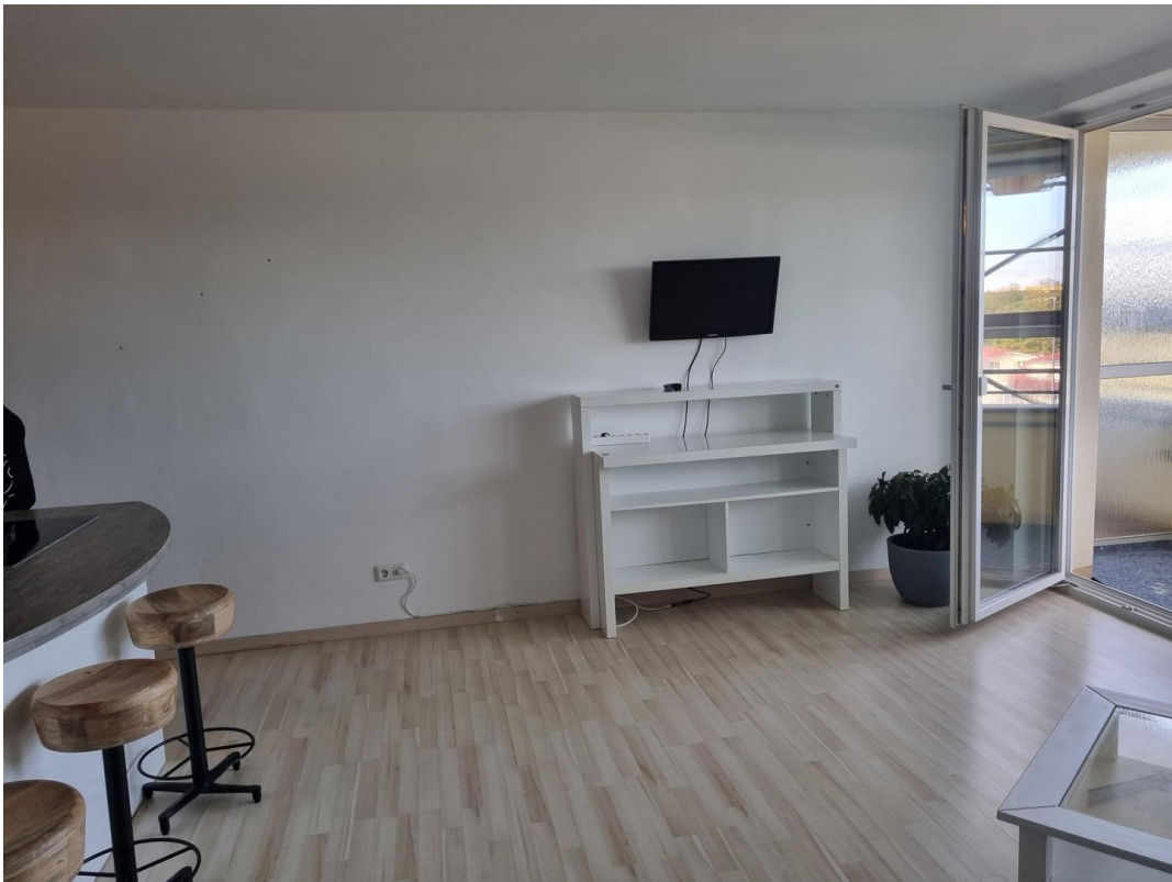
Wand zur Balkontüre