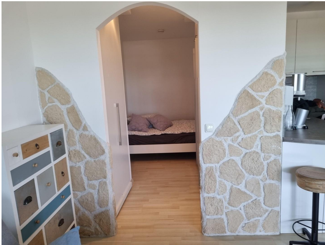
Blick in den Schlafbereich