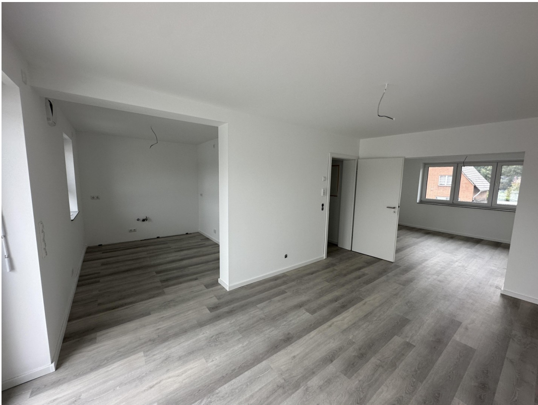
OG Esszimmer & Küche