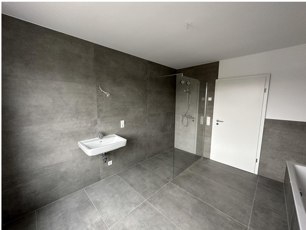
DG Badezimmer inkl. Fenster