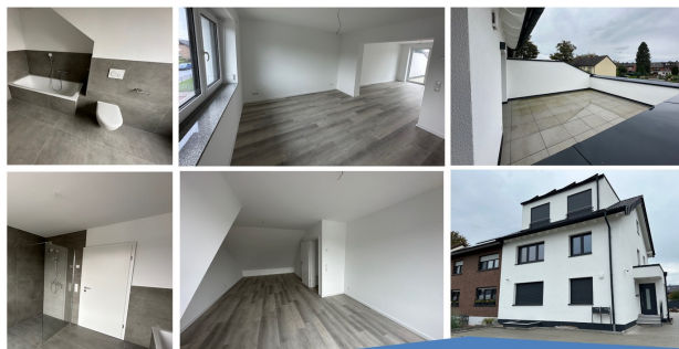
mit Dachterrasse, Fußbodenheizung, Stellplätzen & Glasfaser