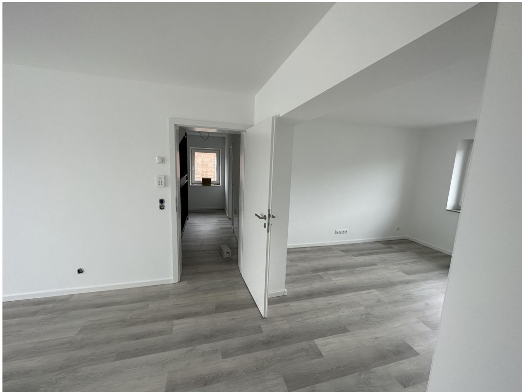
OG Wohn- & Esszimmer