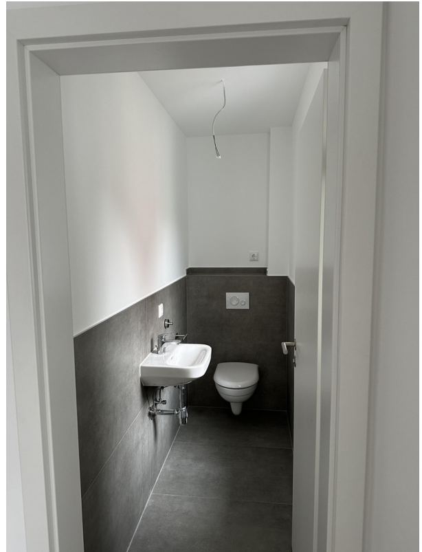
OG Gäste-WC inkl. Fenster