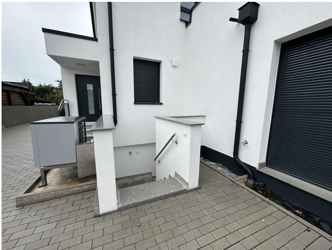
Eingang Waschküche & Kellerr.