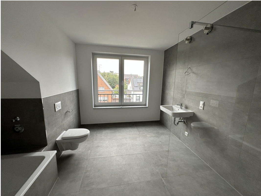
DG Badezimmer inkl. Fenster