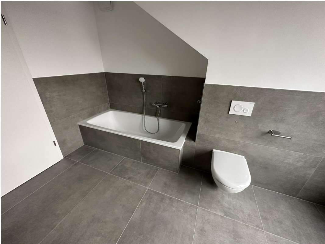
DG Badezimmer inkl. Fenster