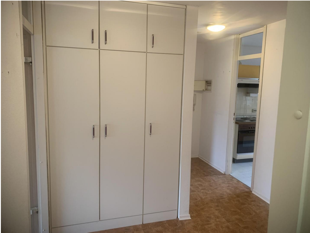
Flur mit Einbauschränken