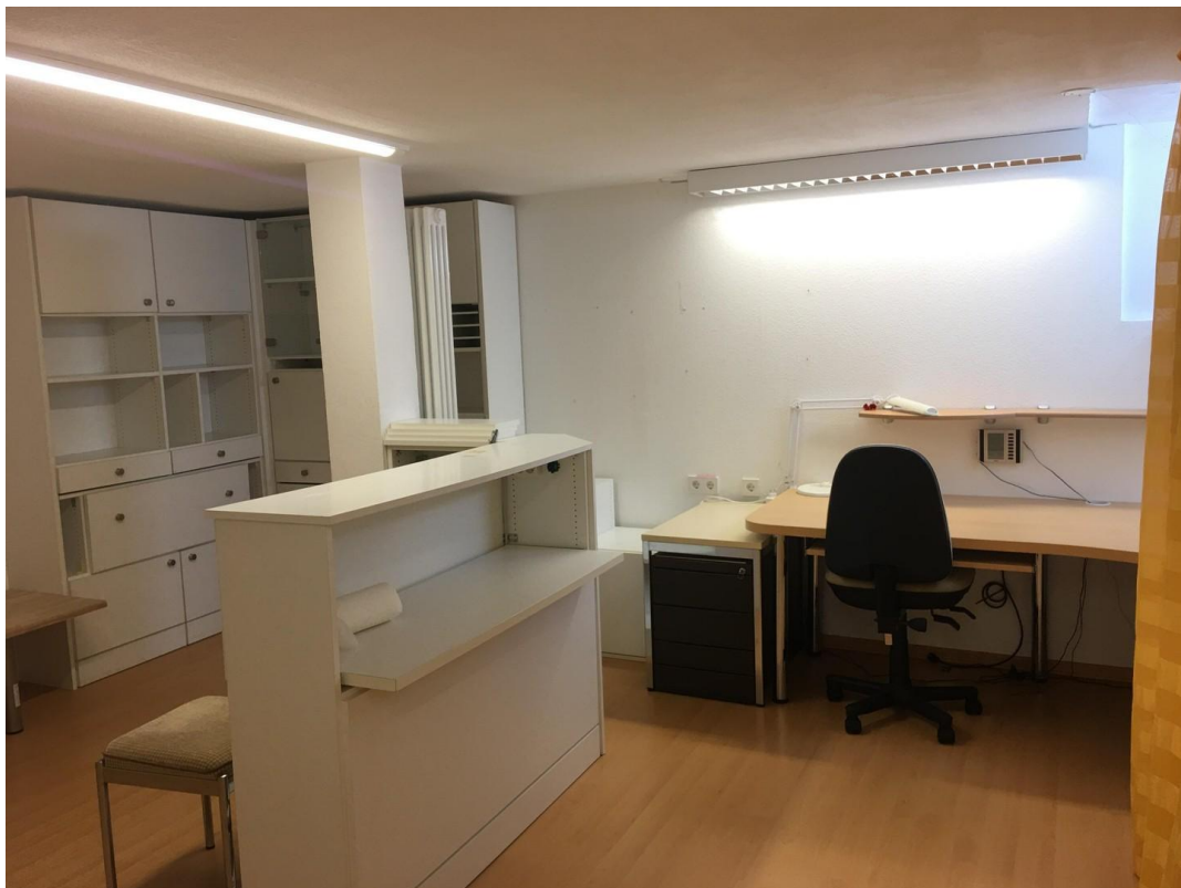
Hobbyraum/Büro mit Tageslicht