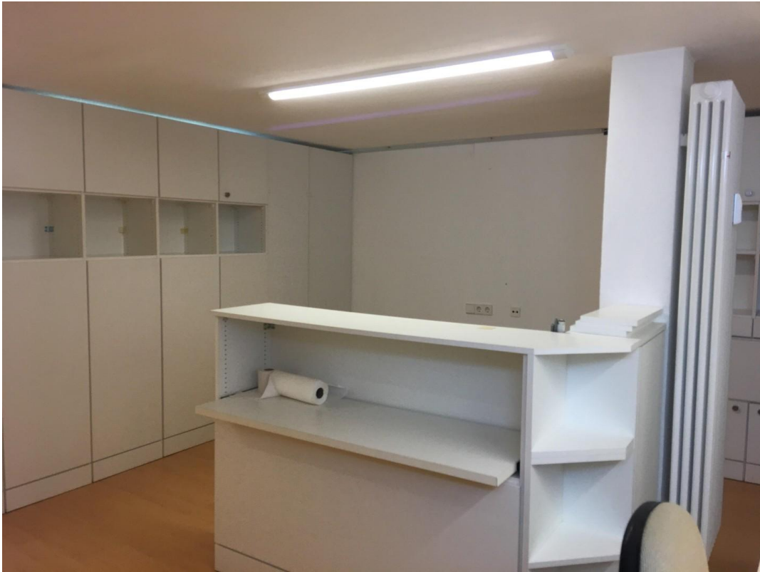
Hobbyraum/Büro mit Tageslicht