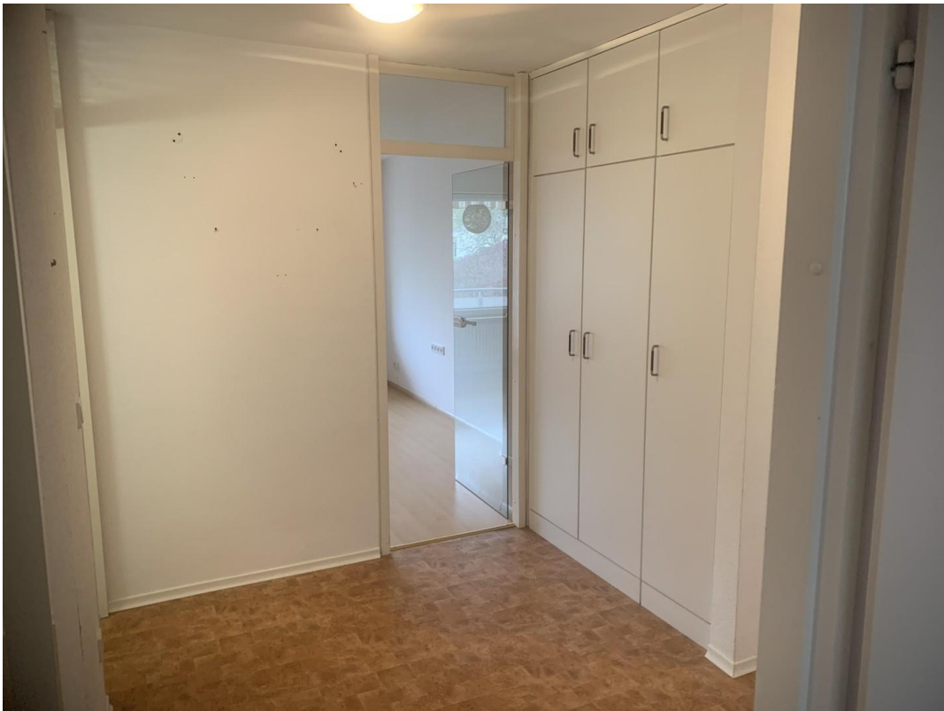
Flur mit Einbauschränken