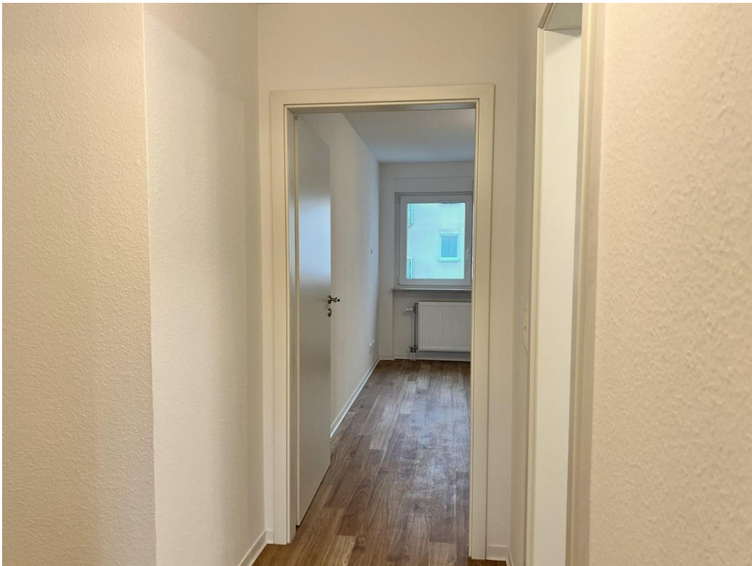
Flur zu Bad