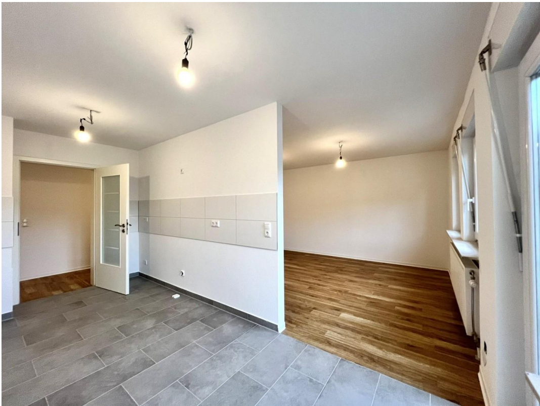
Küche und Wohnzimmer