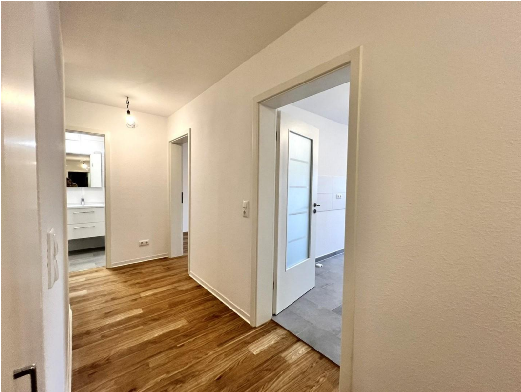
Flur zu Küche