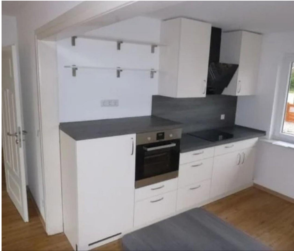
Backofen, Kochfeld, Kühl-Gefr.