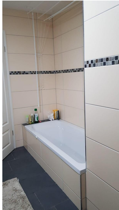
Bad mit Wanne...