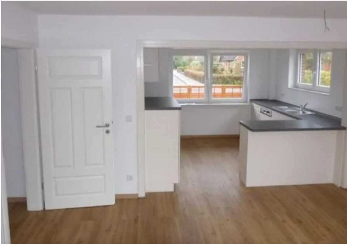
Küche mit Geschirrspüler...