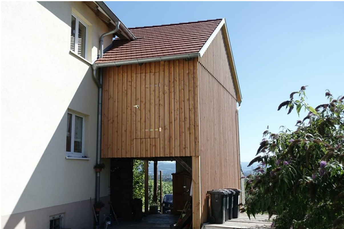
Ansicht von der Straße