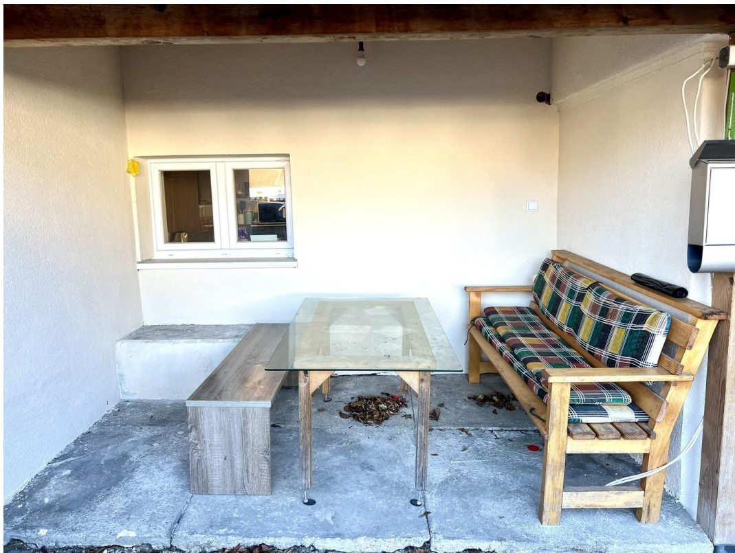
überdachte Terrasse des Apartm