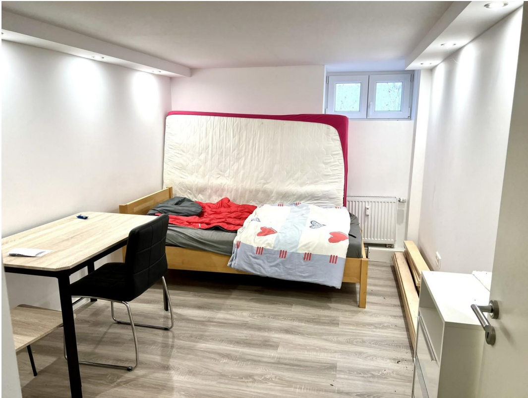
11m2 Nutzraum - Bild 1