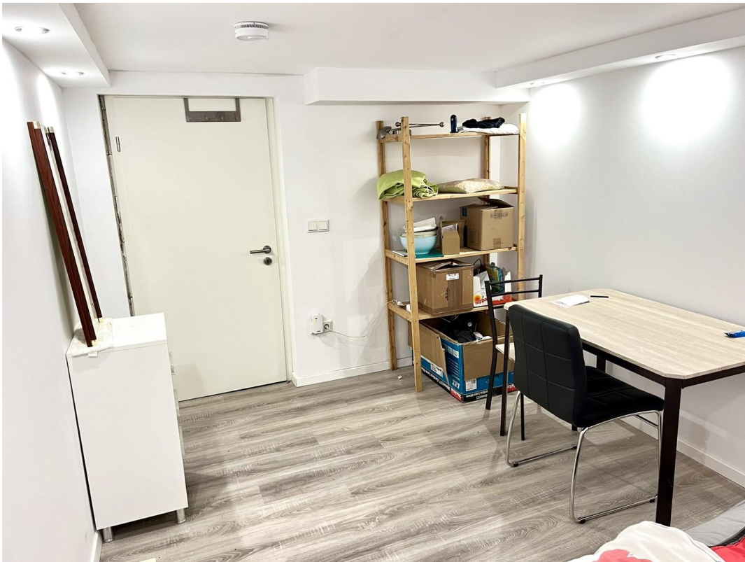
11m2 Nutzraum - Bild 2