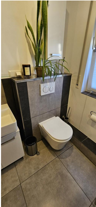
Bd mit WC