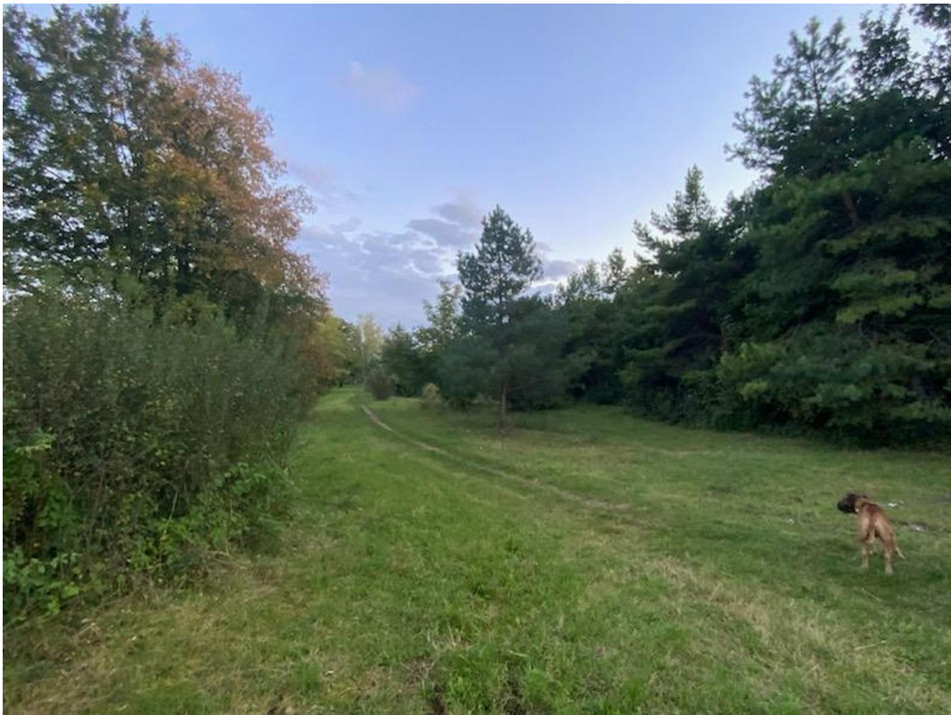
Hinter dem Garten