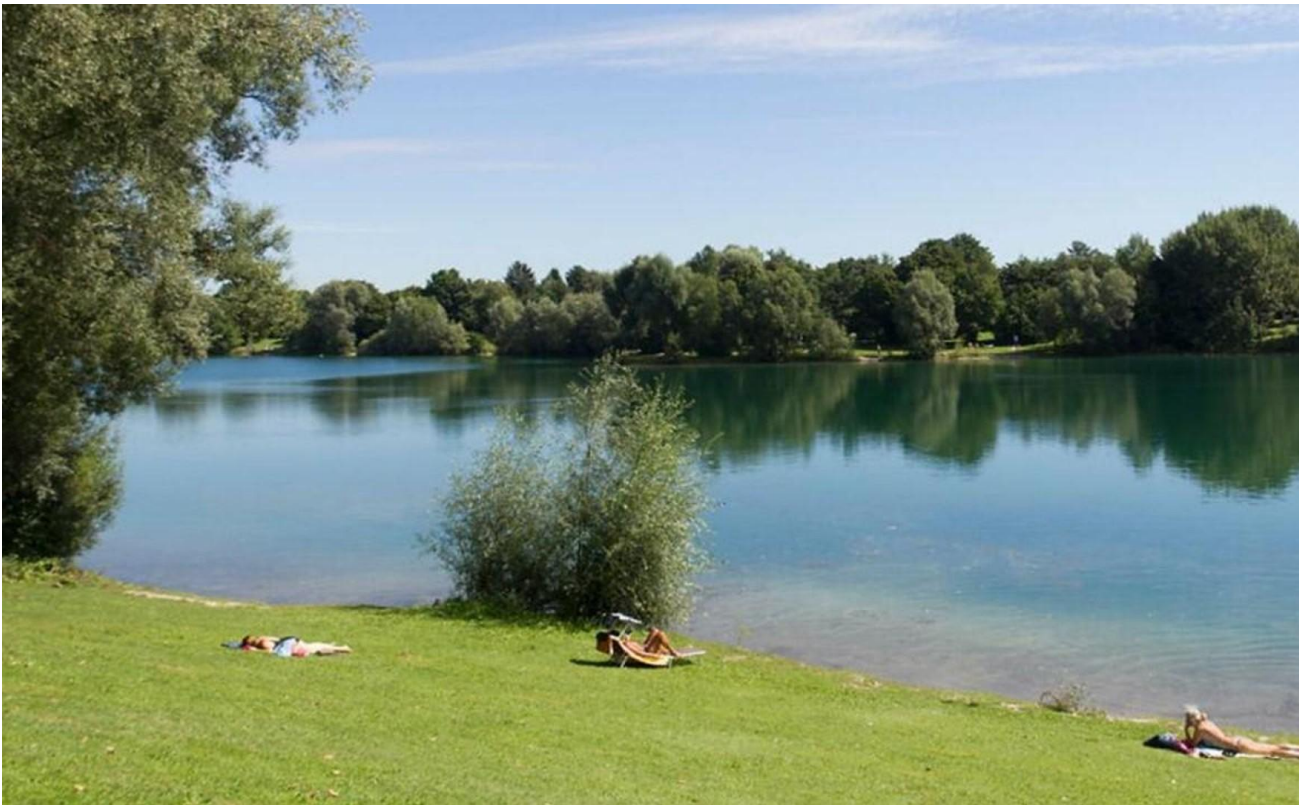
Der Lerchenauer See