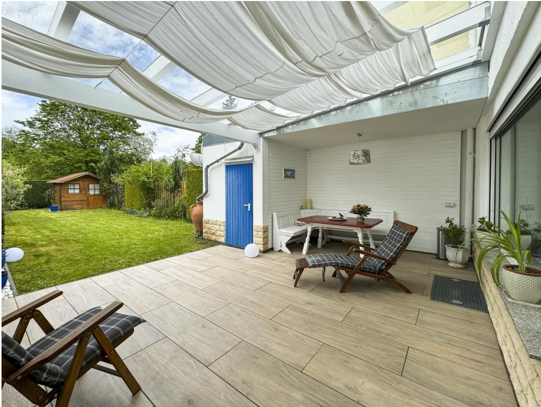
Sitzecke und Terrasse