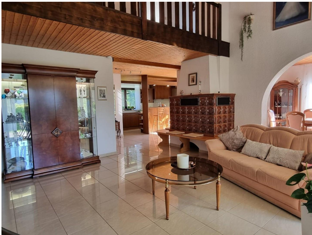
Wohnzimmer mit Galerie