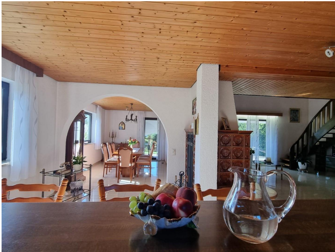
Blick aus der Küche