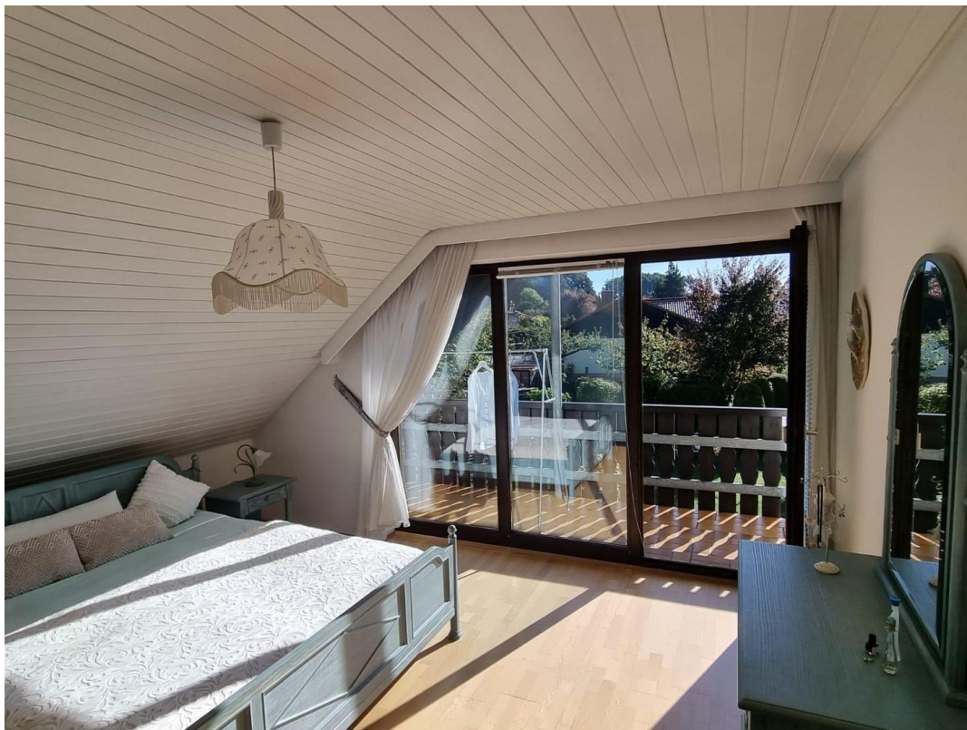
Schlafzimmer mit Balkon