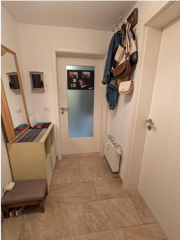
Flur zur Küche