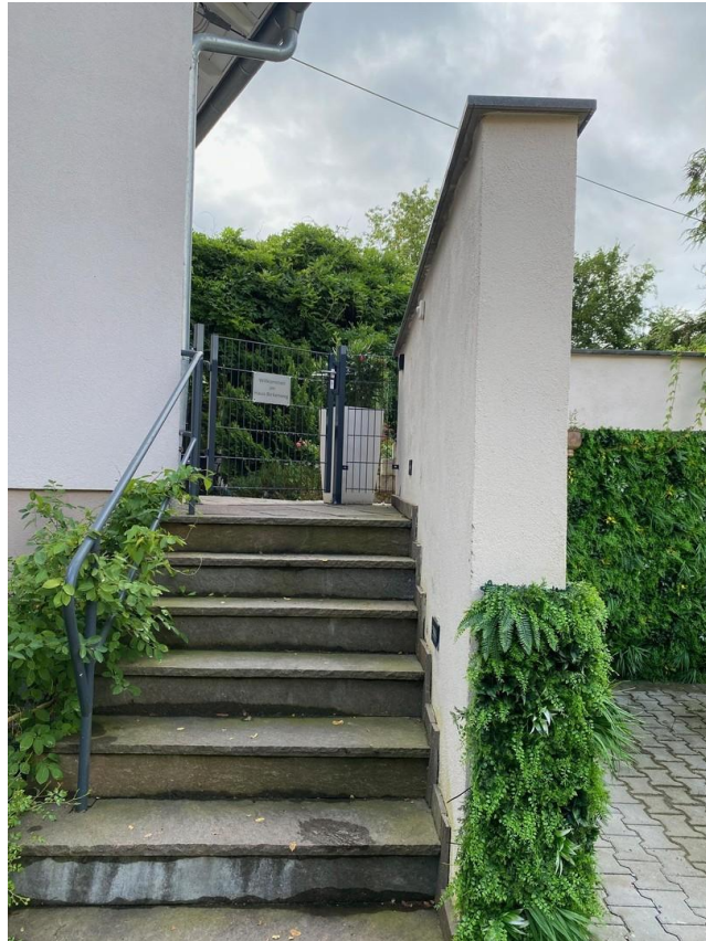
Zugang Garten EG