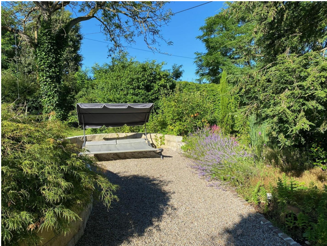
Steingarten im EG