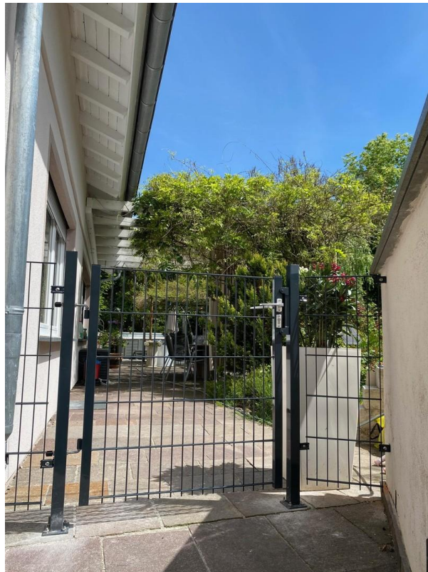
Zugang Garten und EG-Wohnung