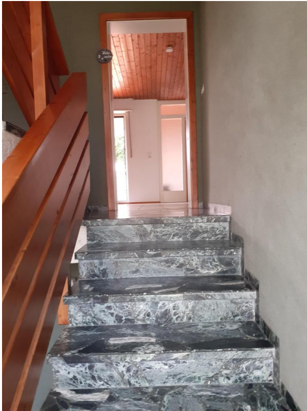
Treppenhaus Eingang zur Wohnung