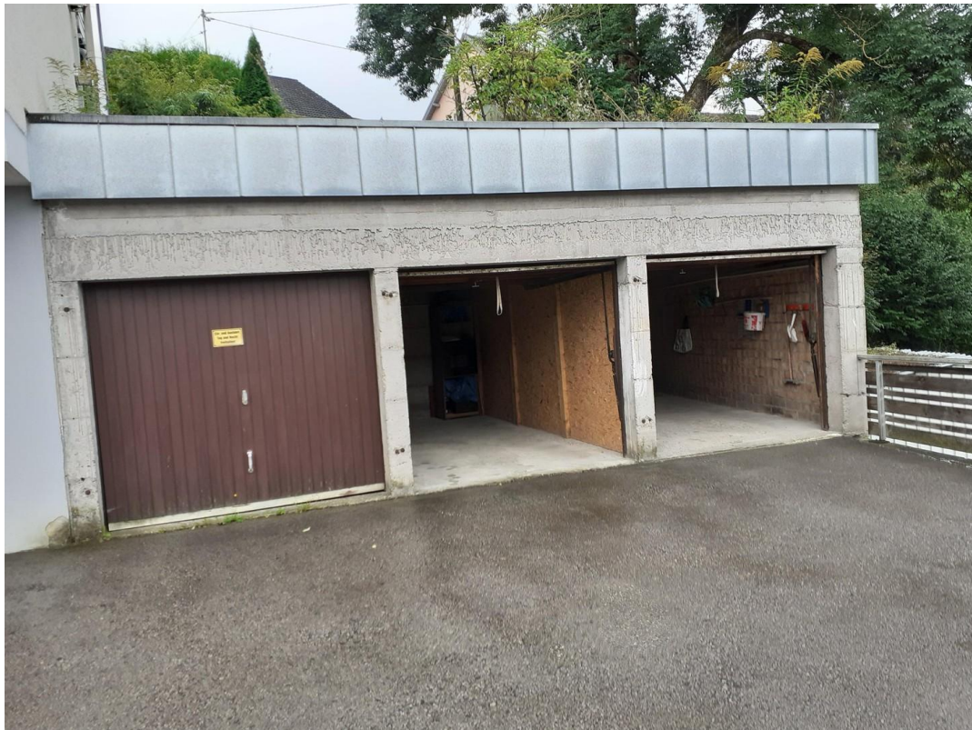
2 Garagen- Stellplatz