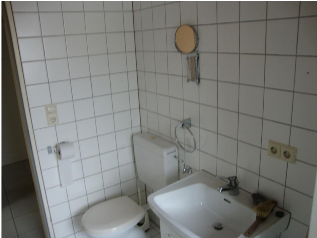
altes Bad (geplanter Umbau)