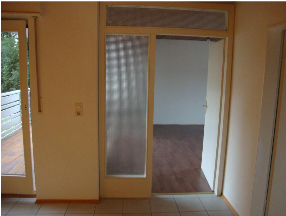
Esszimmer, Zugang Balkon