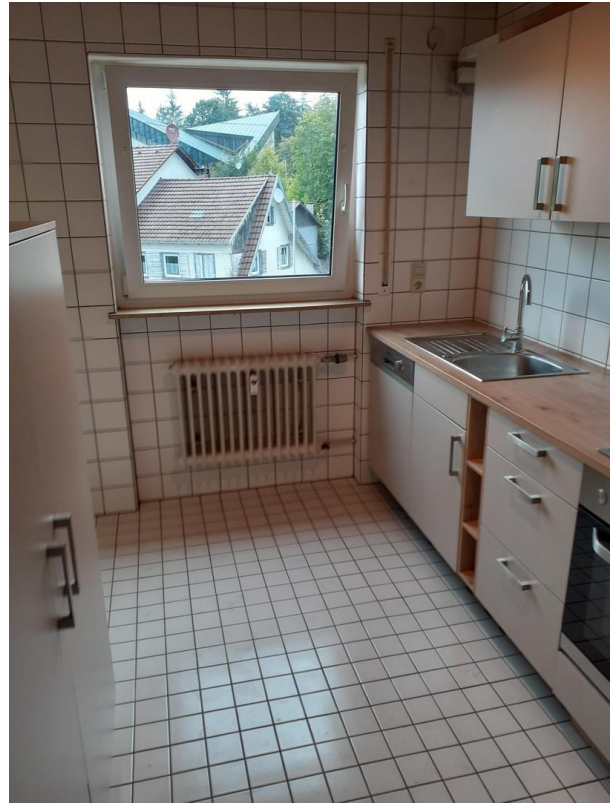
Küche mit Einbauküche