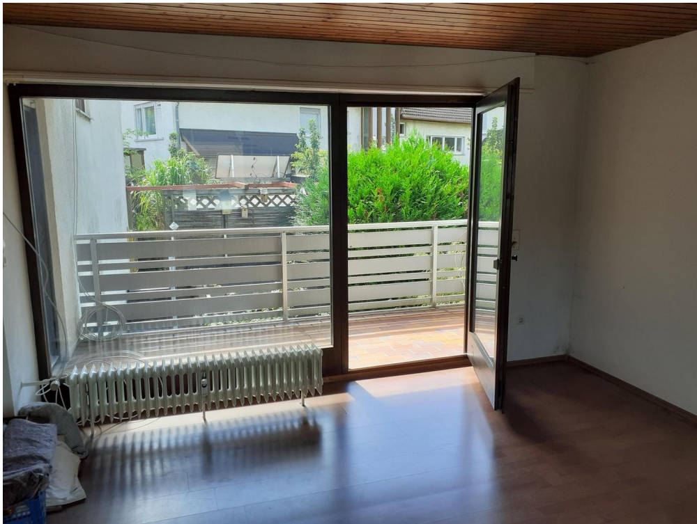
Wohnzimmer mit Ausgang Balkon