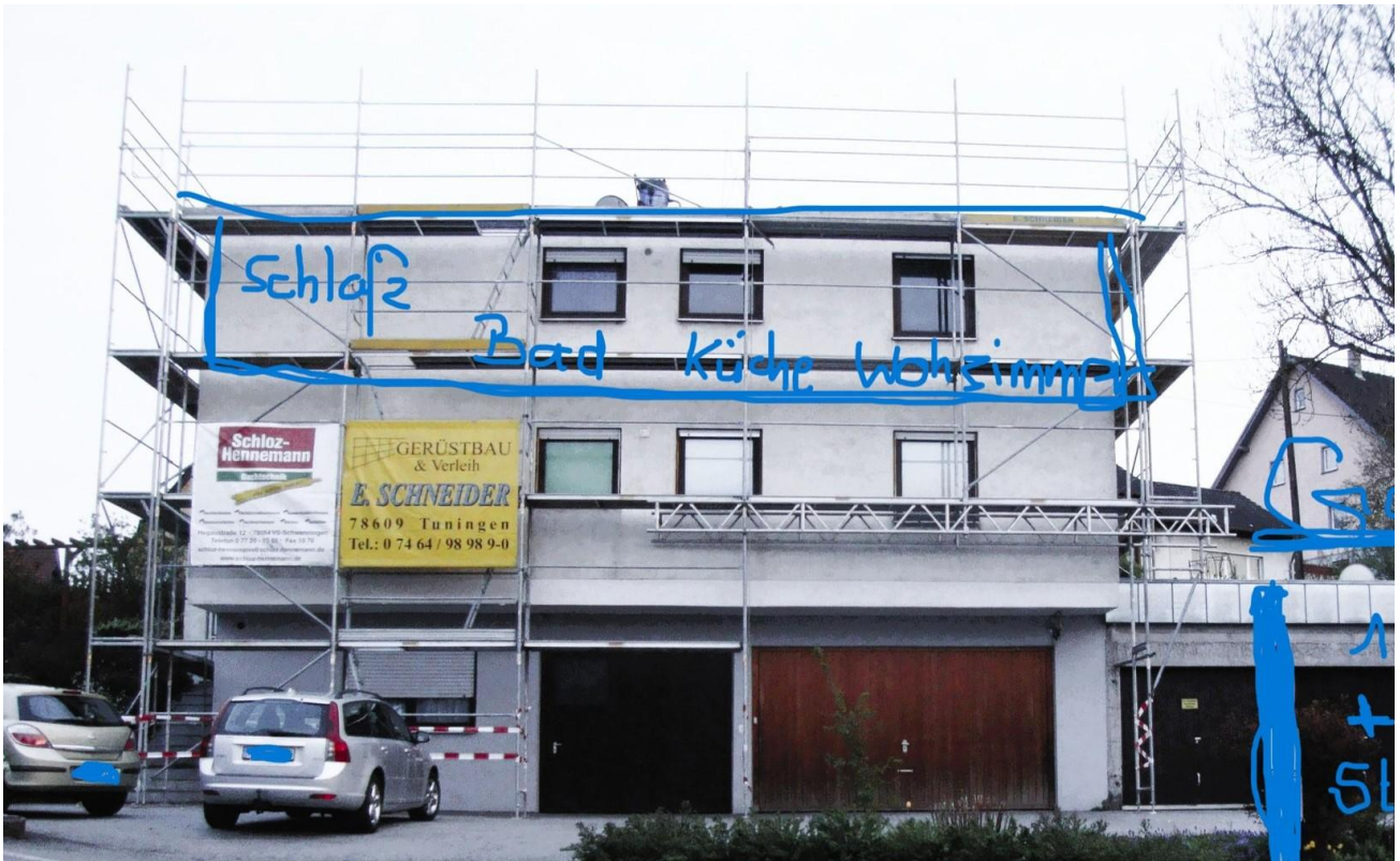
Da ist die Wohnung