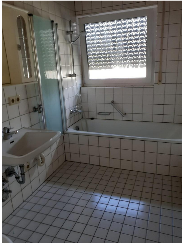
altes Bad im Umbau