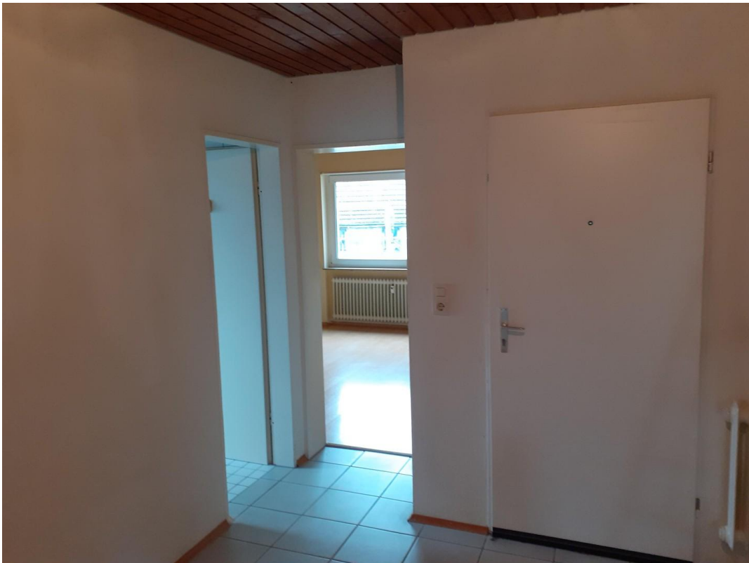
Essz.-Diele, Zugang - Schlafz