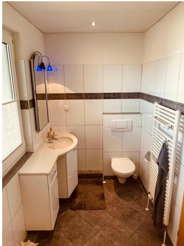
Badezimmer 1. OG