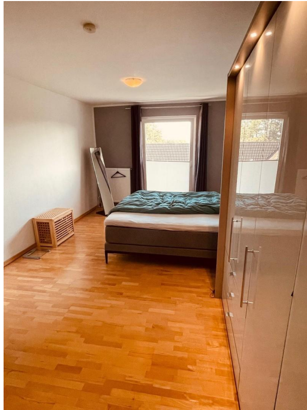
1. OG Zimmer 2