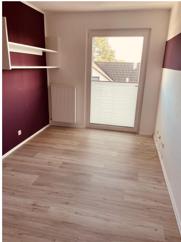
1. OG Zimmer 3