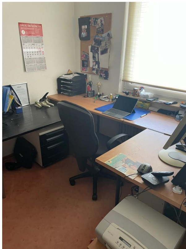
1. OG Zimmer 1