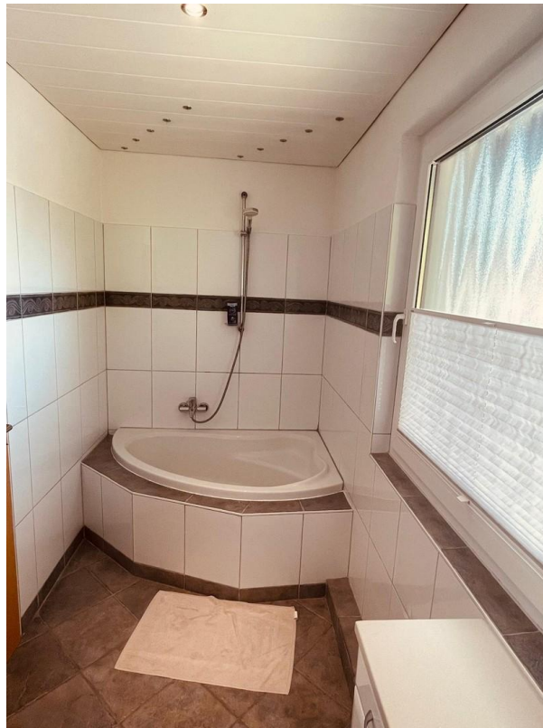
Badezimmer 1. OG