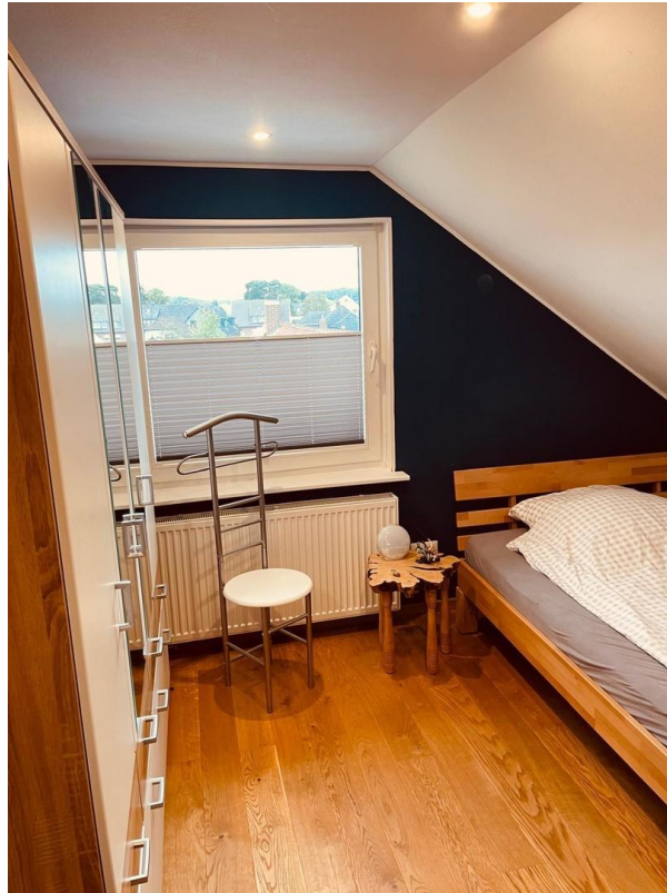
Dachgeschoss Zimmer 2