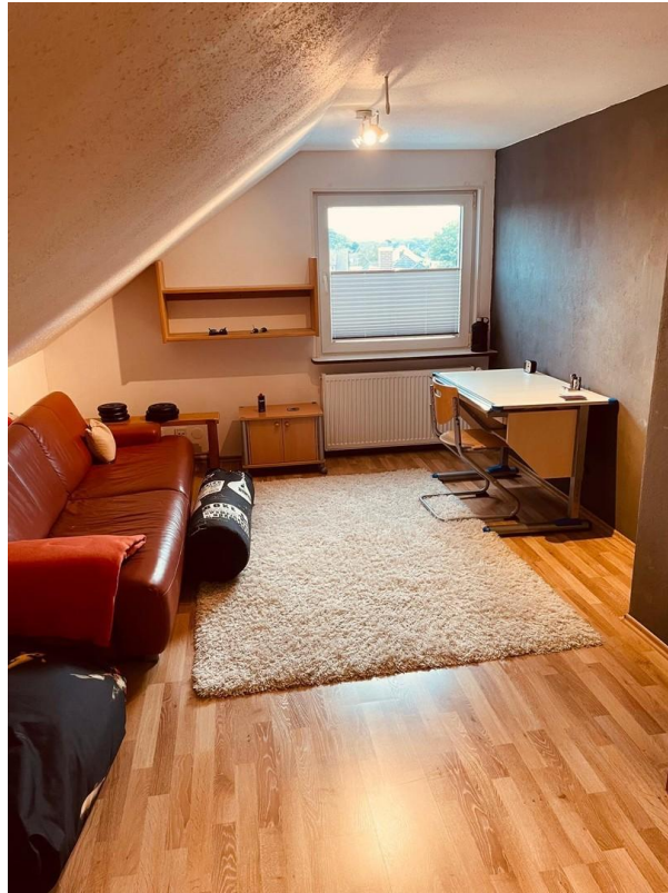
Dachgeschoss Zimmer 1