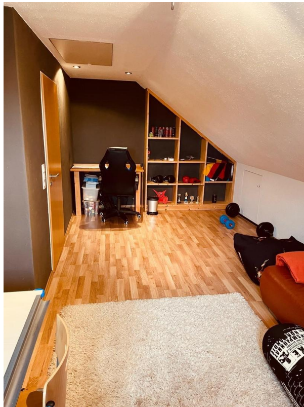
Dachgeschoss Zimmer 1