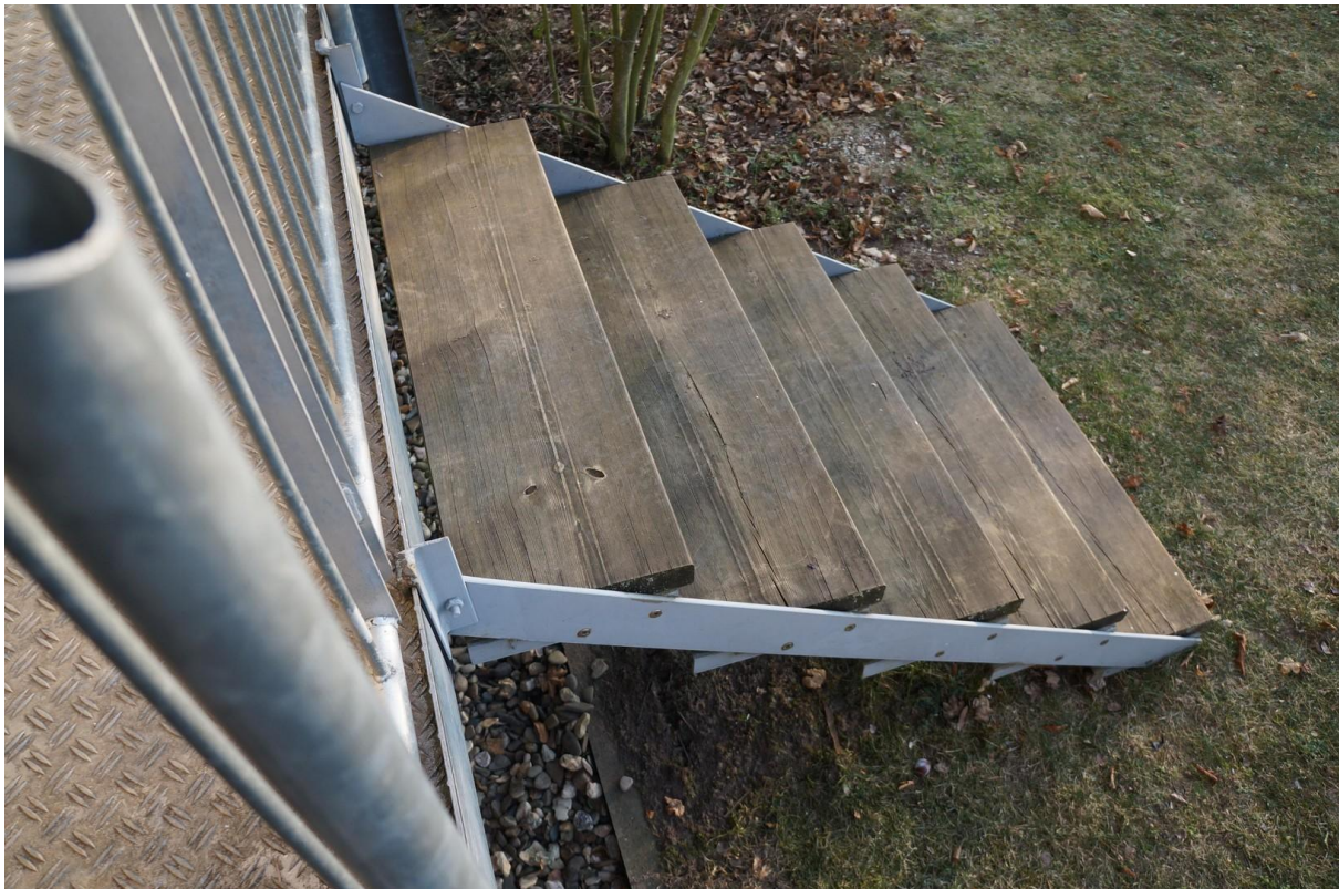
Treppe in den Garten