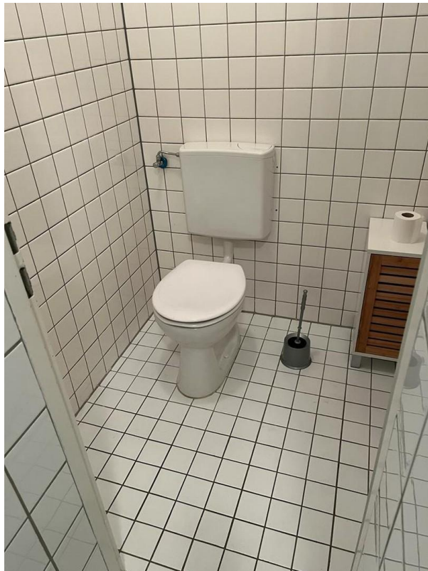
WC im UG