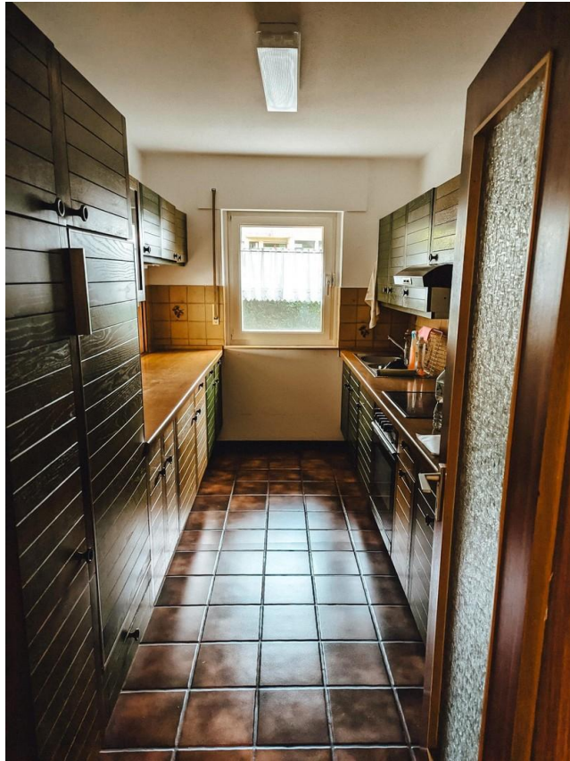
Alte Küche (wird ersetzt)