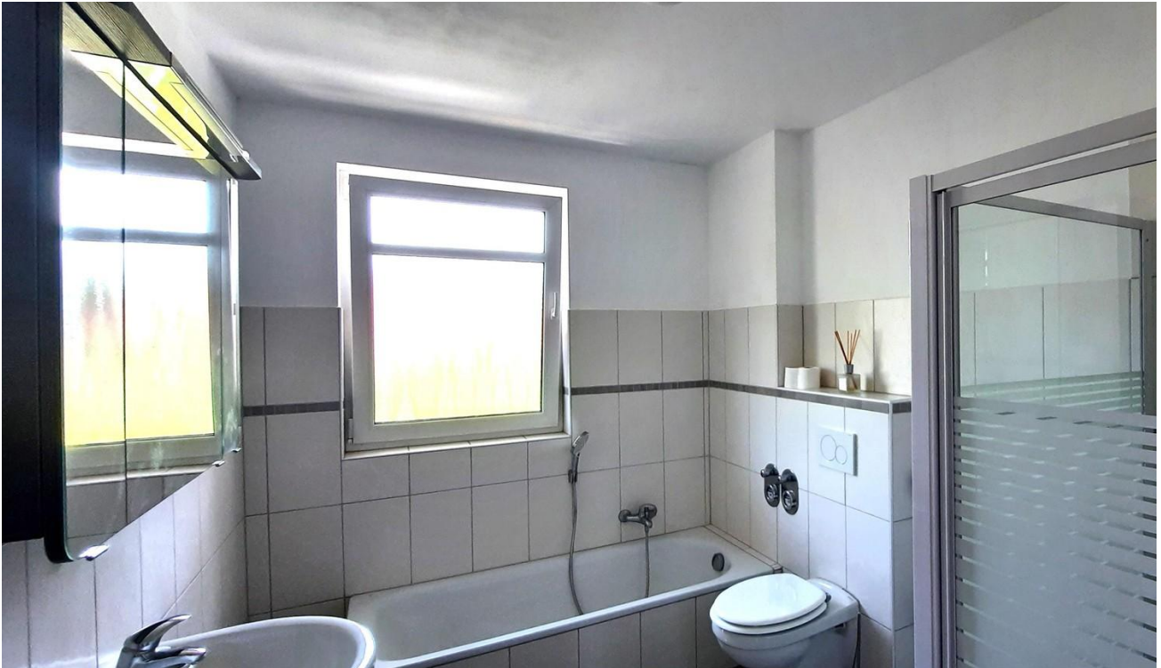
Vollbad mit Waschma. Anschl.