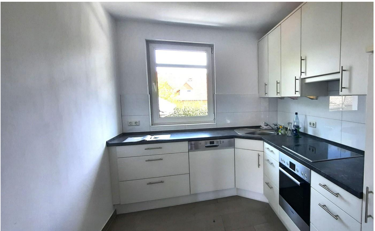
Küche Hochglanz Weiß