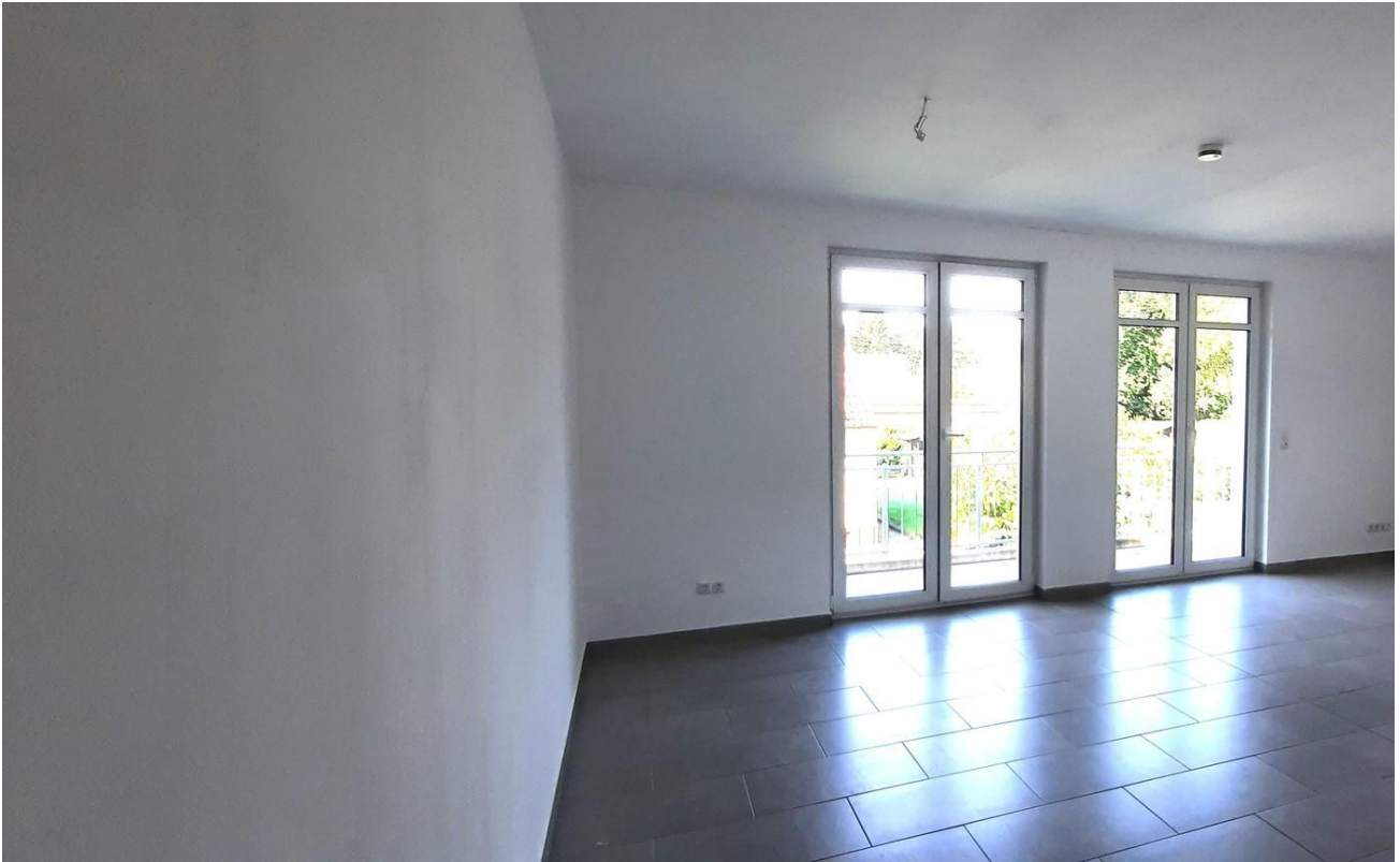
Wohn- Esszimmer mit Balkon