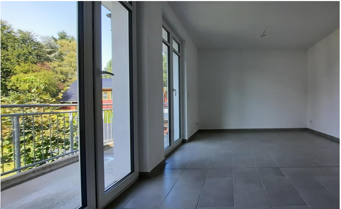
Wohn- Esszimmer mit Balkon