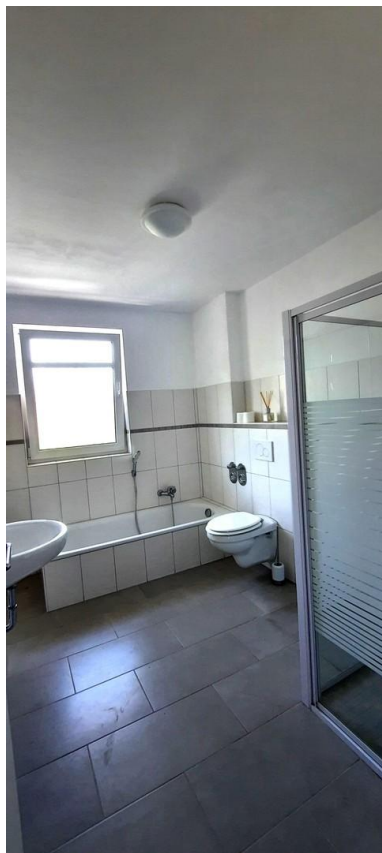
Vollbad mit Waschma. Anschl.