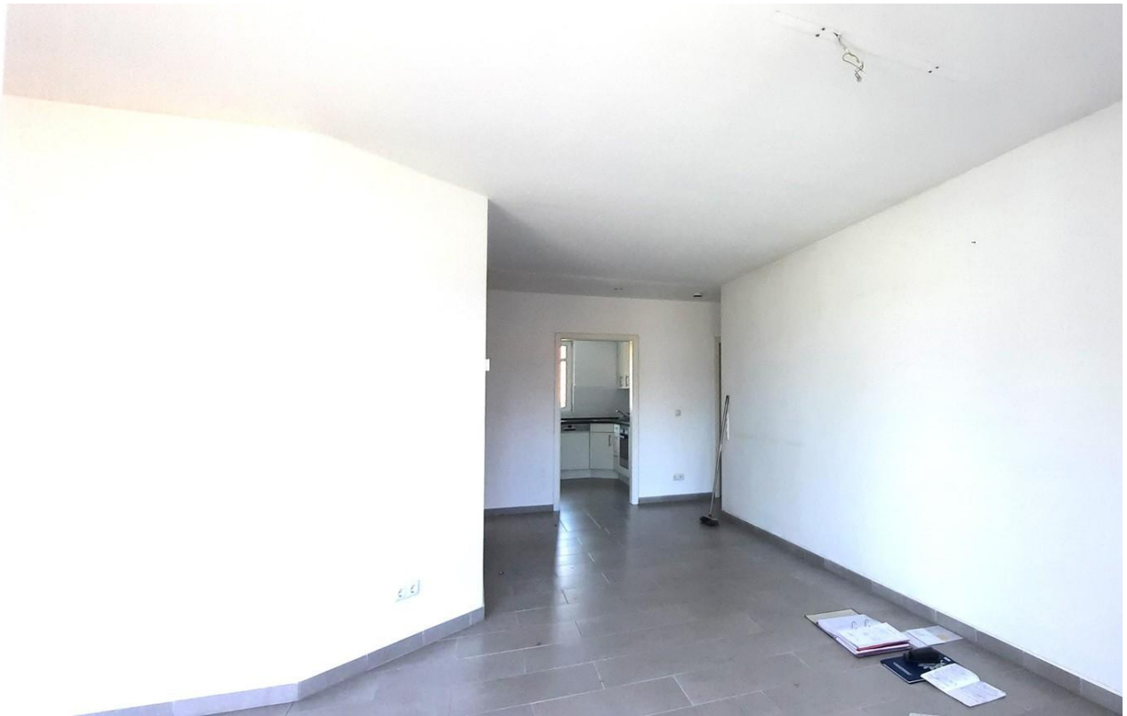
Flur Schlafzi. Abstellraum