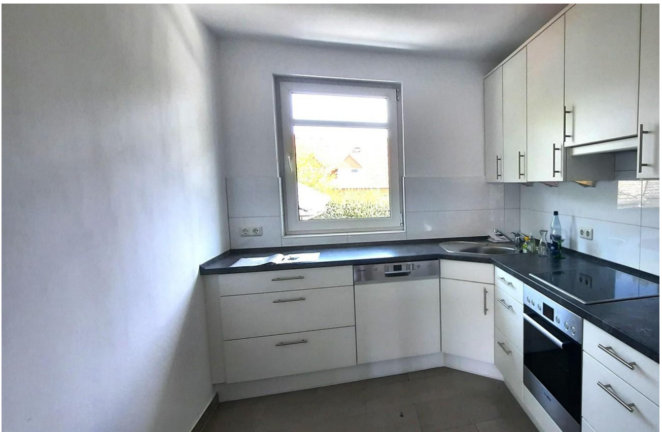
Küche Hochglanz Weiß