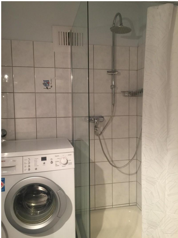
Glasdusche + Waschmaschine