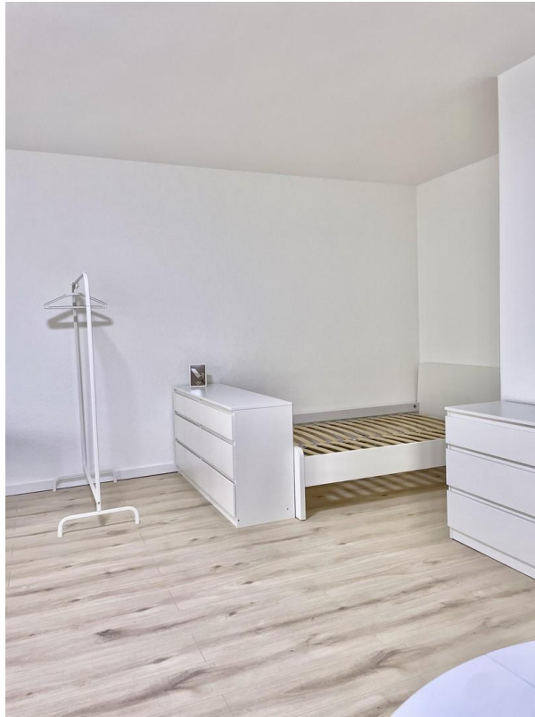
Wohn & Esszimmer