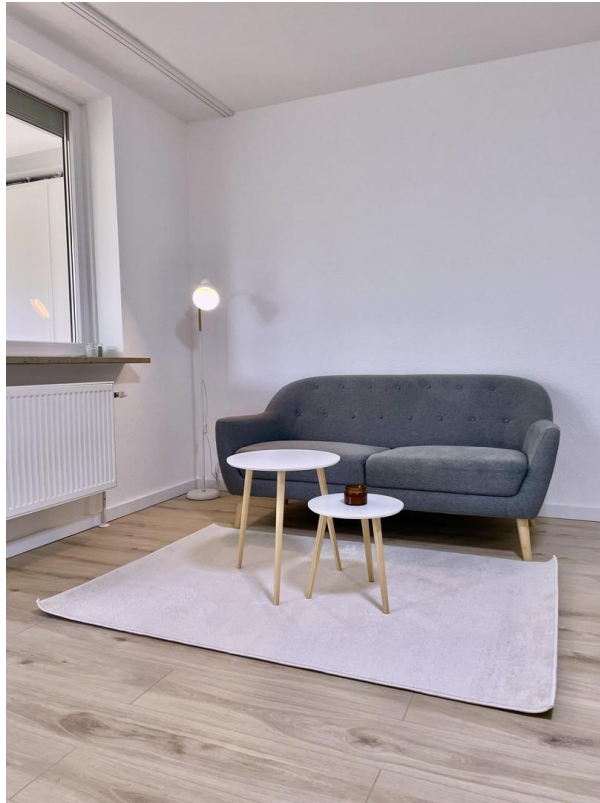
Wohn & Esszimmer