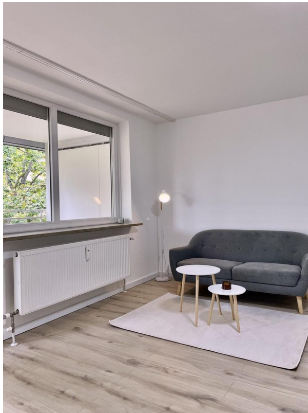
Wohn & Esszimmer