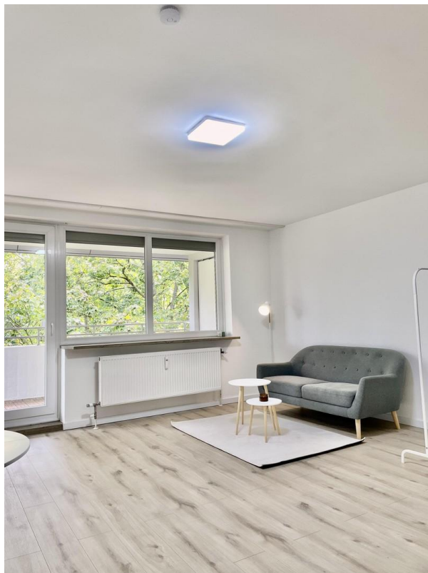
Wohn & Esszimmer