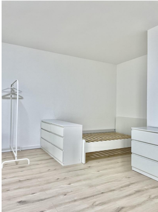
Wohn & Esszimmer