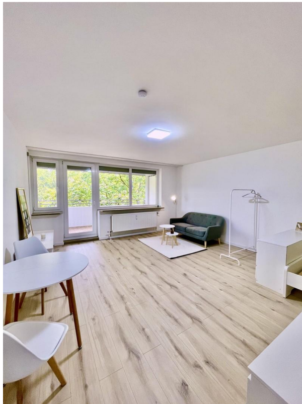
Wohn & Esszimmer