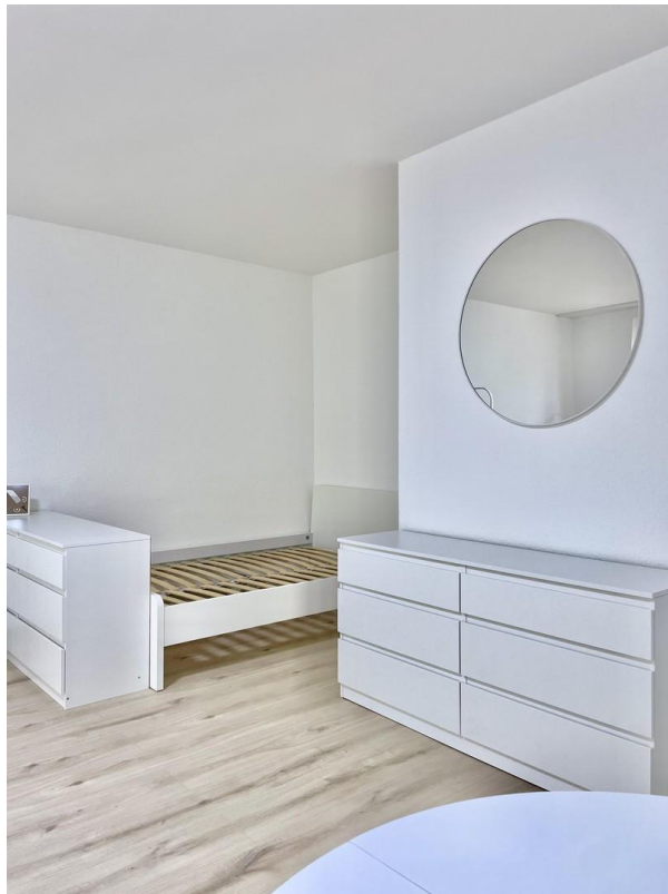
Wohn & Esszimmer