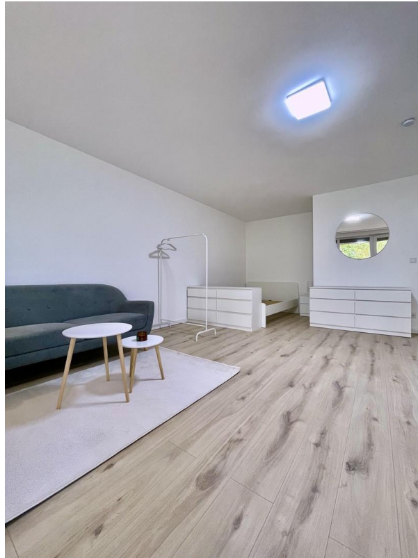
Wohn & Esszimmer