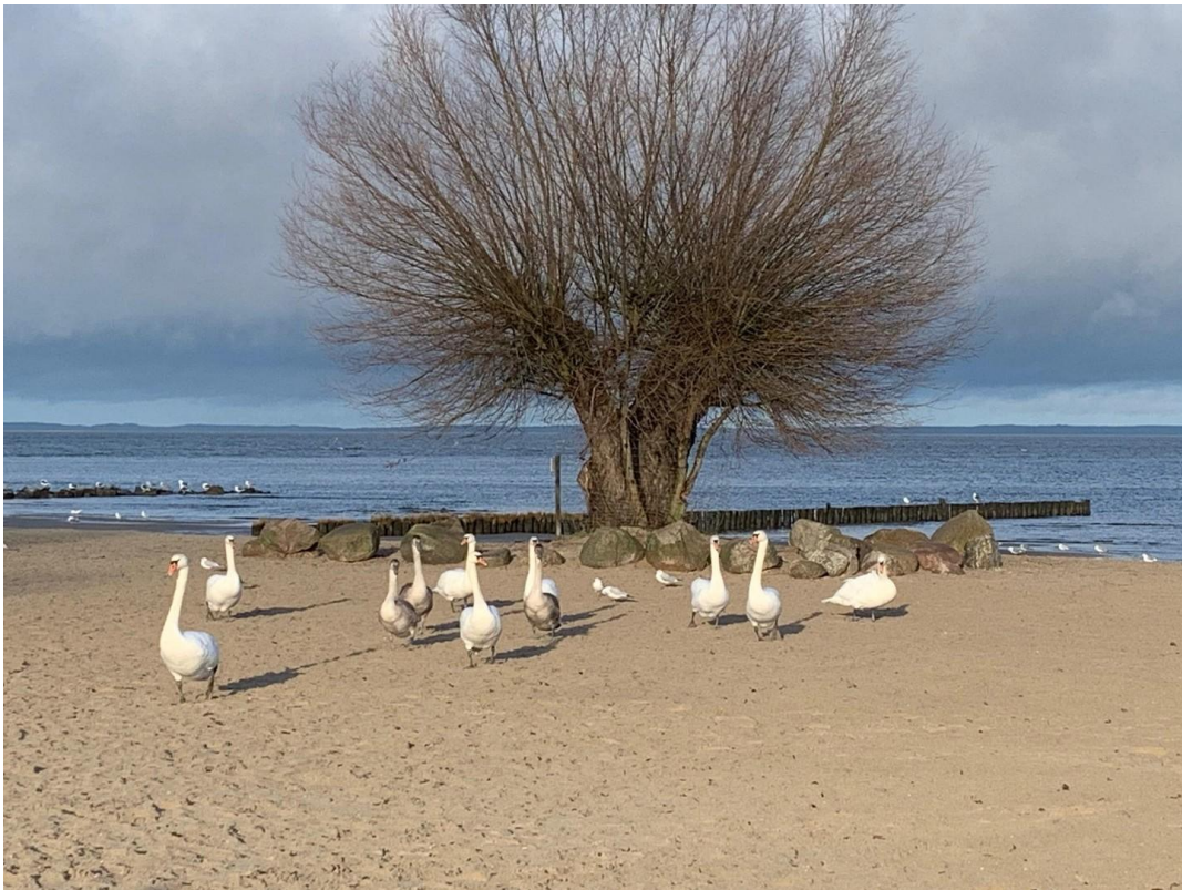
Strand von Ueckermünde