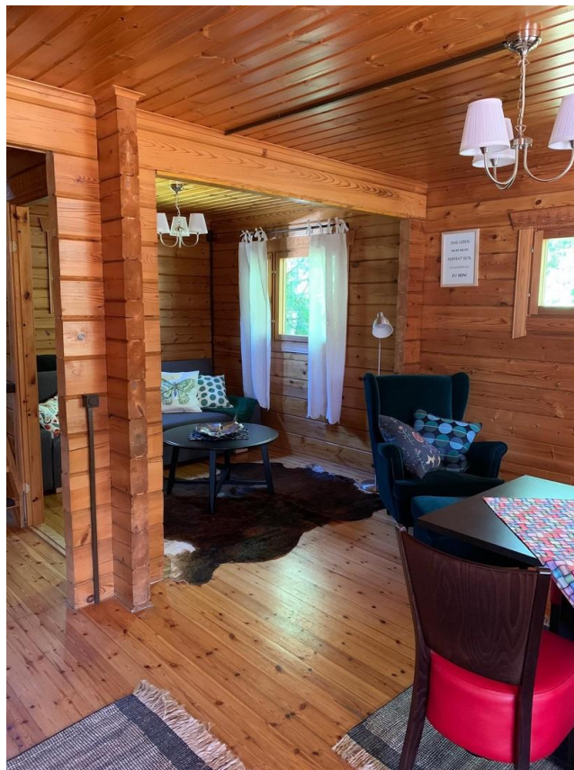
offener Wohnbereich unten