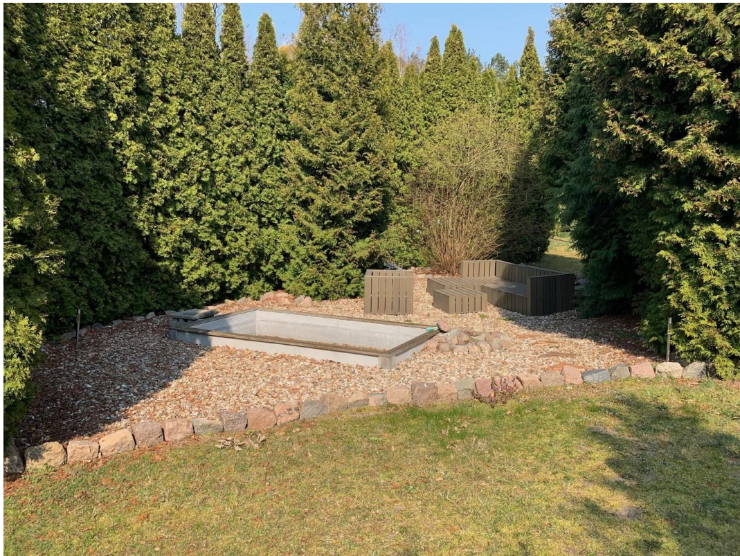
Hundepool mit Lounge