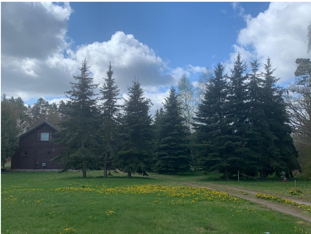
Auffahrt zur Ferienanlage