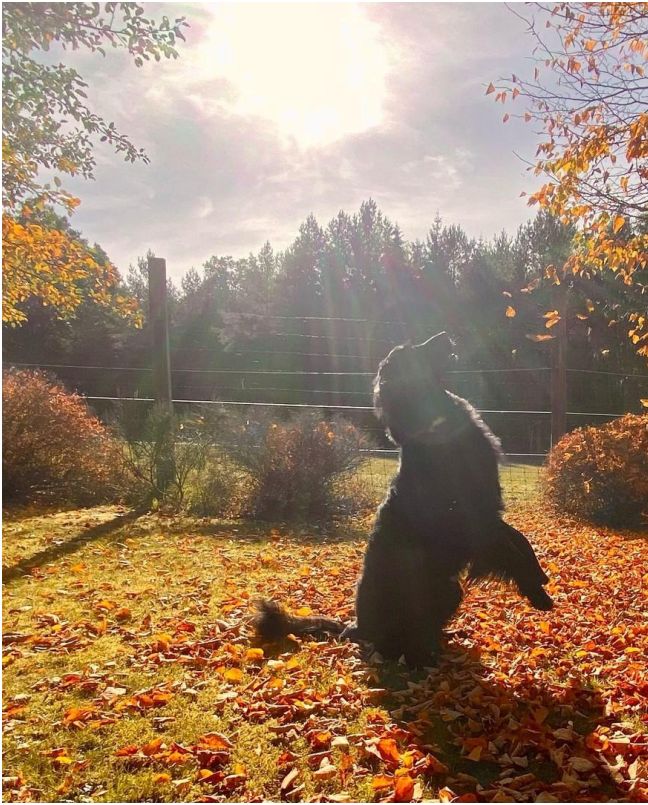
Garten Haus Elisabeth