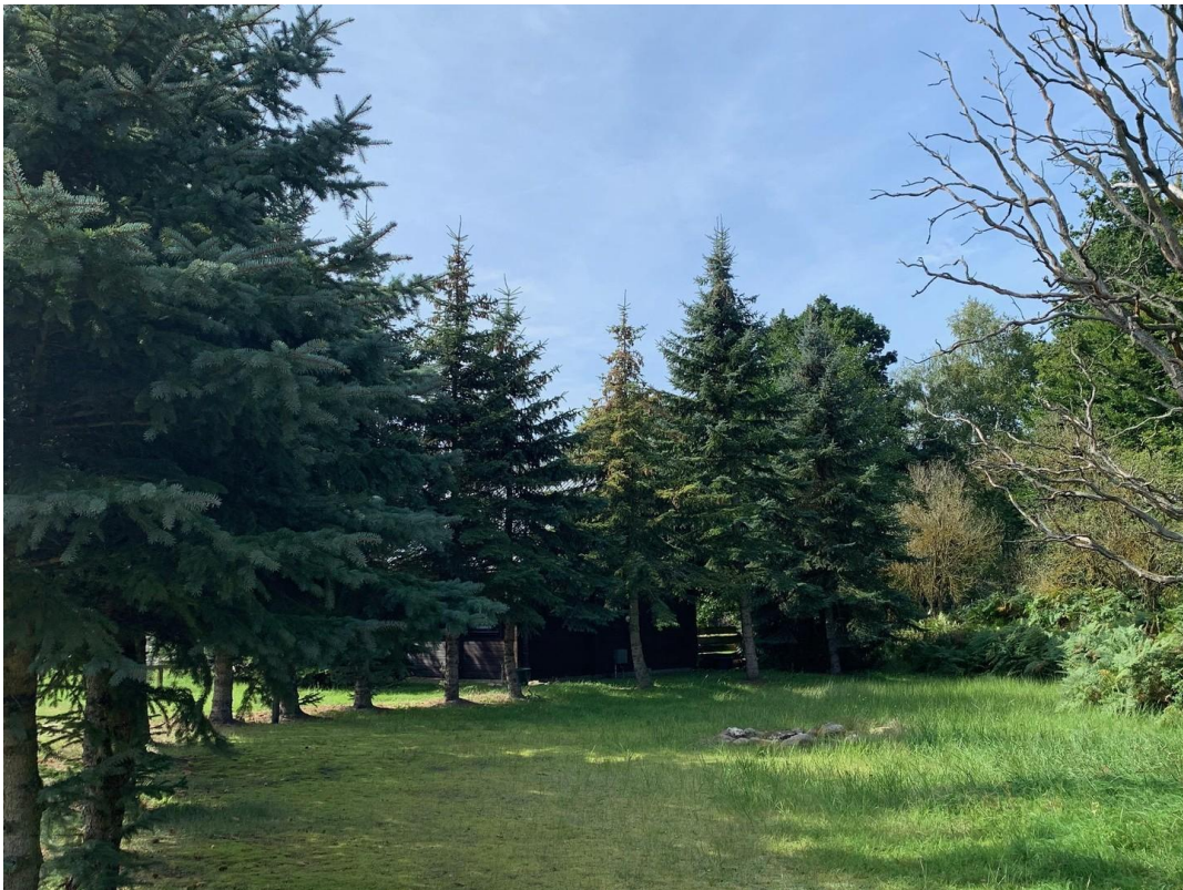
Blick zur Feuerstelle