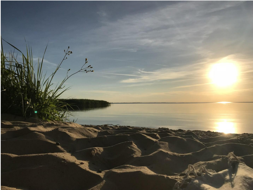
Strand am Haff