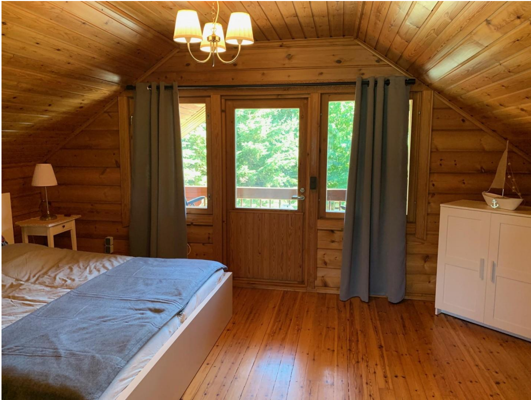
Schlafzimmer Richtung Balkon