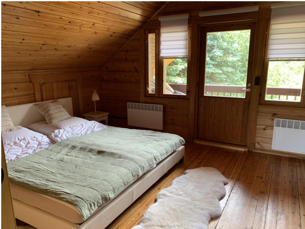
Schlafzimmer oben mit Balkon