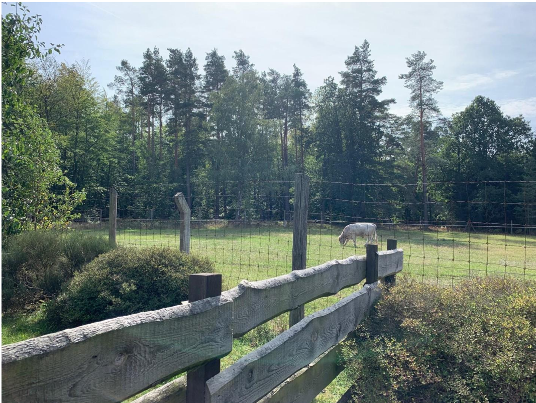
Blick zur Weide