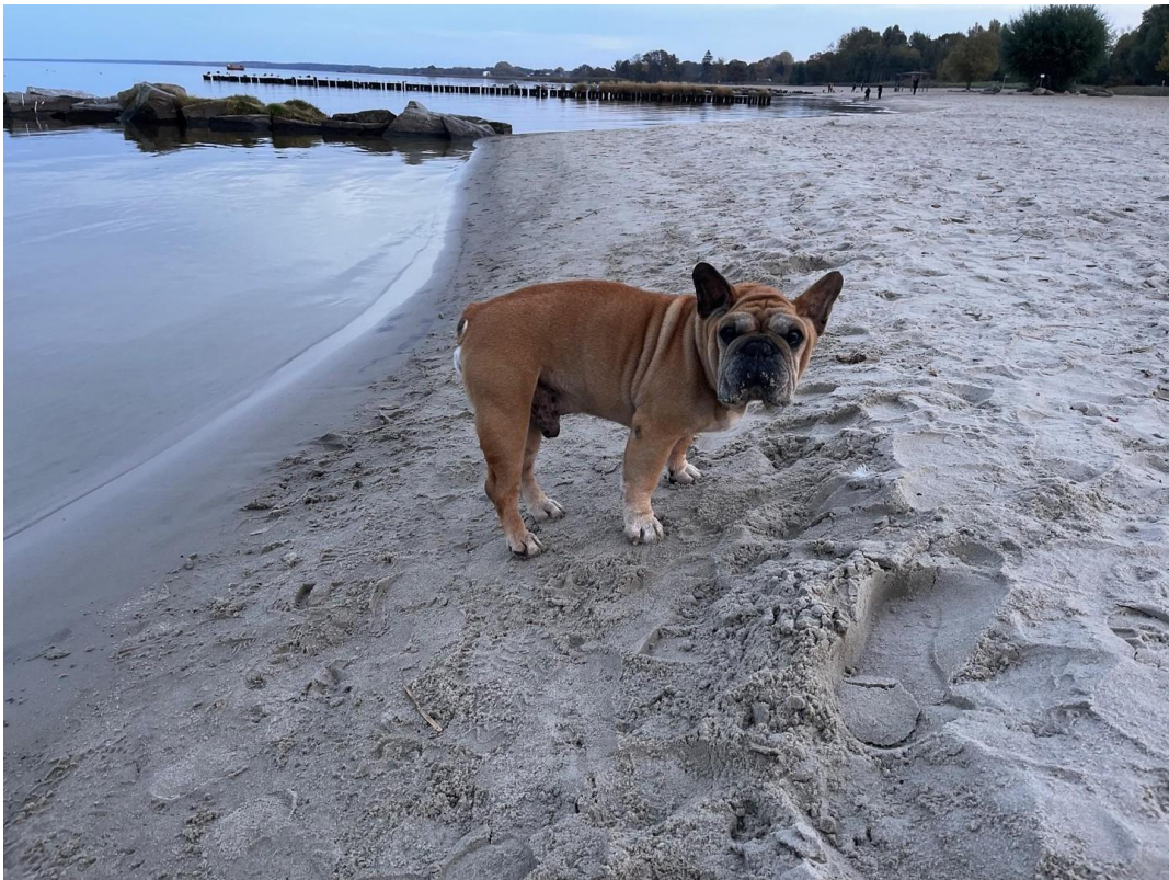
Strand von Ueckermünde