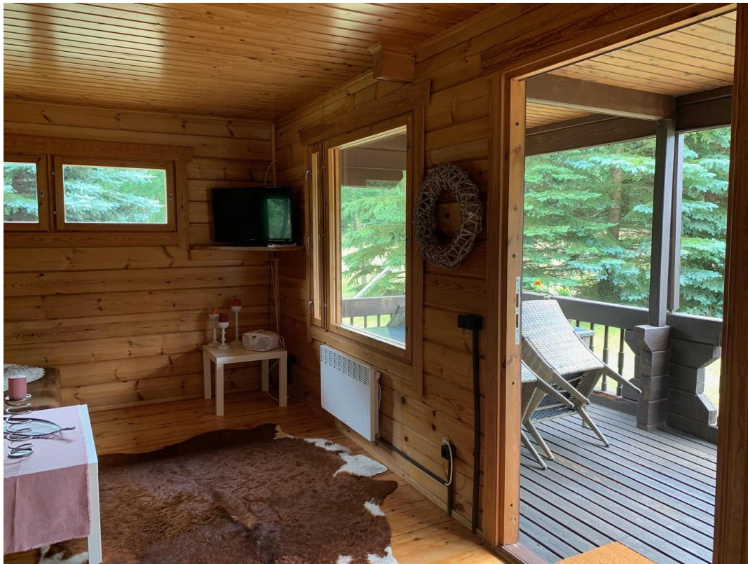
Blick auf die Terrasse unten