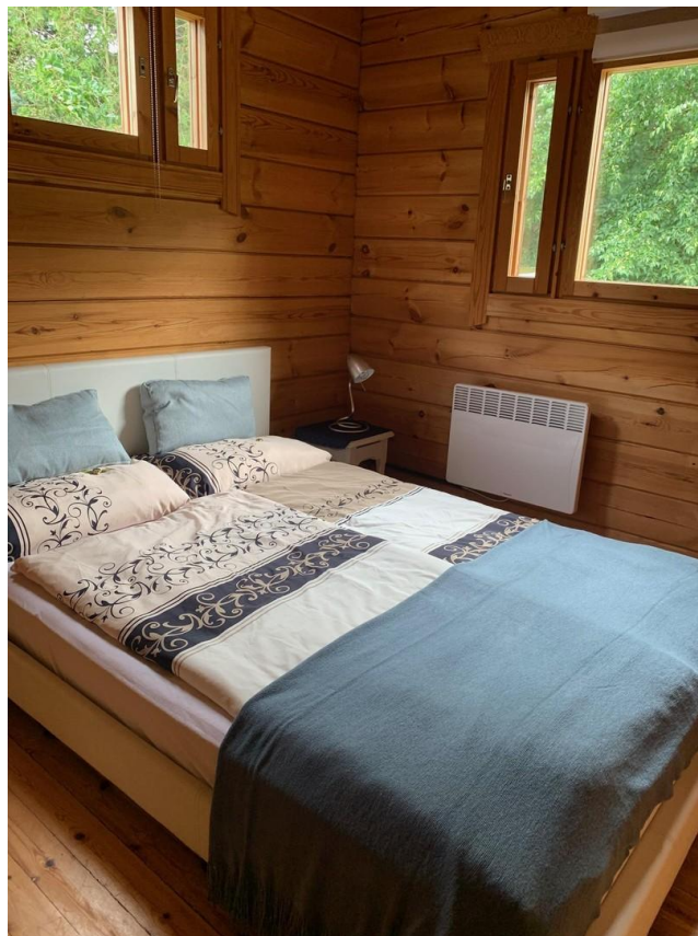
Kleines Schlafzimmer unten