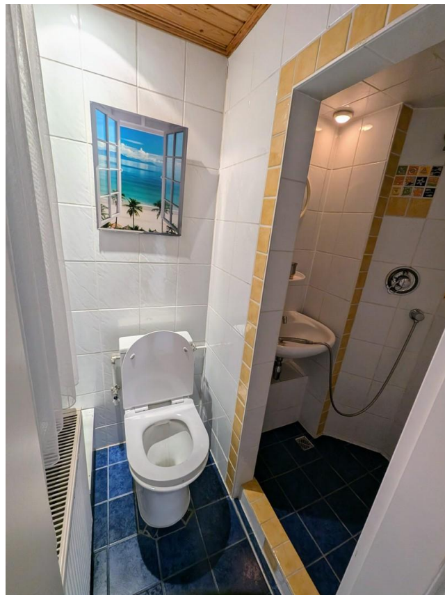
Ehm. Garage 2, Zimmer mit WC