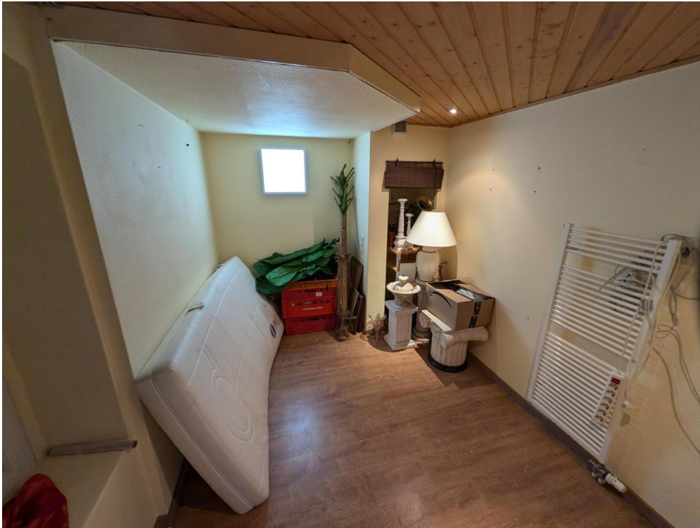
Ehm. Garage 2, Zimmer