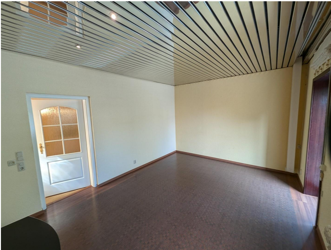
Zimmer oben, Zugang zur DT