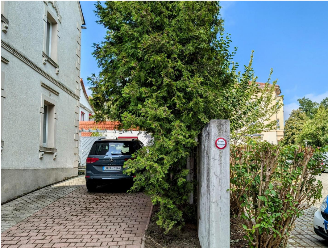
Zugang zum Grundstück