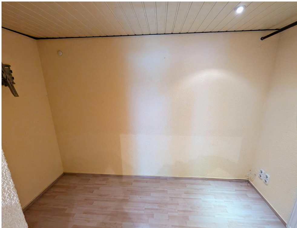
Zimmer am Durchgangszimmer