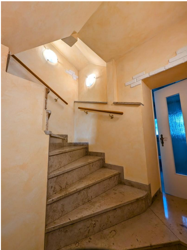
Treppenhaus, Zugang WC