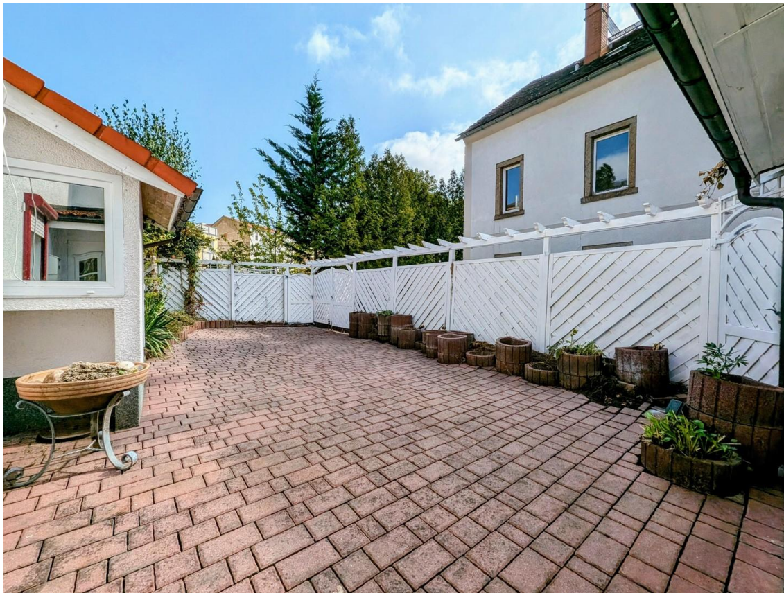
Der Hof mit Blick auf das Tor