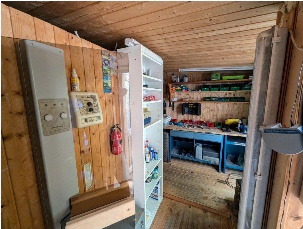
Werkstatt, Sauna, Whirlpool