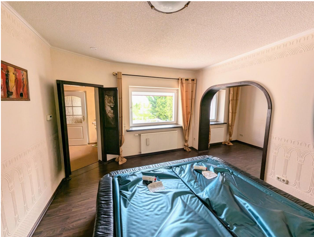
Blick auf Hof