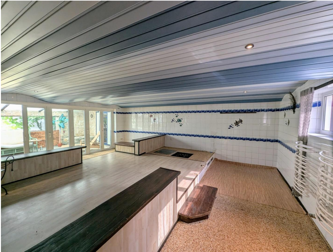
Halle mit überdachten Pool