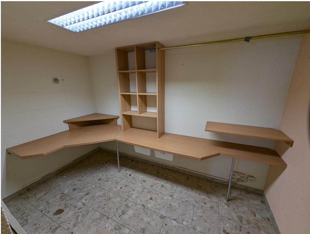
Ehm. Garage, Büro