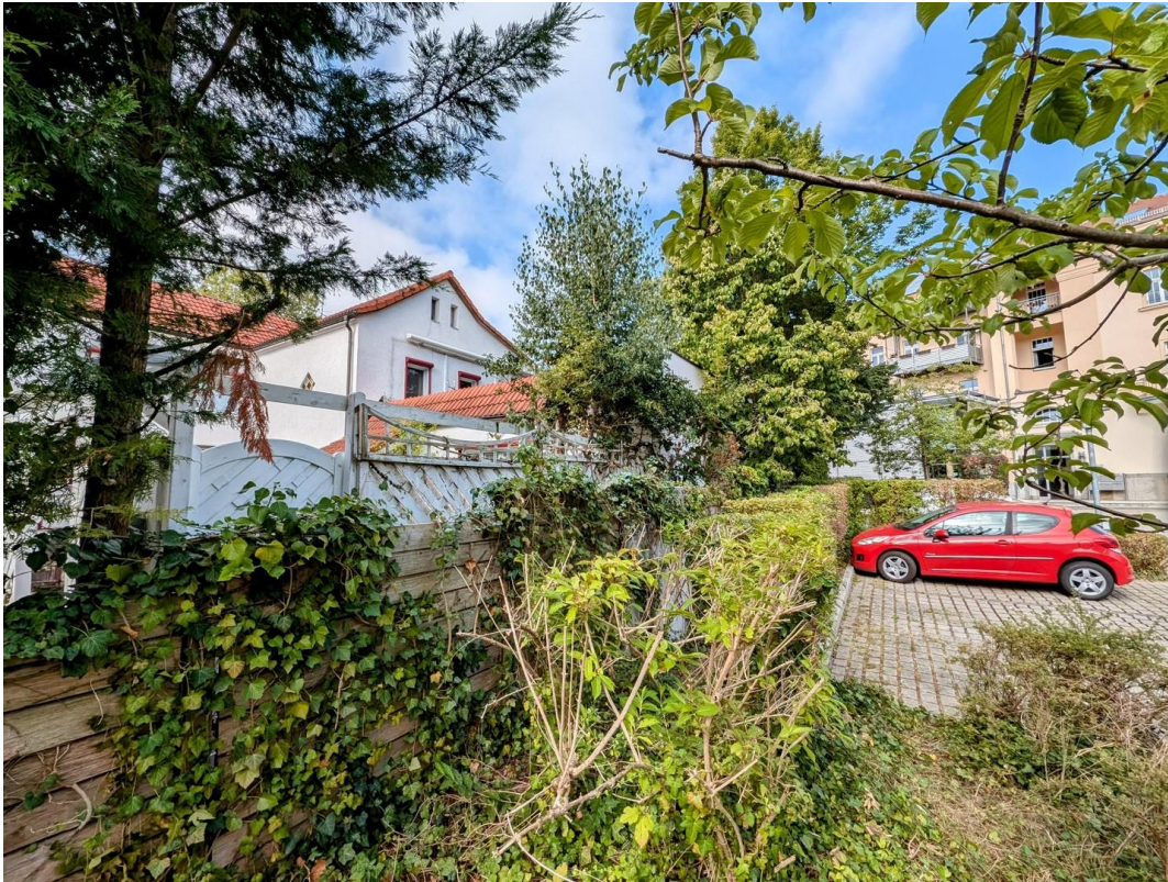
Blick von Volksbank PP