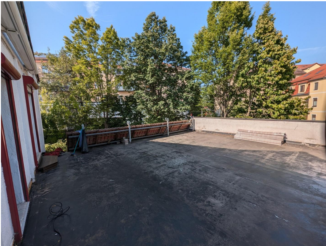
Dachterrasse, Blick aus WZ