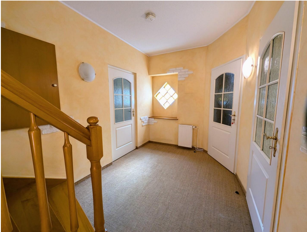
Flur ober Etage