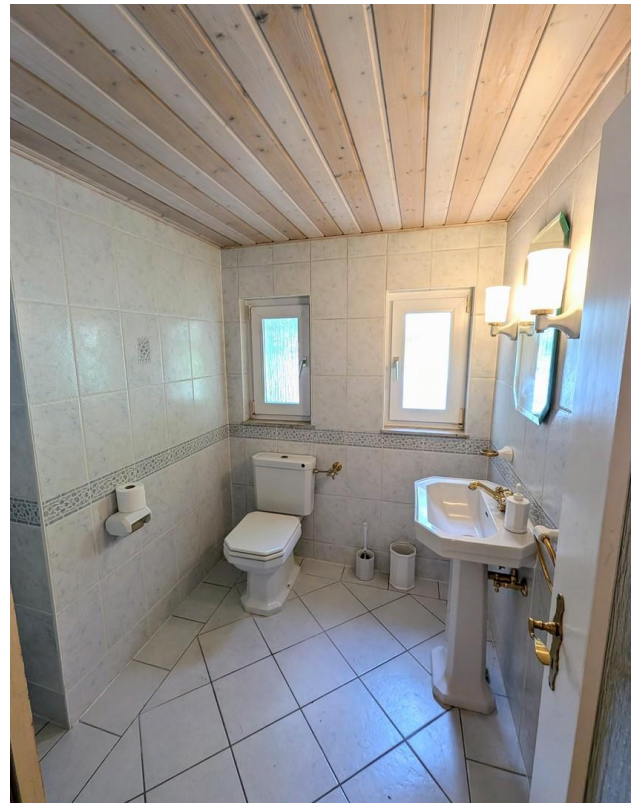
WC und Zugang Heizungsraum