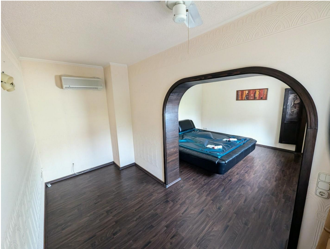
Zimmer oben, Blick auf Hof