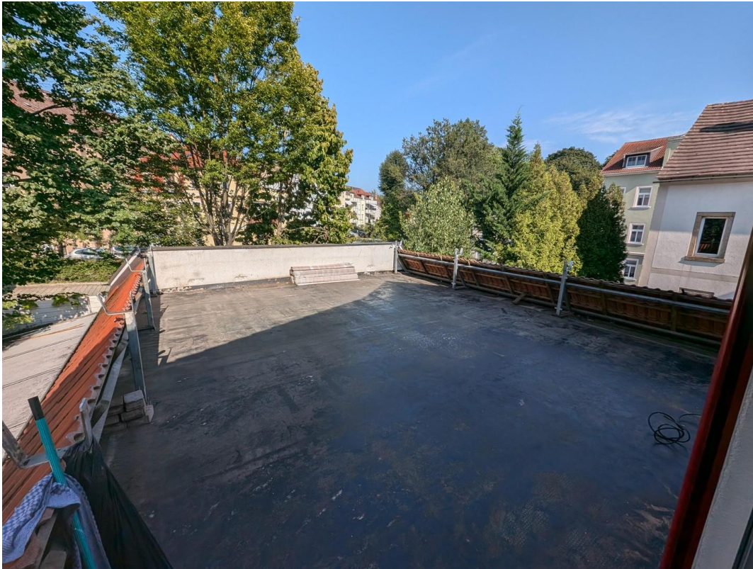
Dachterasse, Blick aus Küche