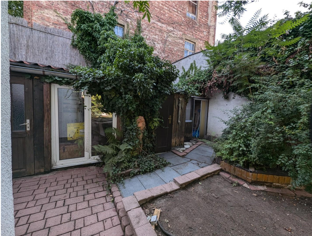
Werkstatt, Sauna, Gerätehaus