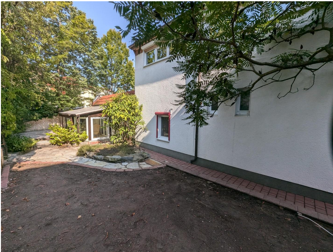
Blick auf den Garten