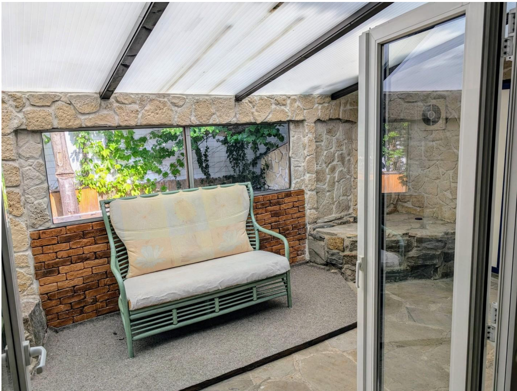
Wintergarten an Halle