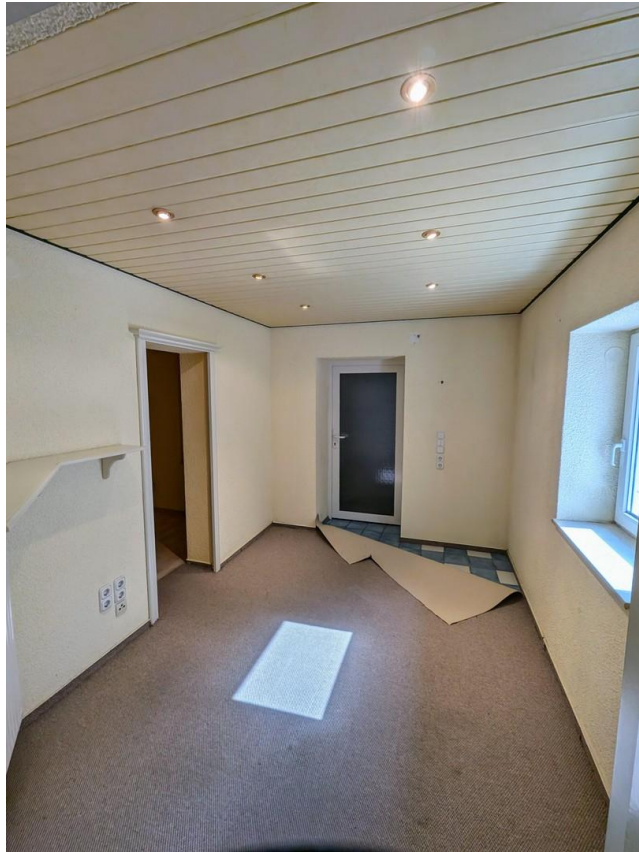
Durchgangszimmer zur "Halle"