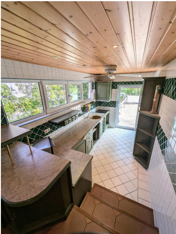
Küche mit Zugang zur Terasse