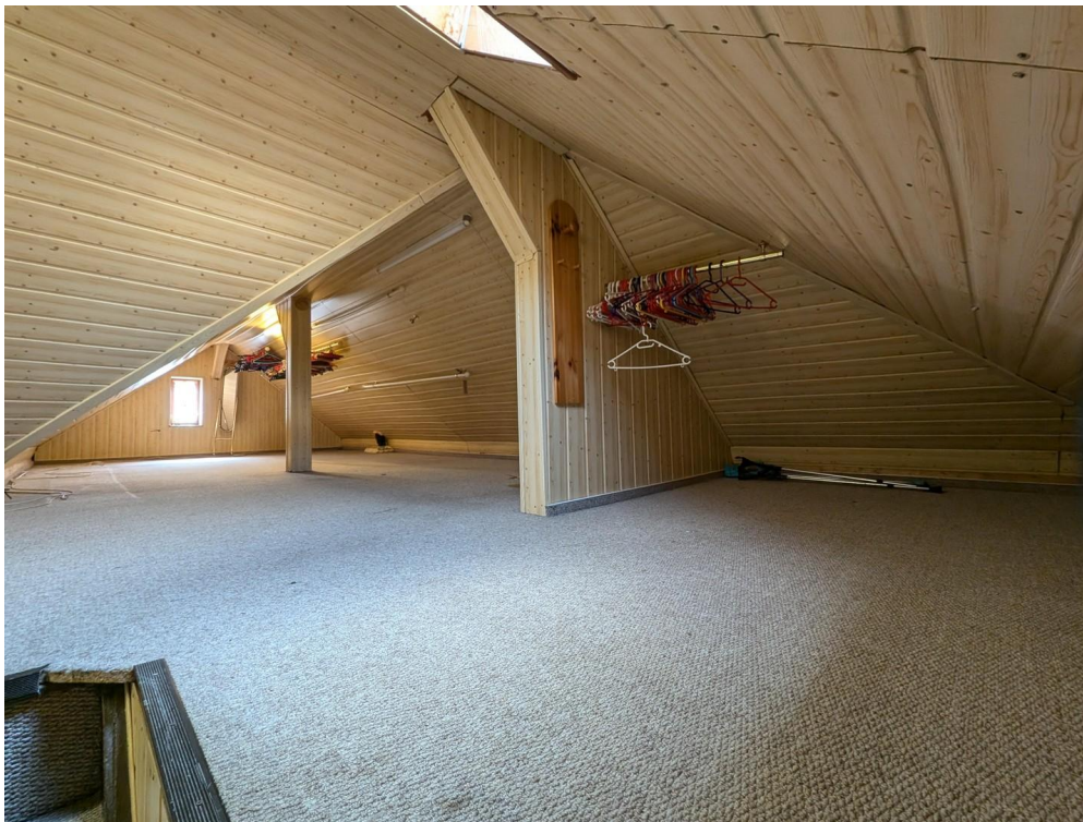
Teil des Dachbodens