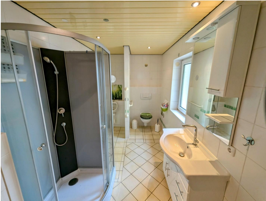
Badezimmer in Halle