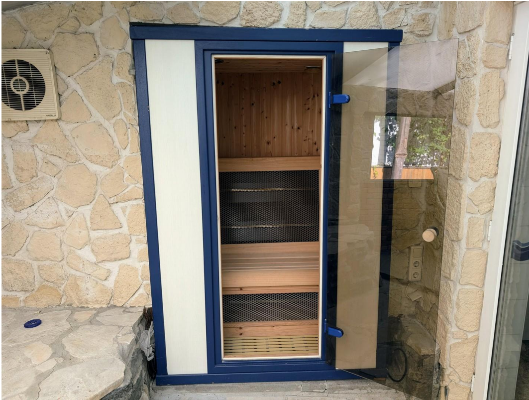
Wintergarten mit Infrarotsauna