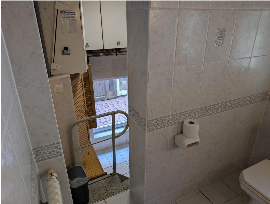
Heizungsraum und Zugang Garten