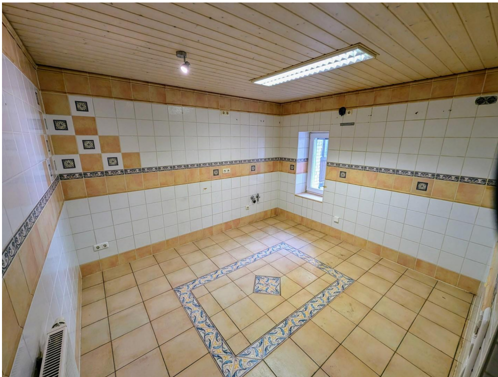
Zimmer unten, Fenster Garten