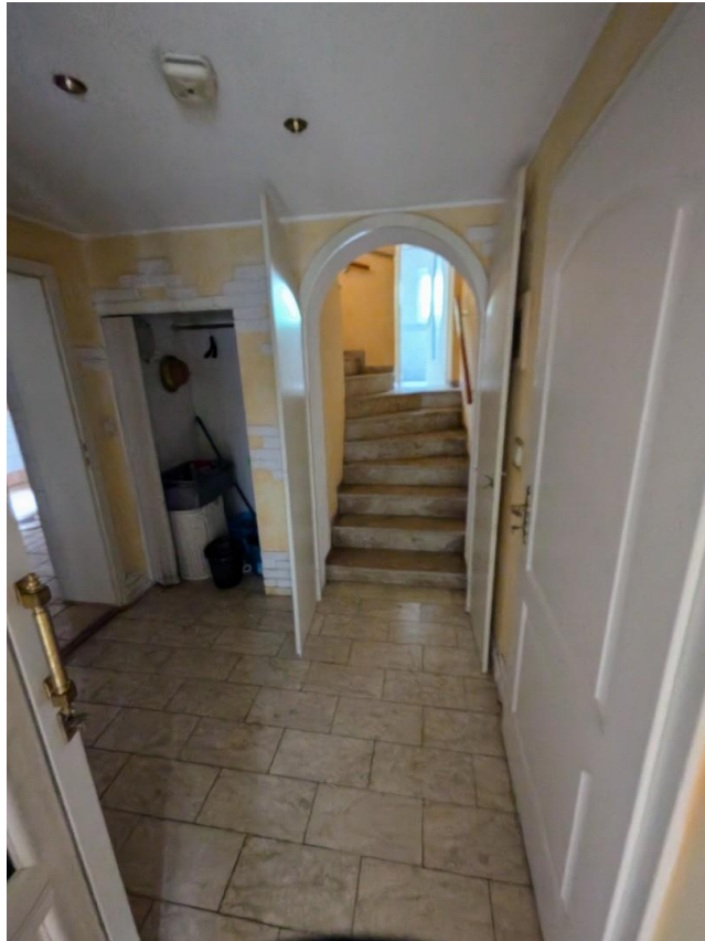
Flur unten, rechts Durchgangsr