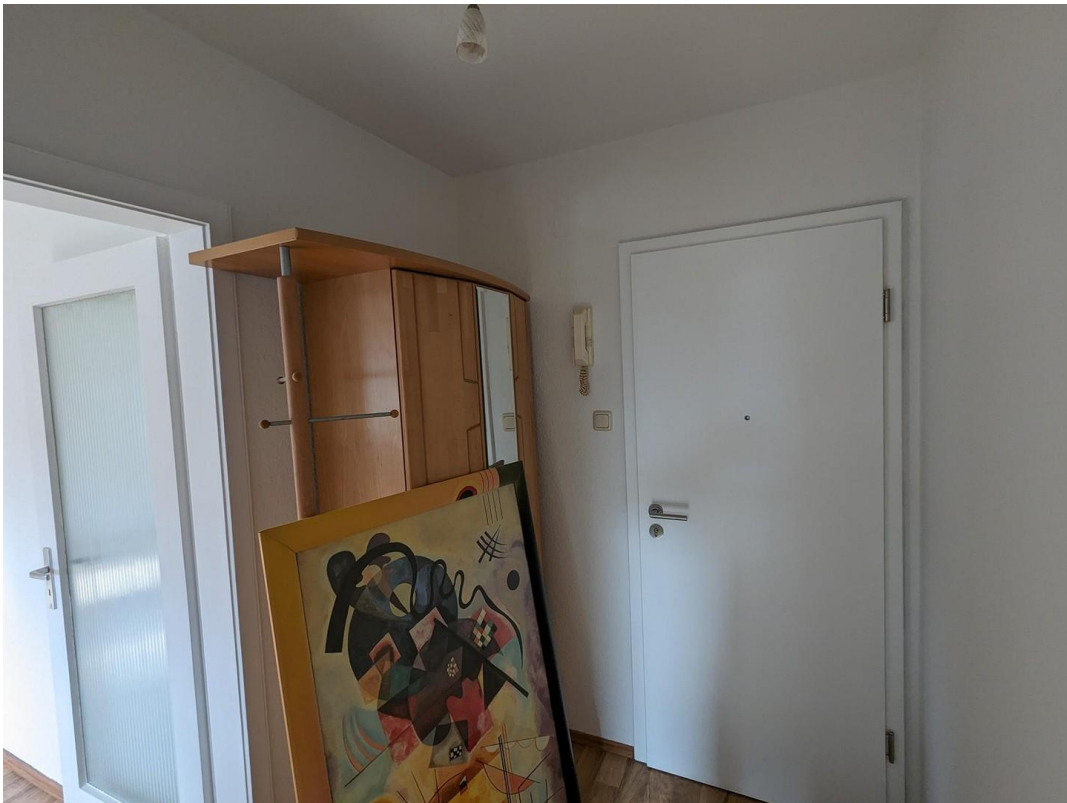
Flur / Haustüre