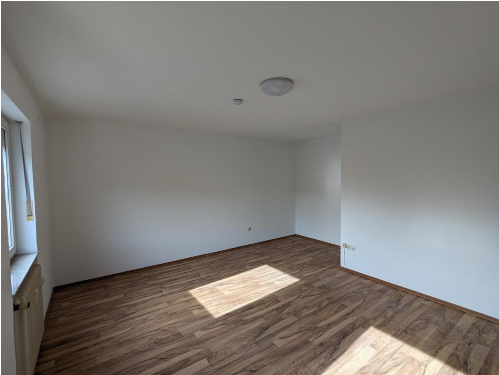
Blick von der Einbauküche