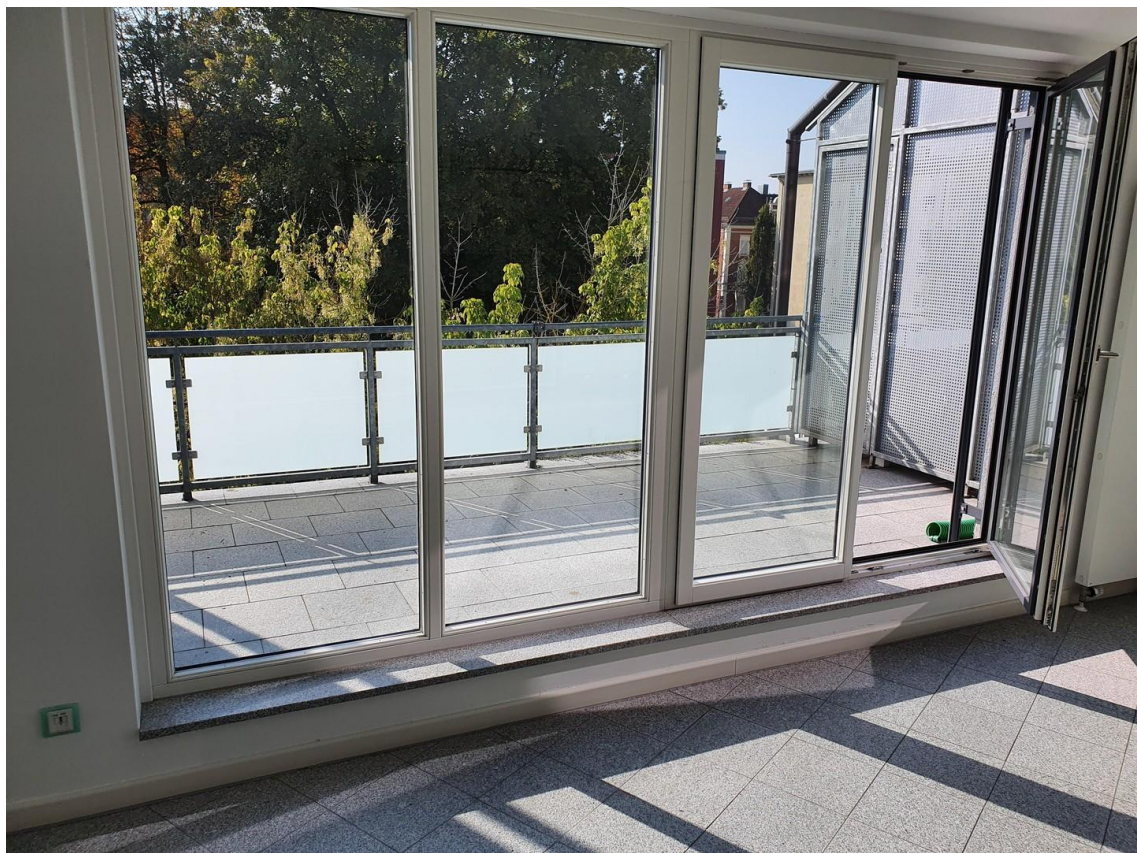
Blick auf die Dachterrasse