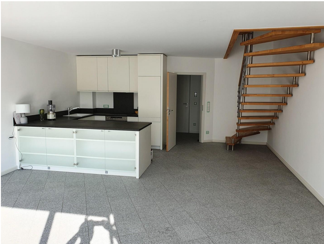
Wohnzimmer Blick Küche