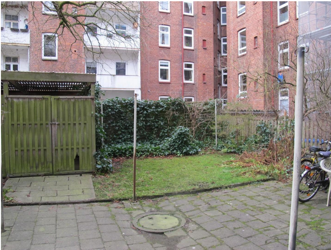
Garten mit Fahrradschuppen