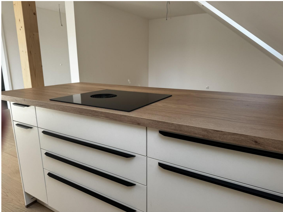
Kochinsel inkl. Borafeld