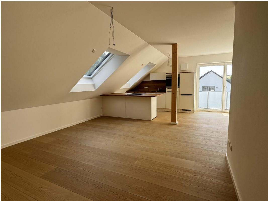
Wohnbereich zur Küche