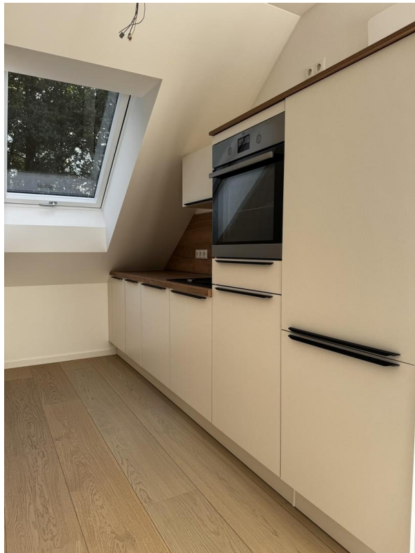
Küche inkl. Markengeräte