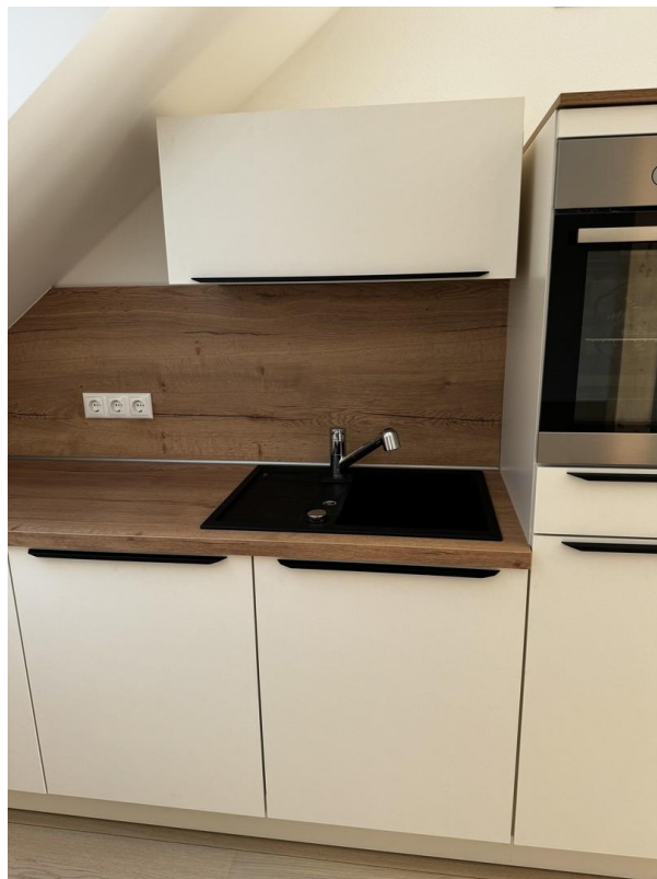
Küche inkl. Markengeräte