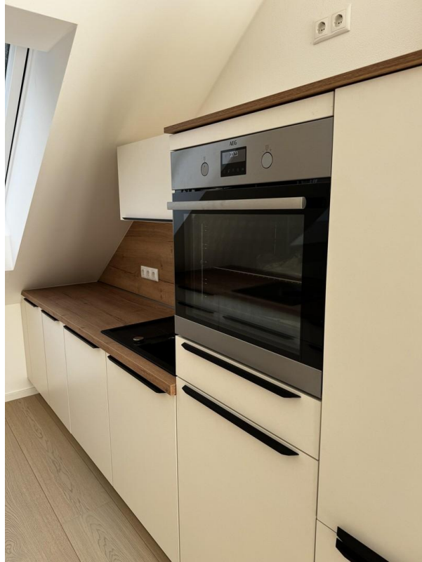
Küche inkl. Markengeräte