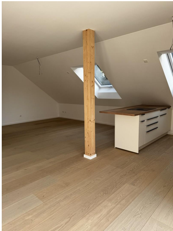
Offene Küche zu Wohnbereich