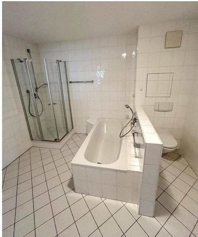
Badezimmer - Teilansicht 2