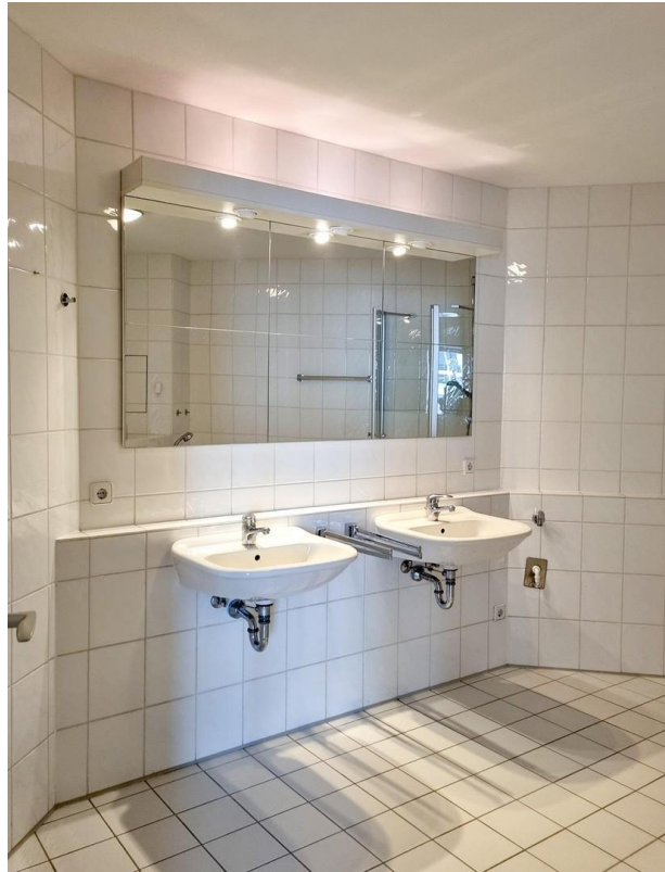
Badezimmer - Teilansicht 1