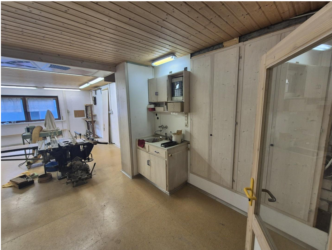
Werkstatt OG ggf Büro mit Teek