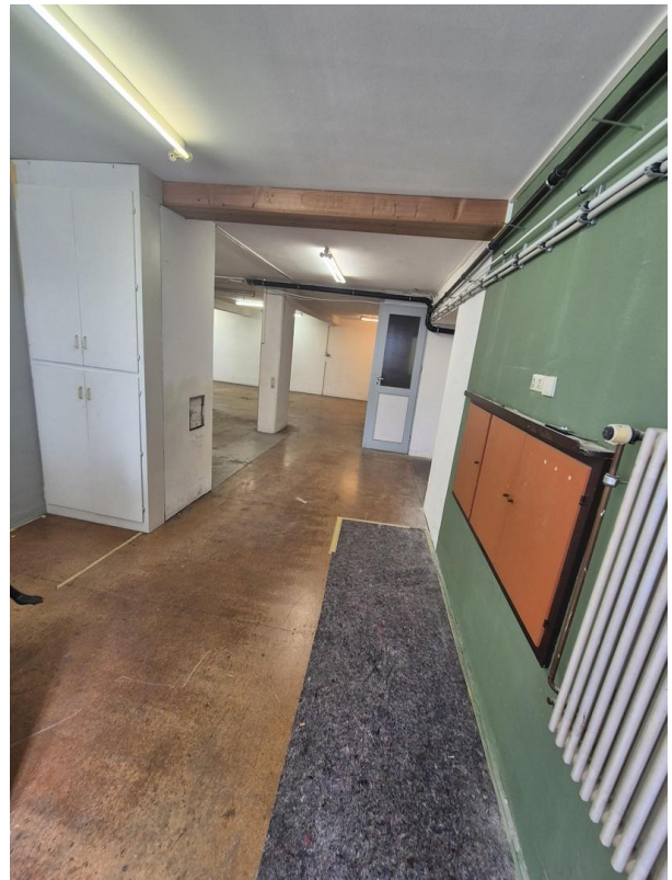
Lager Werkstatt EG