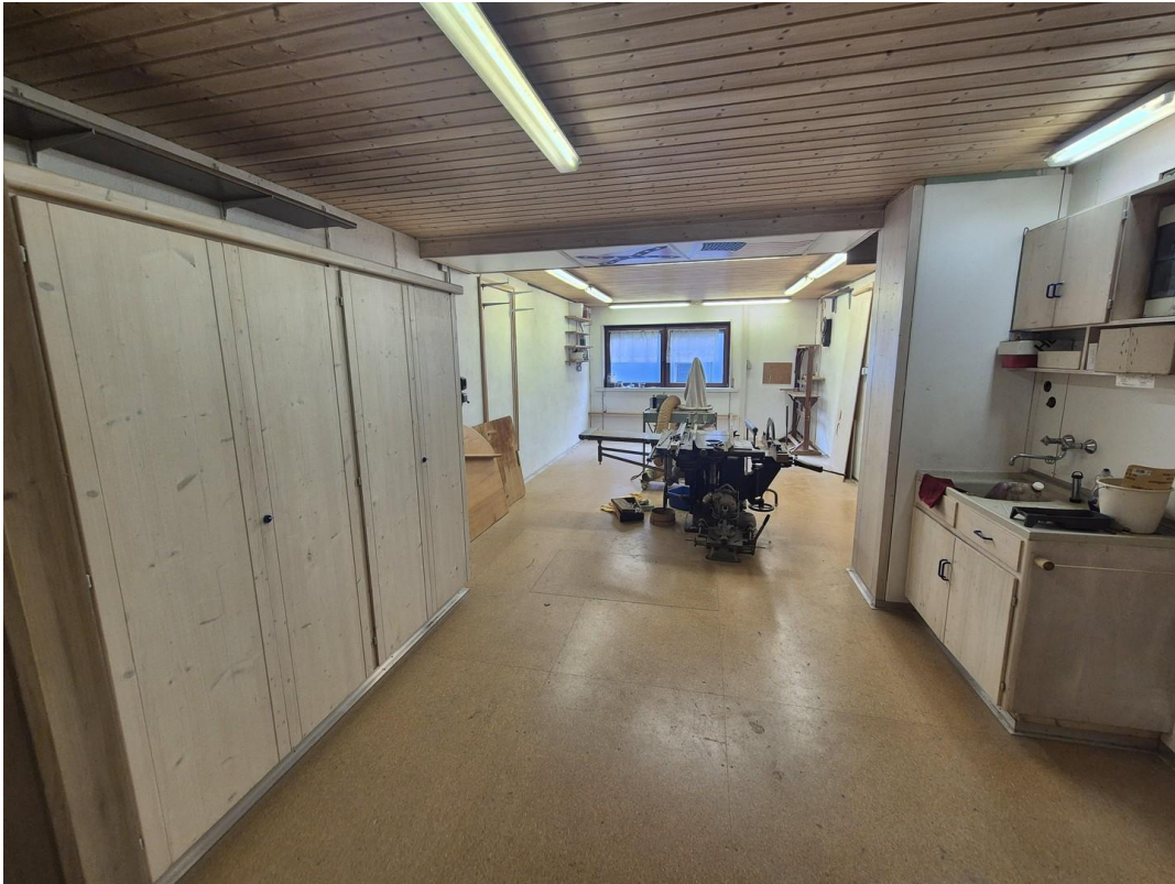
Werkstatt OG ggf Büro mit Teek