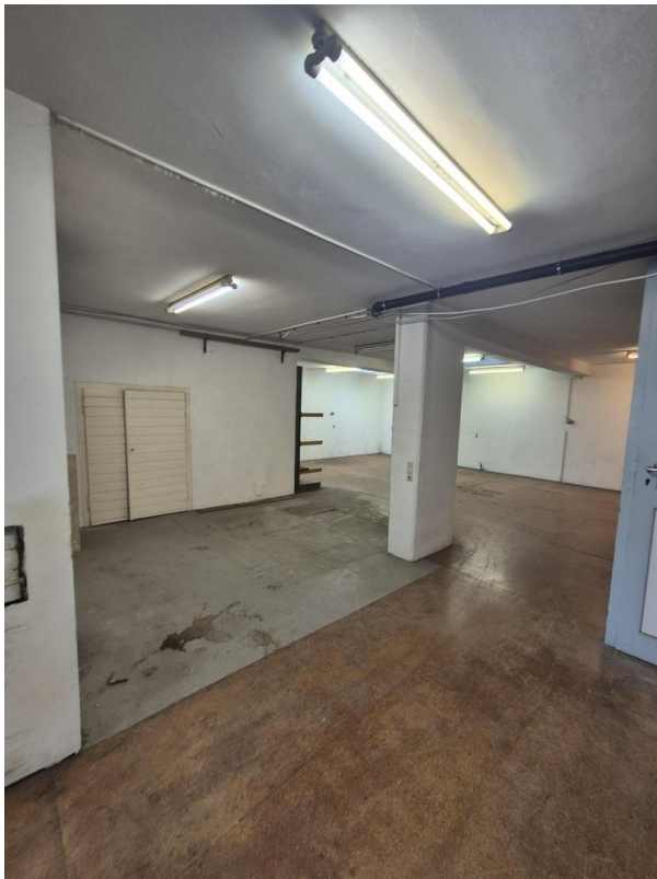
Lager Werkstatt EG