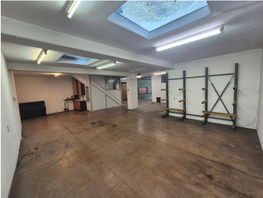
Lager Werkstatt EG