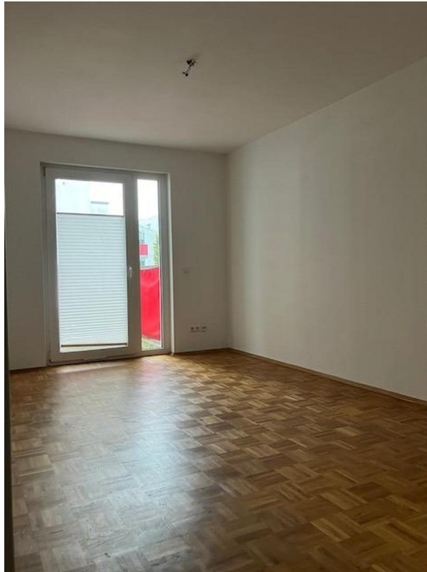
Kinderzimmer, Büro ?