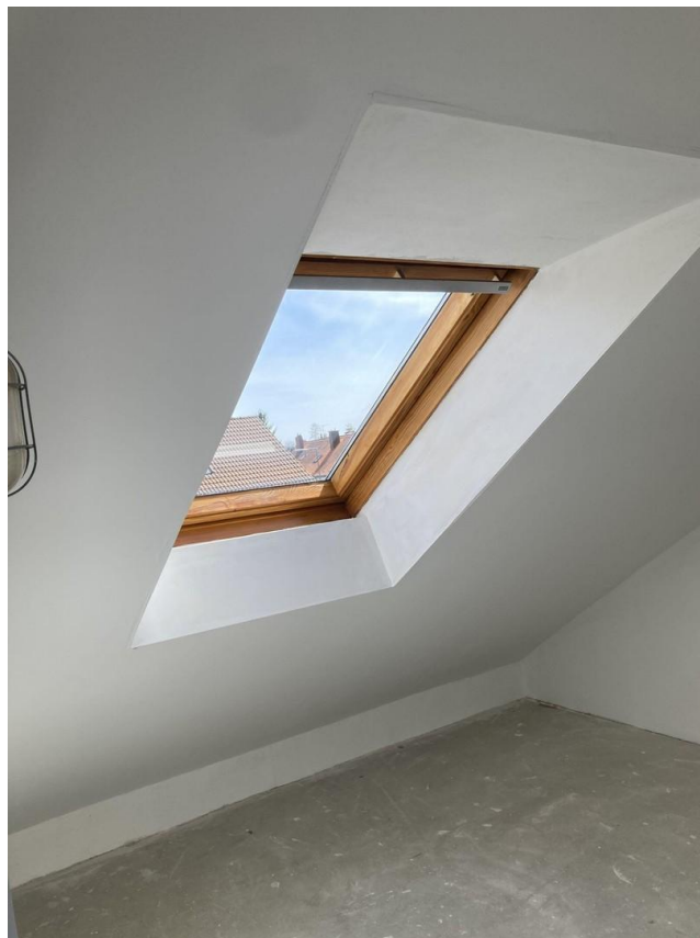
Abstellraum zweites OG