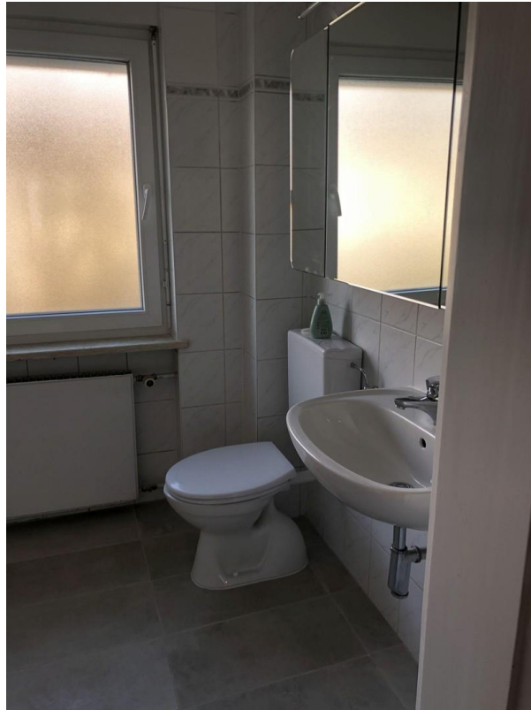
Bad WC erstes OG