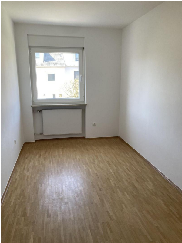
Raum 2 erstes OG