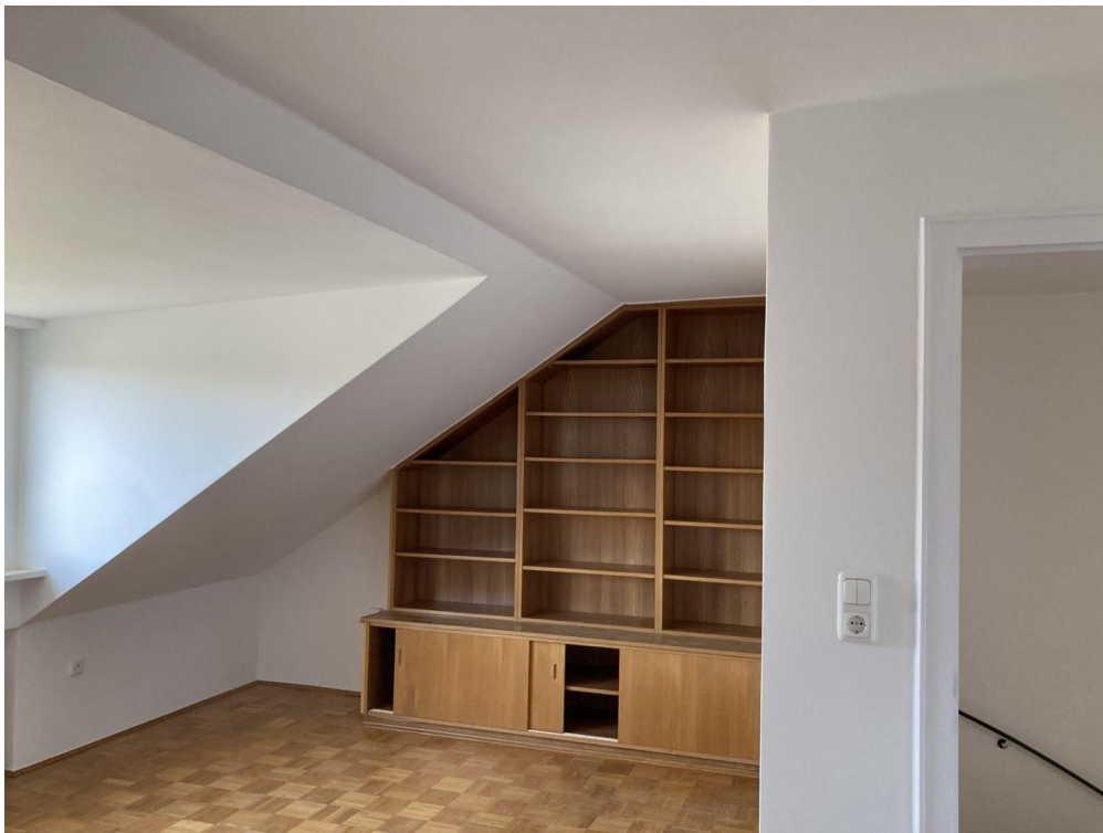
Dachzimmer zweites OG