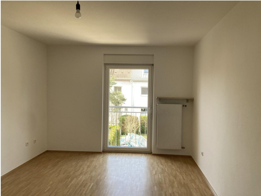
Raum 1 erstes OG