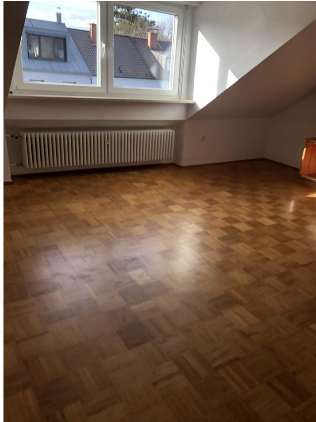
Dachzimmer zweites OG