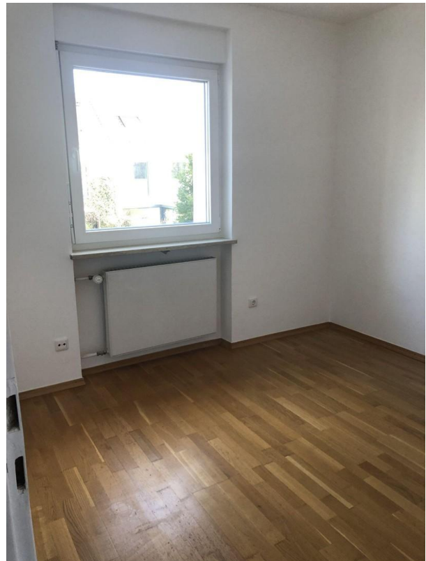
Raum 3 erstes OG