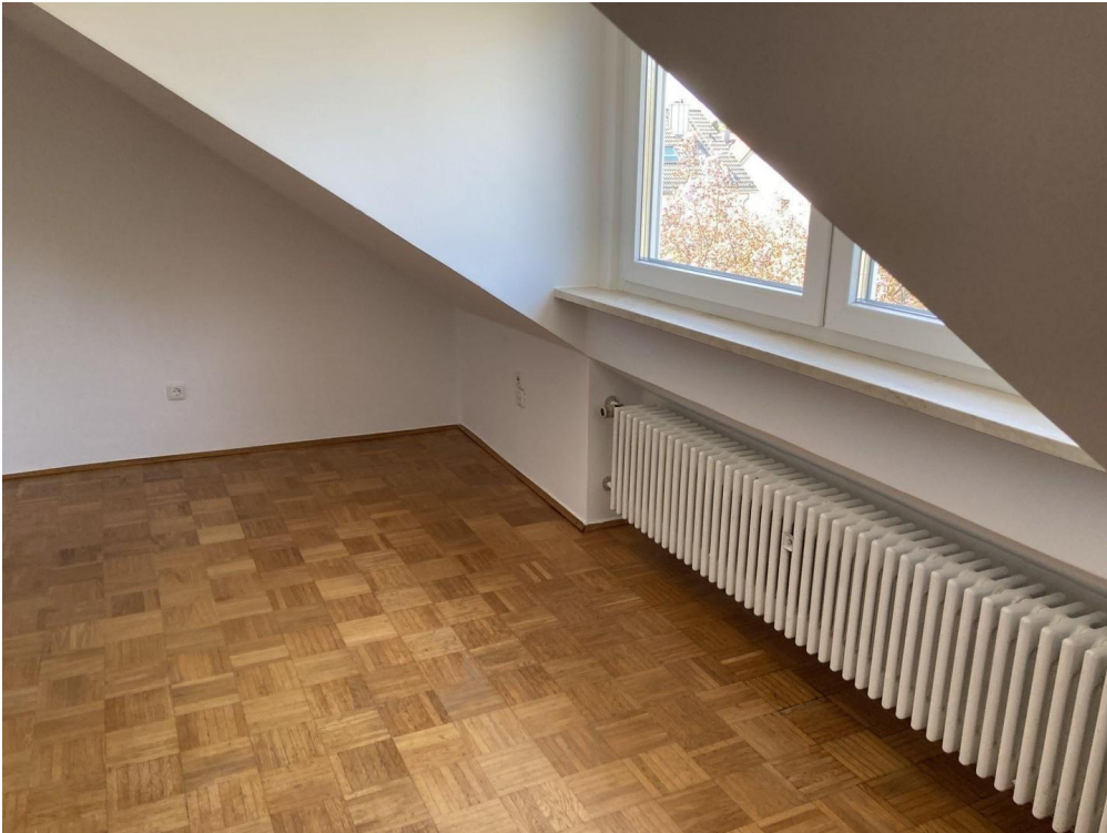
Dachzimmer zweites OG