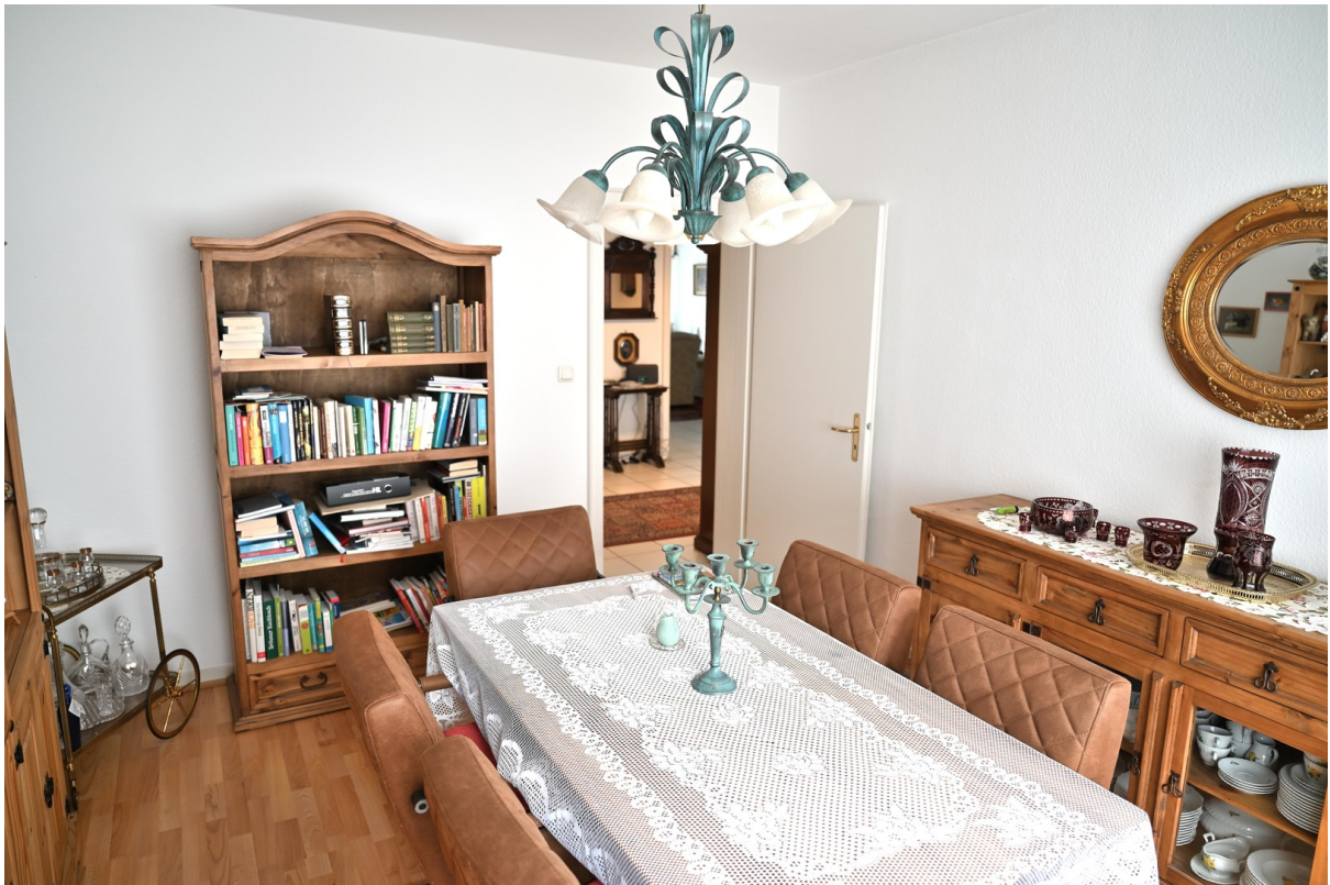
Esszimmer / Schlafzimmer 2