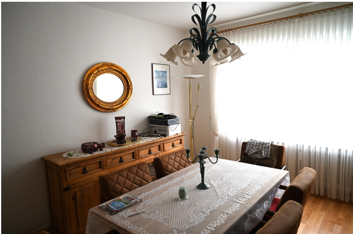
Esszimmer / Schlafzimmer 2