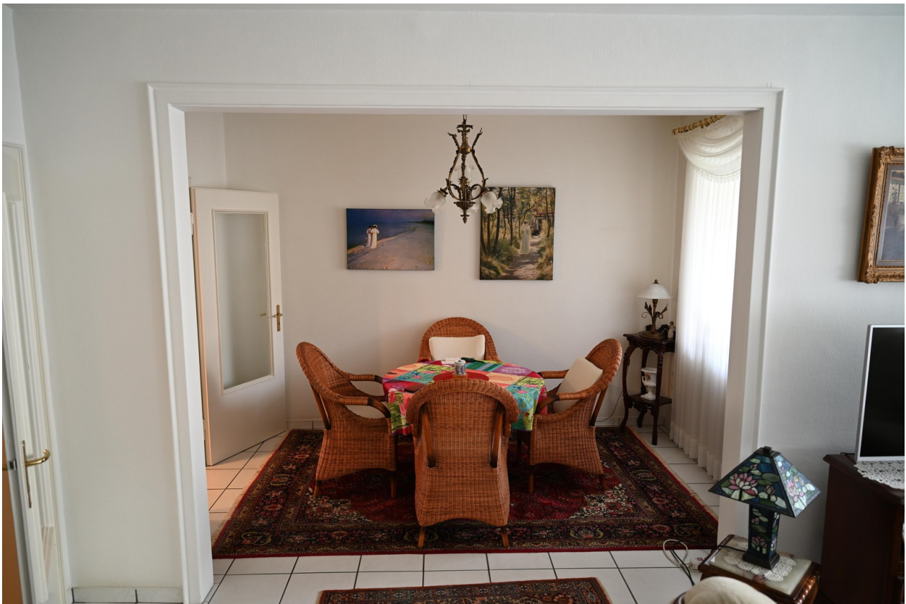
Blick vom WZ zur Essecke