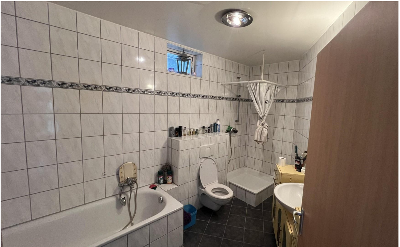
Badezimmer mit Wanne & Dusche