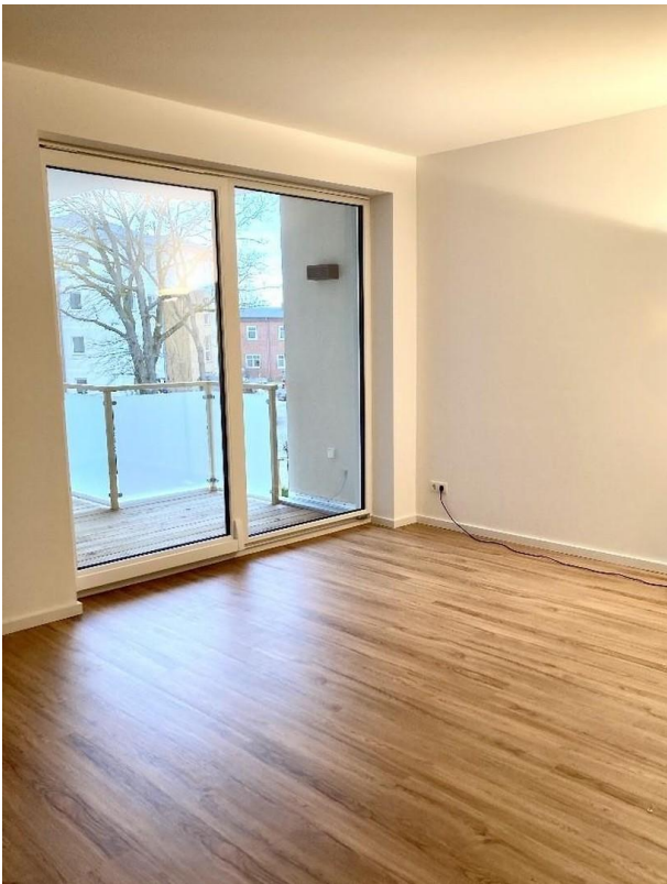
Wohnzimmer mit Balkonzugang