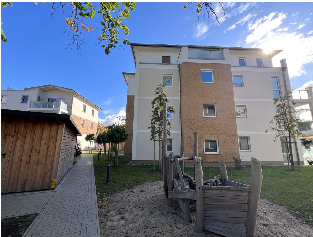
Spielschiffchen auf Grundstück