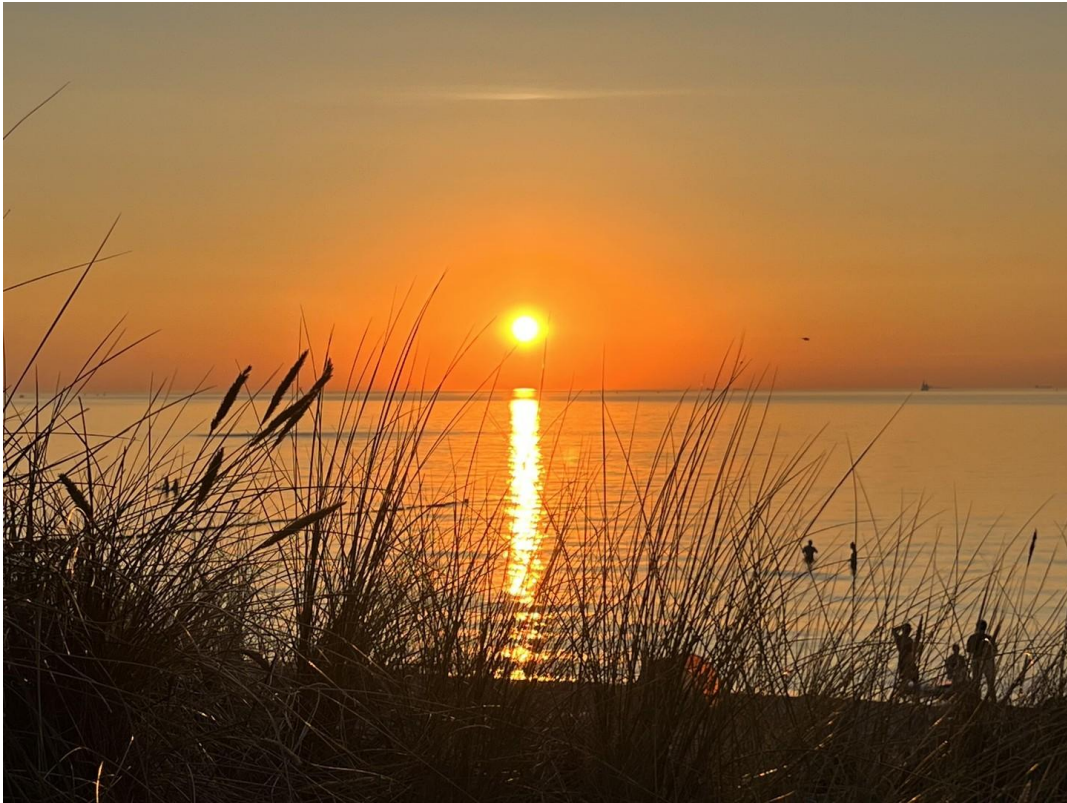
Strand von Markgrafenheide