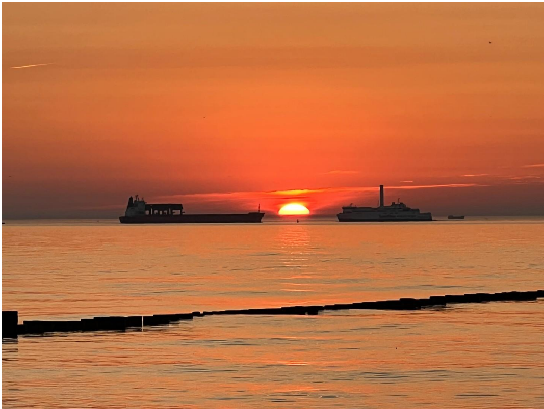
Strand von Markgrafenheide