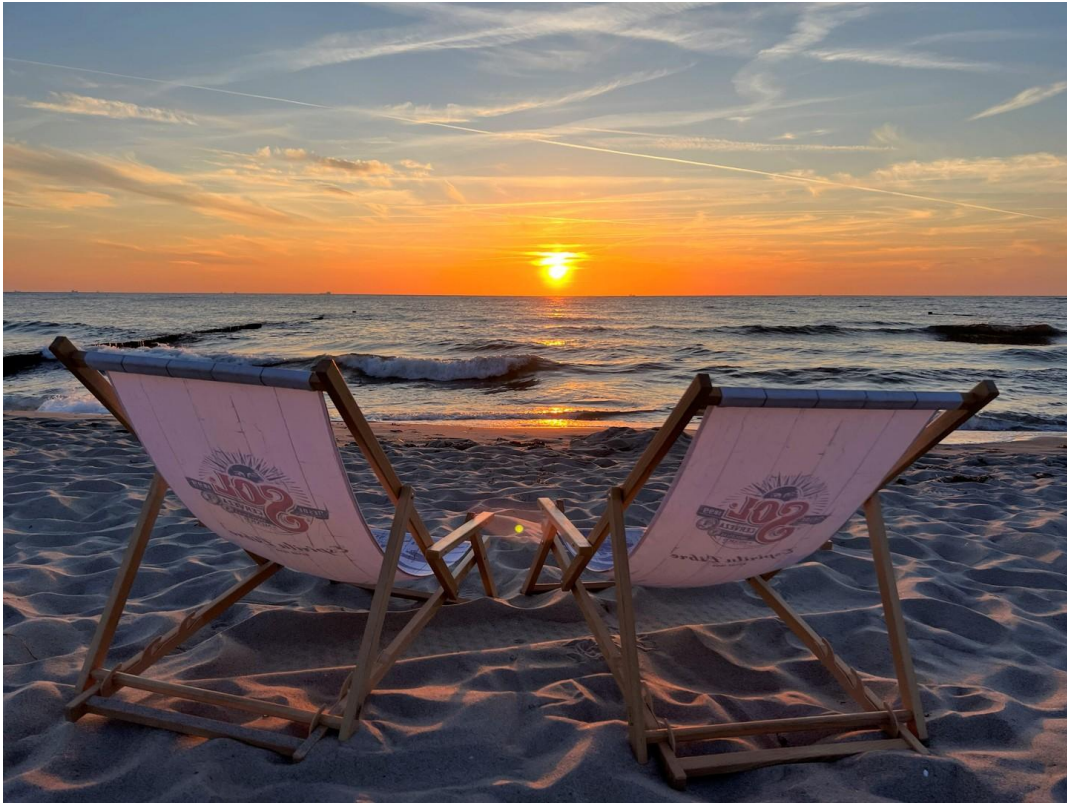
Strand von Markgrafenheide