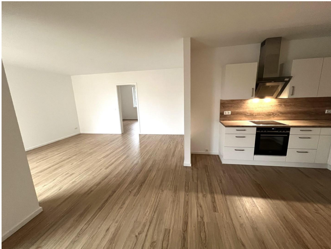
Wohnzimmer mit offener Küche