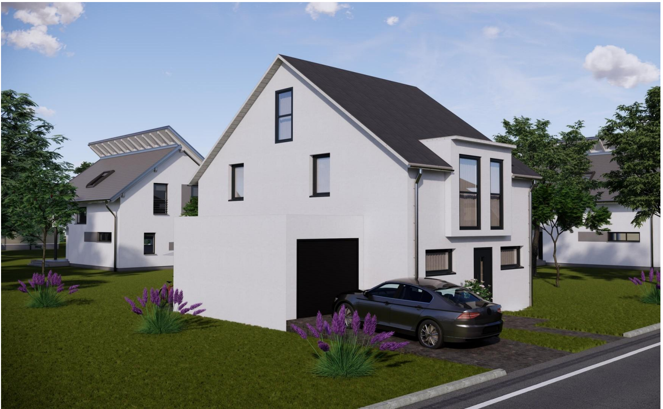
Beispiel - Straßenansicht