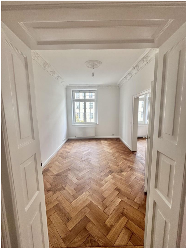
Arbeitszimmer / Schlafzimmer 2