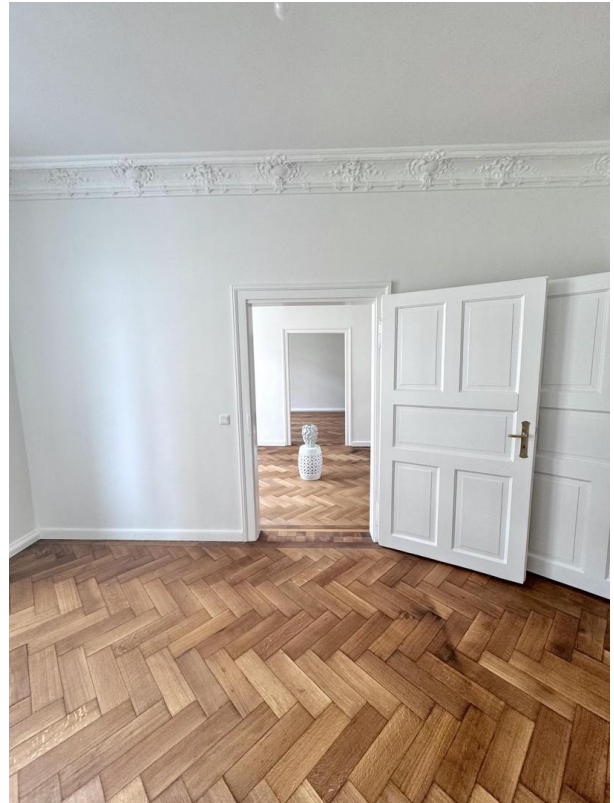
Arbeitszimmer / Schlafzimmer 2