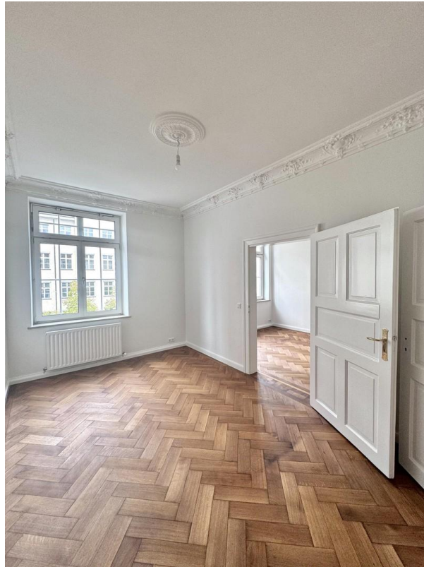
Arbeitszimmer / Schlafzimmer 2