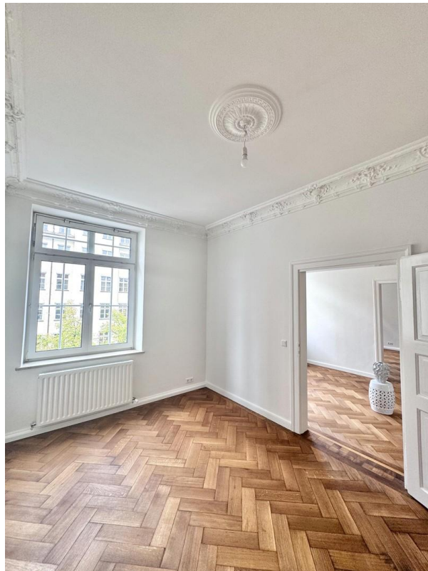
Arbeitszimmer / Schlafzimmer 2