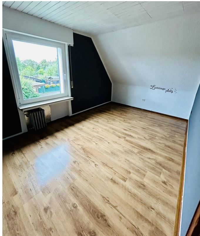
Schlafzimmer 1 OG