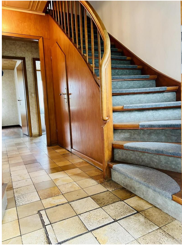
Treppe zum OG