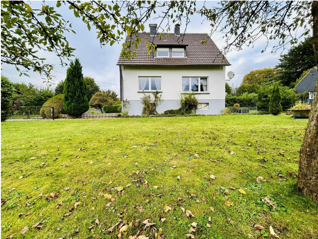
Seitenansicht vom Garten aus