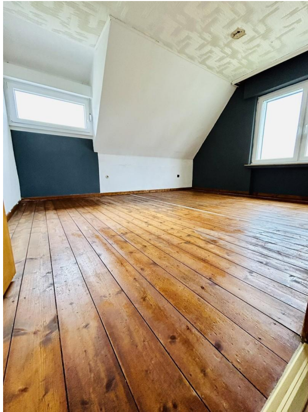
Schlafzimmer 2 OG