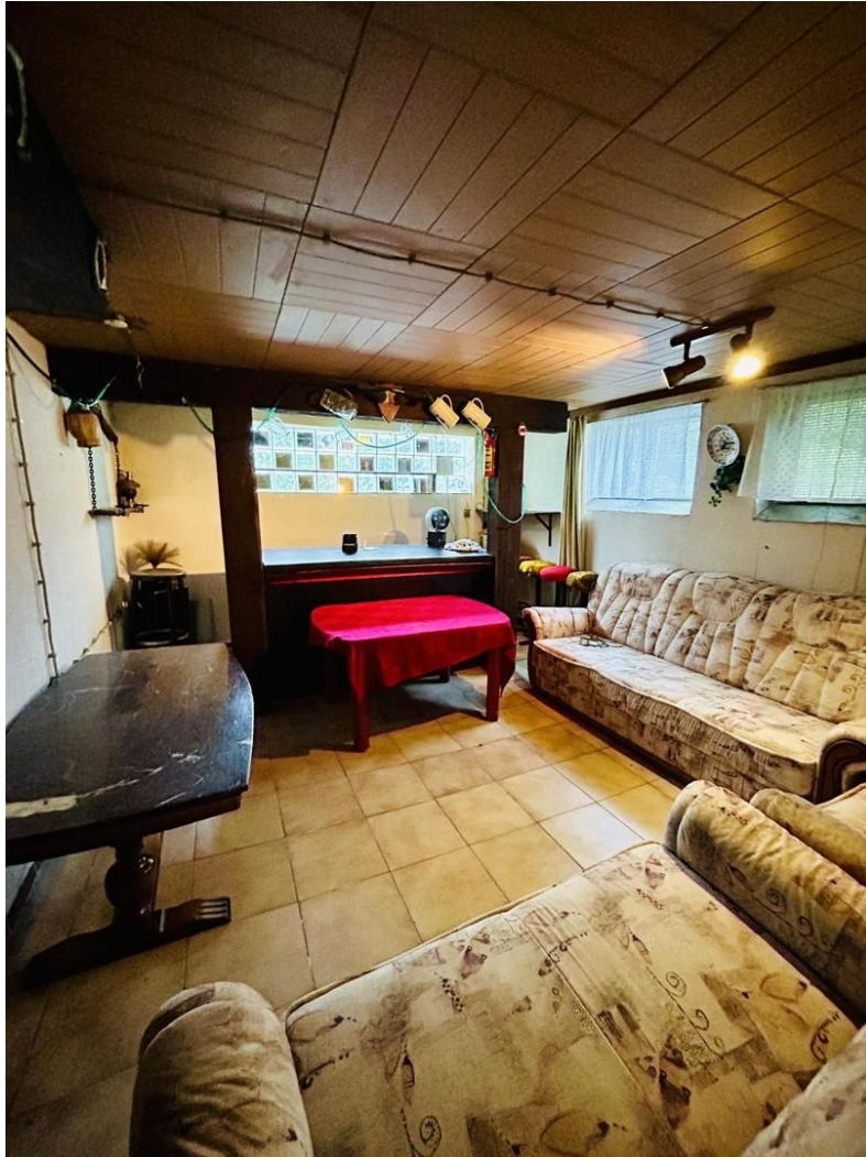
Bar im Keller