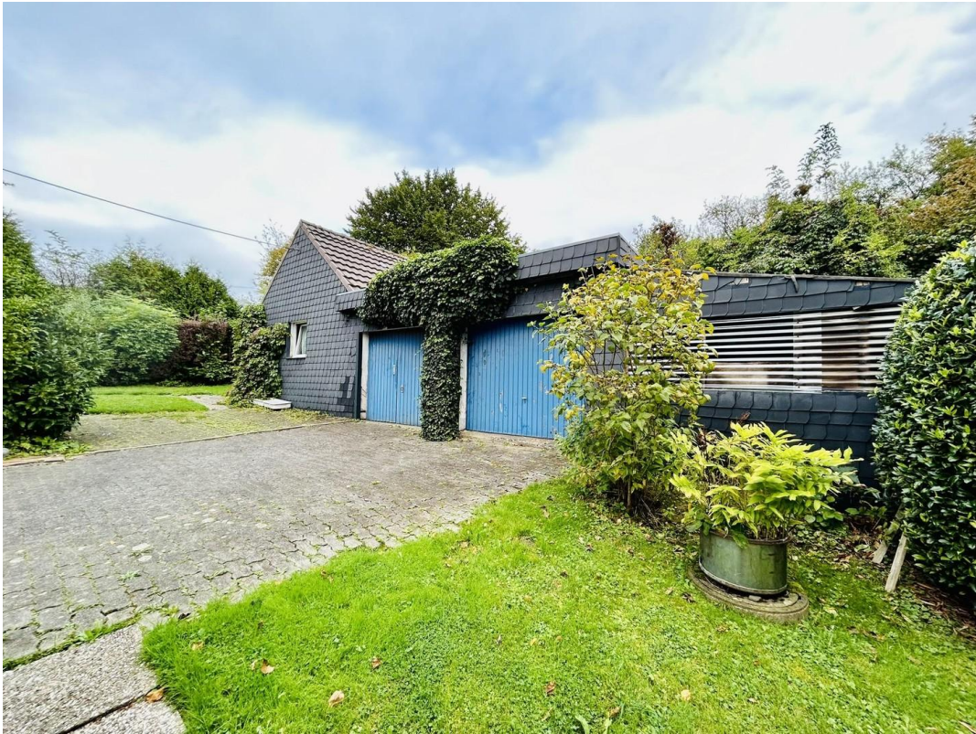
Doppelgarage + Nebengebäude