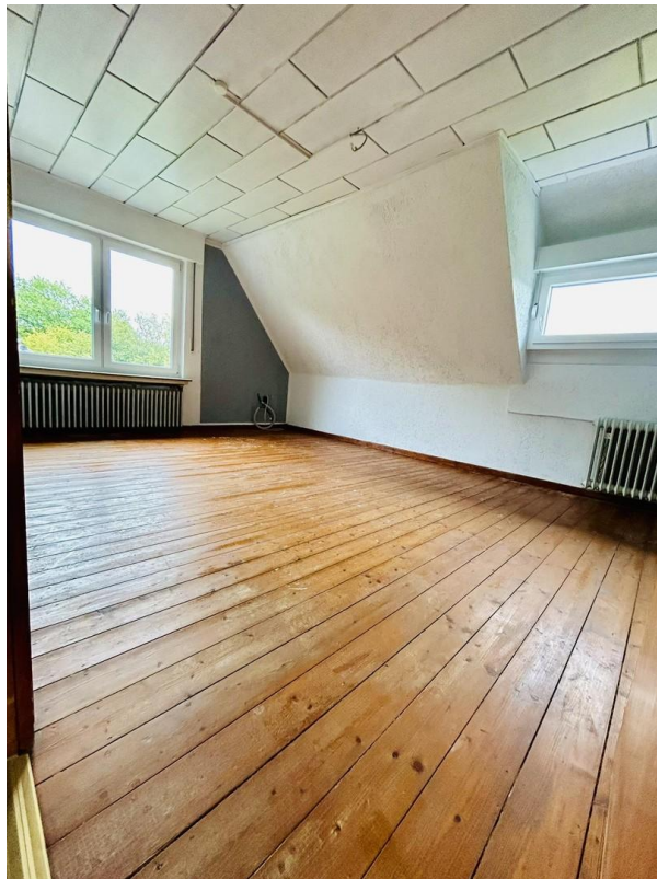
Schlafzimmer 3 OG