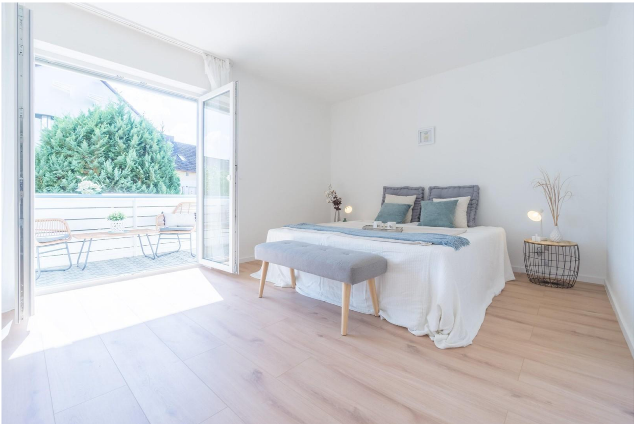
Schlafzimmer mit Balkonzugang