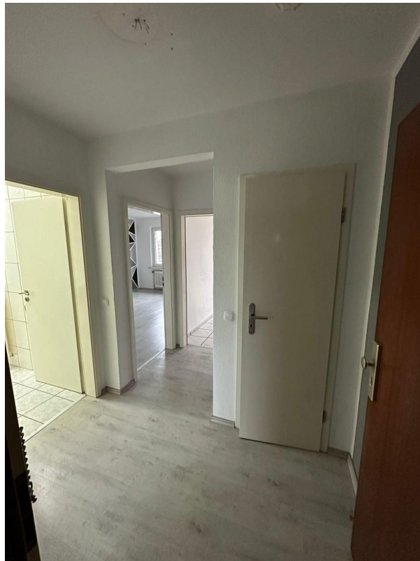
Flur / Eingangsbereich