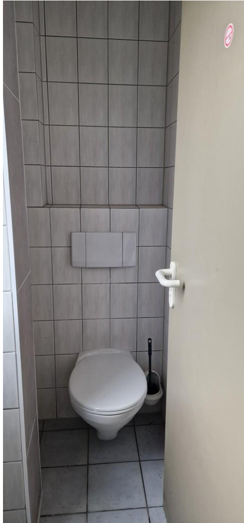
WC Raum 2