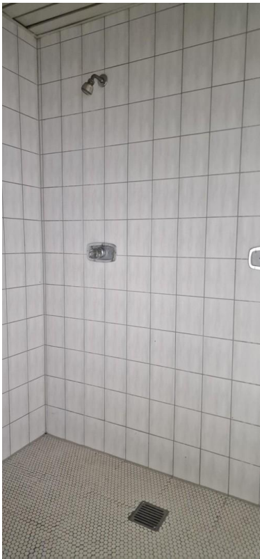
Dusche Raum 1