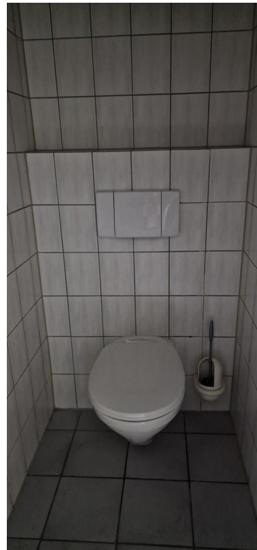
WC Raum 1