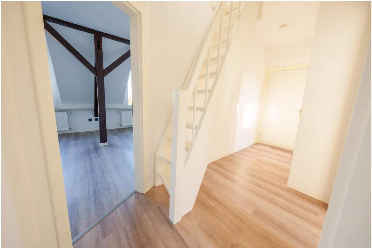
Flur + Treppe