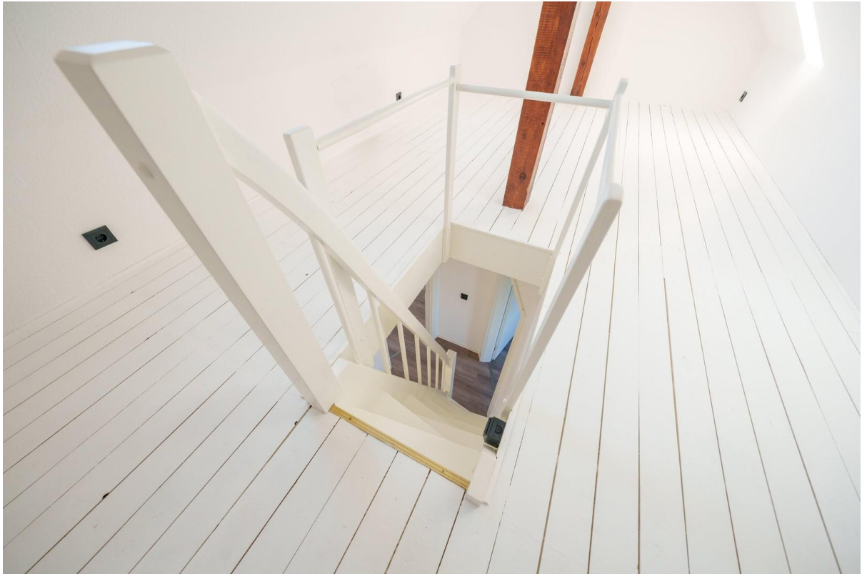
Blick vom Dachboden / Office