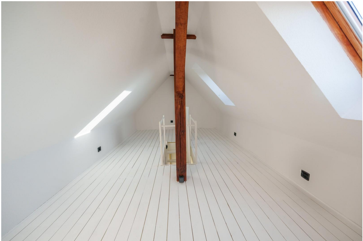
Dachboden / Office