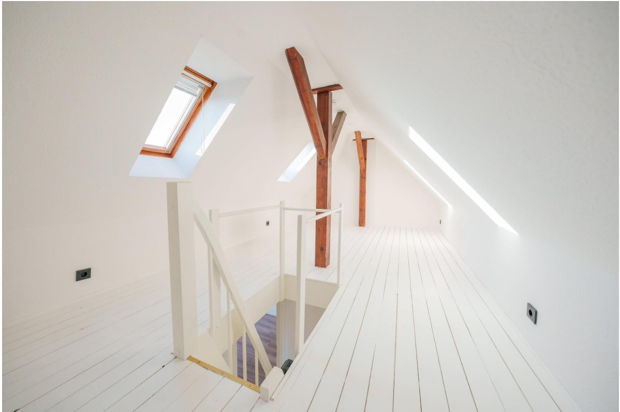
Dachboden / Office