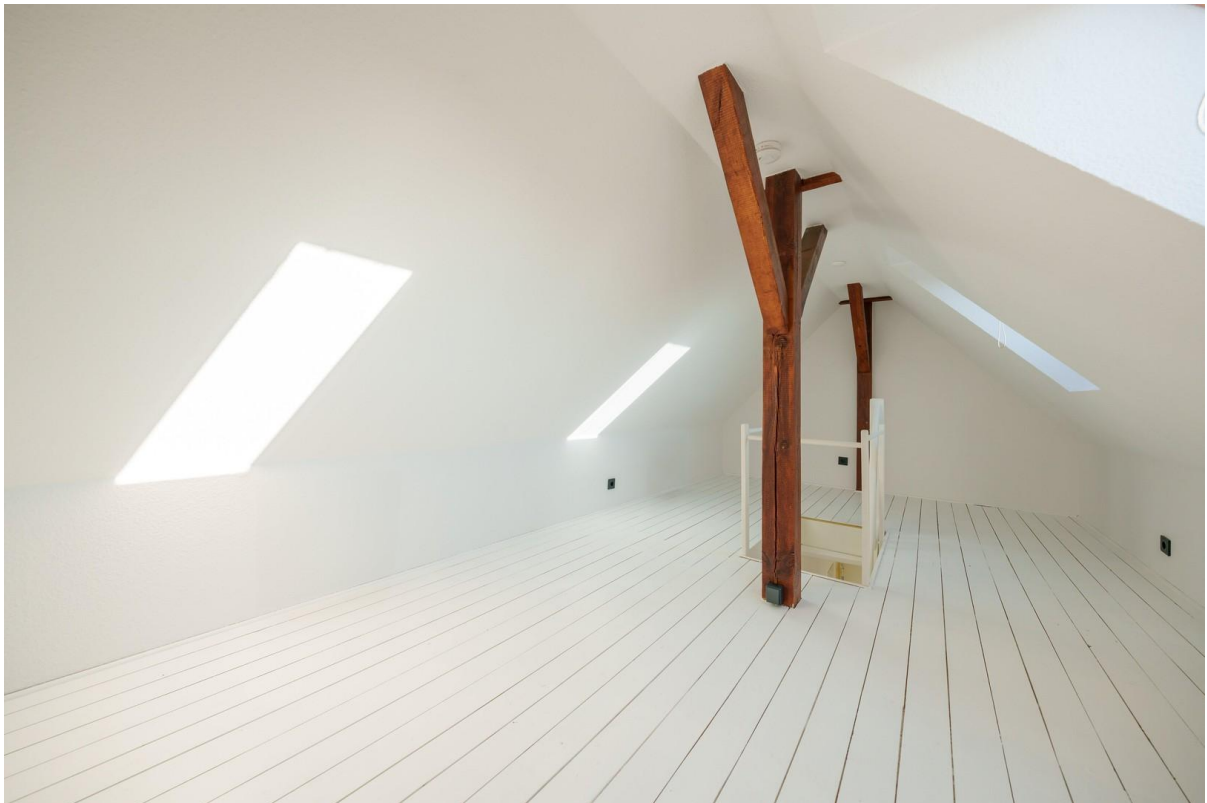
Dachboden / Office