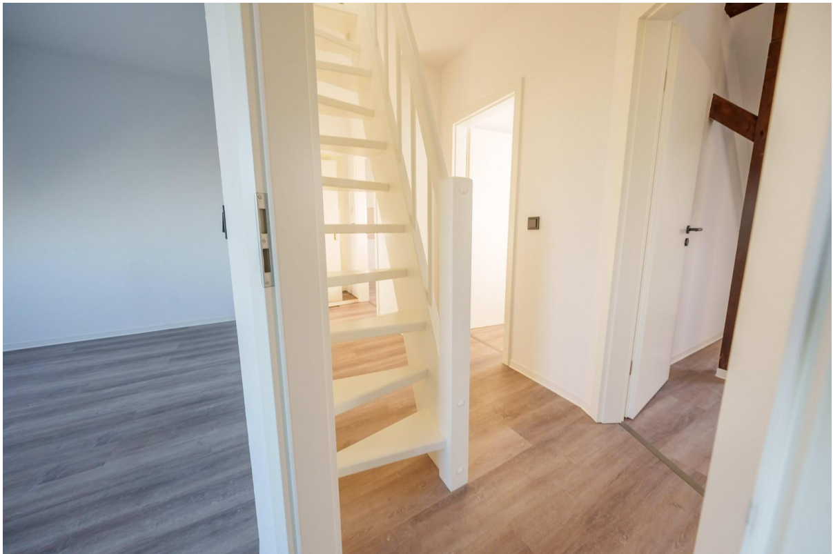
Blick in den Flur