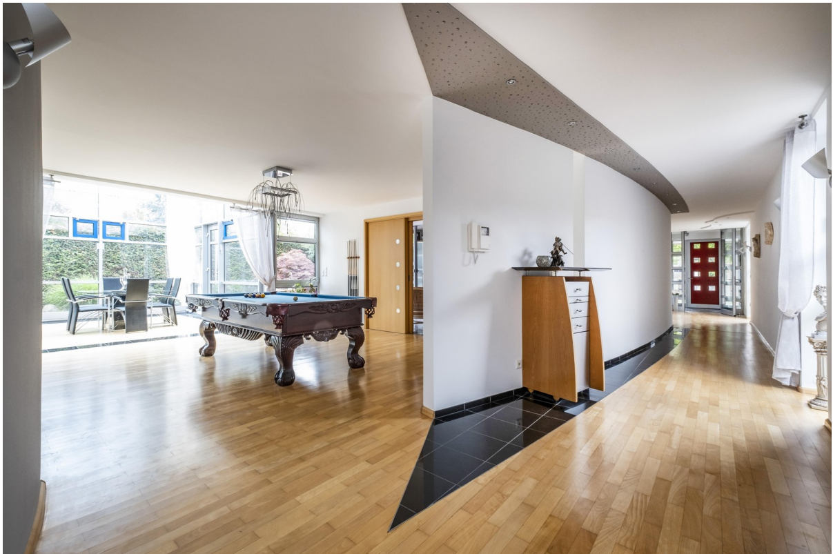
Exponatengalerie und Salon