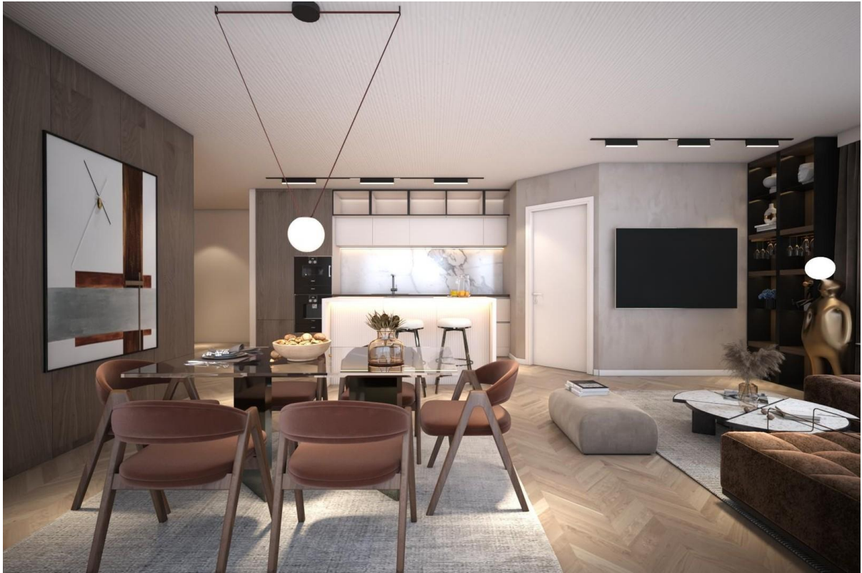
Küche Essbereich Whg. 7