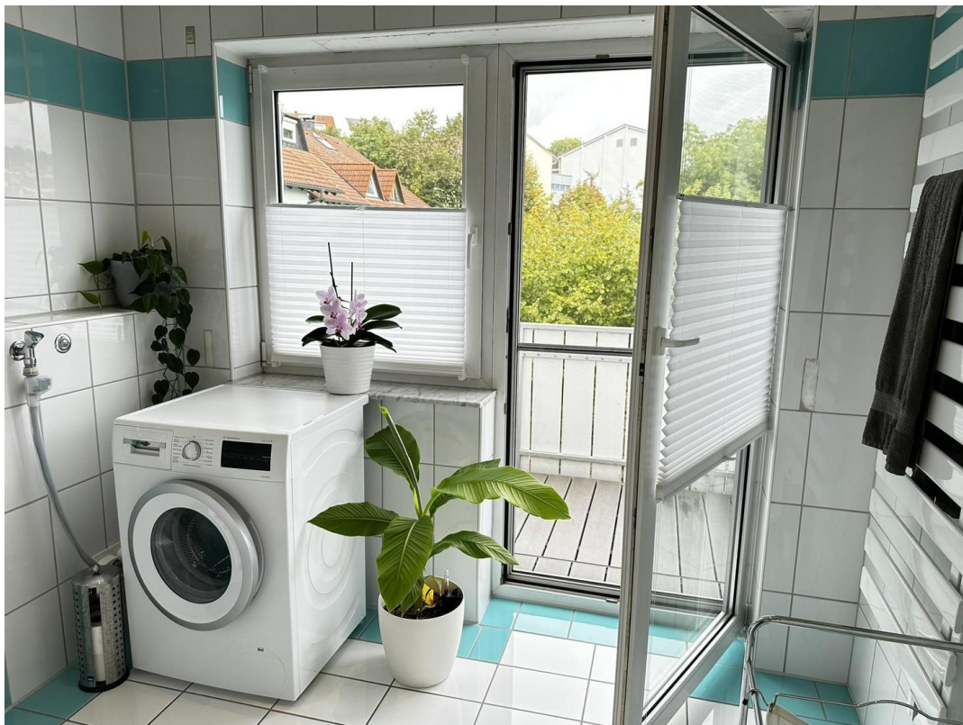
Bad mit Balkon nach Osten