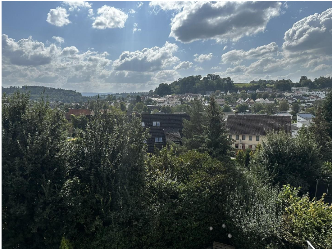
Ausblick nach Süden