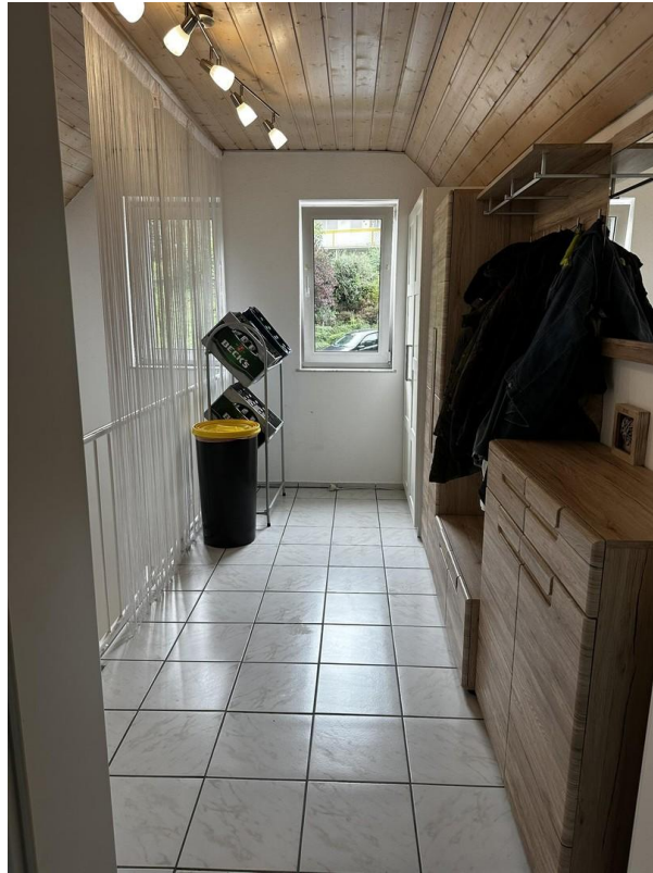
Hausflur (keine Wohnfläche)