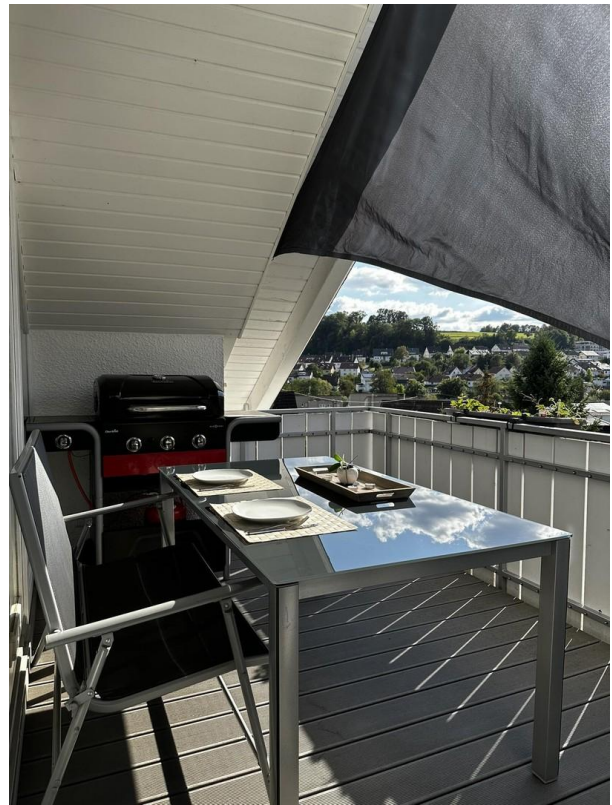
Großer Balkon nach Westen