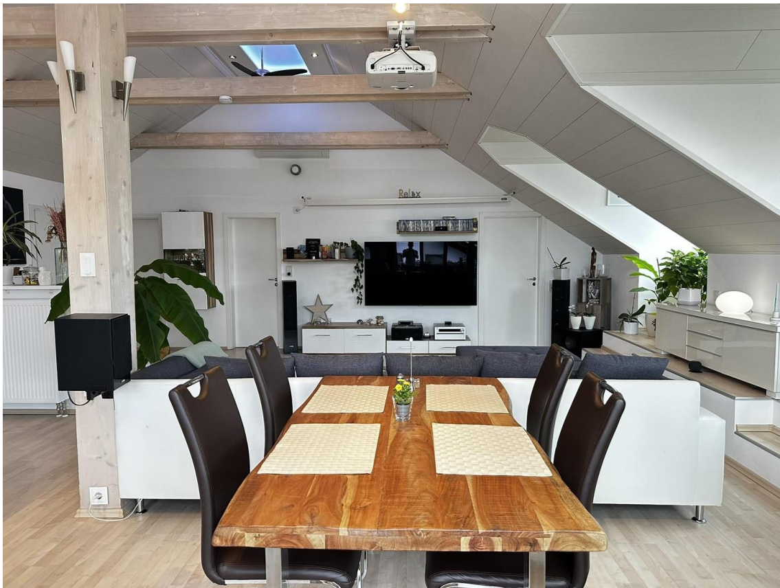
Wohnzimmer vom Esstisch aus