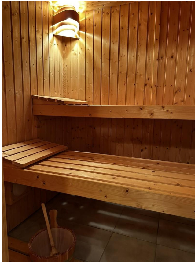
Sauna (im Keller)