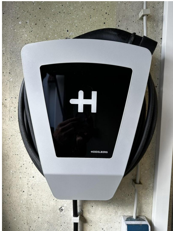
Wallbox in der Garage