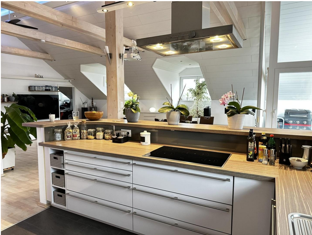
Blick aus der Küche