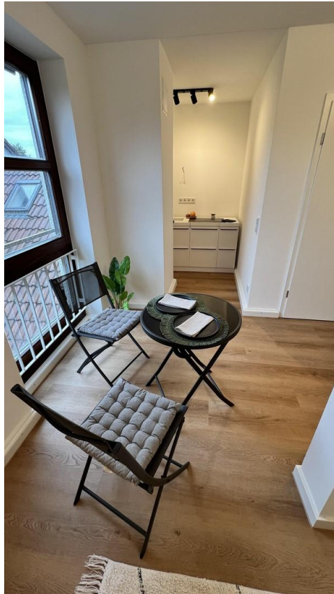
Essen / Kochen