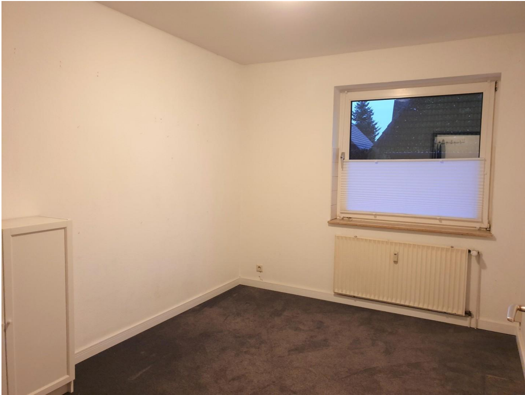
Arbeits- oder Kinderzimmer