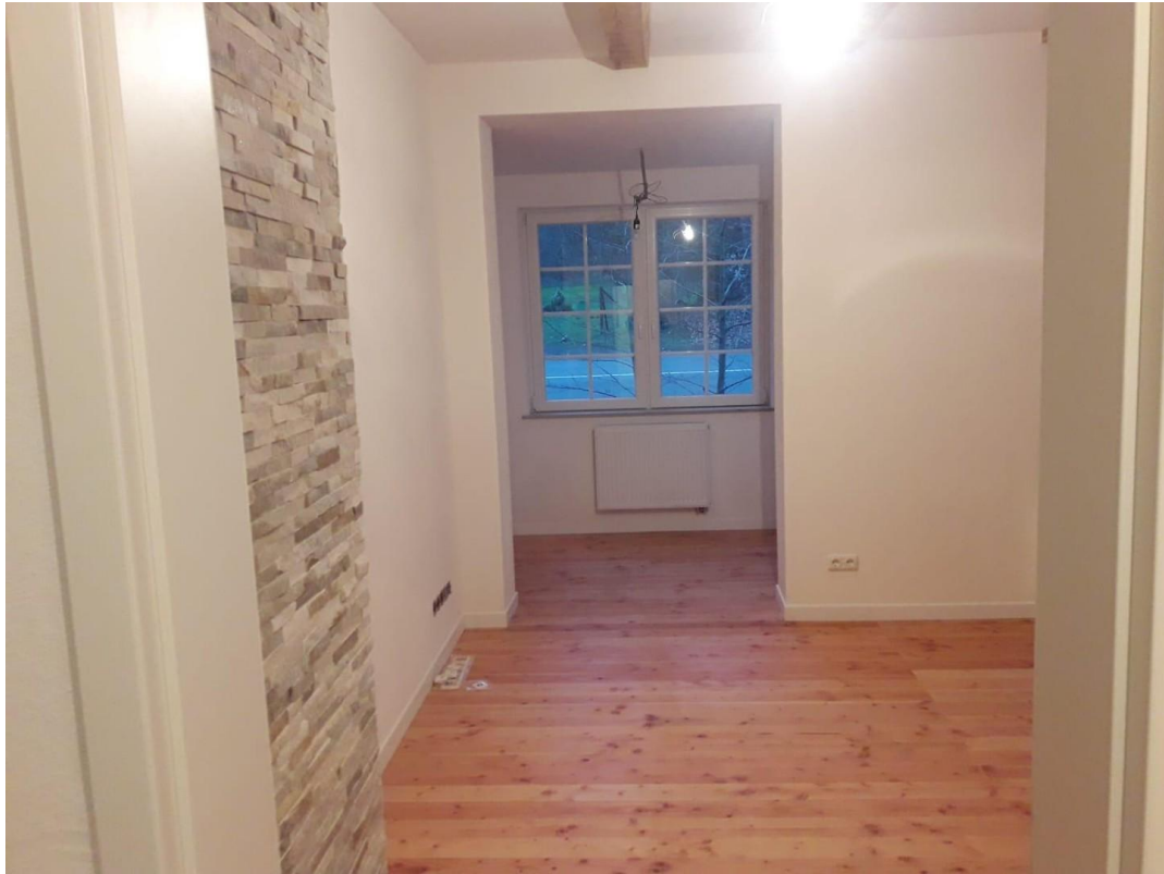
Durchgann Esszimmer EG