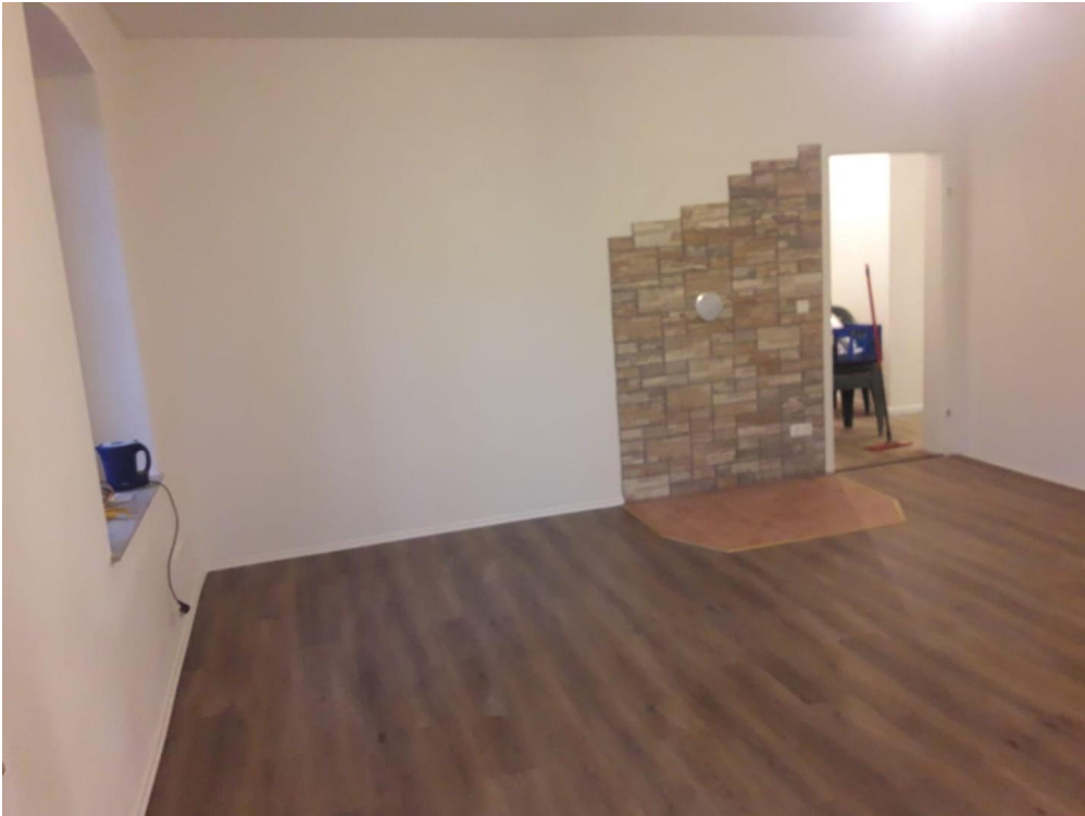
Anbau mit Tor