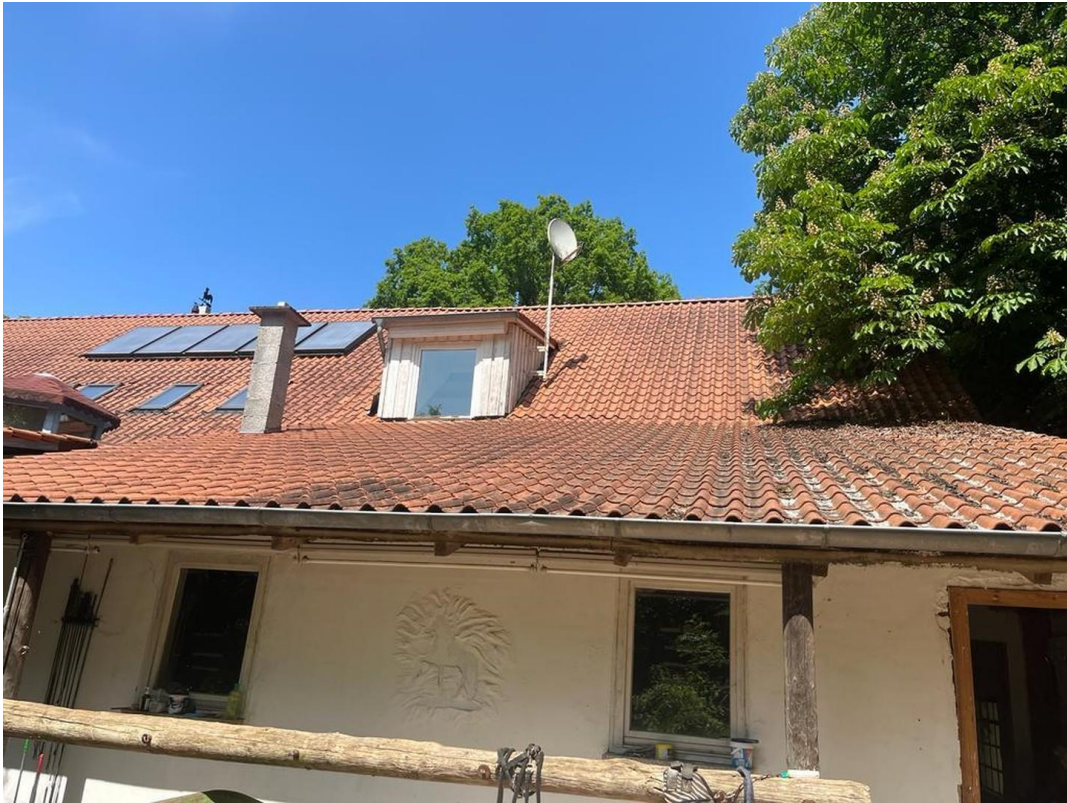
Weg zur Wiese